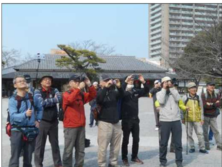
912 カラクリ時計を観る