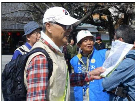
885 ボランティアガイドさんをご紹介