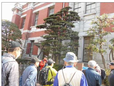
858 岡崎信用金庫資料館前で