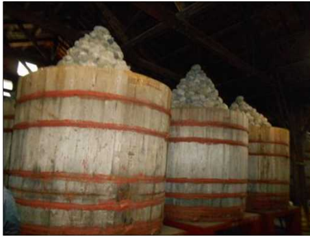
941 創業当時と同じ製法で石積み