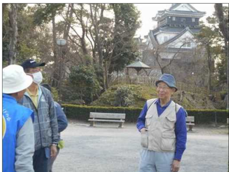
906 ガイドさんに教えて頂く