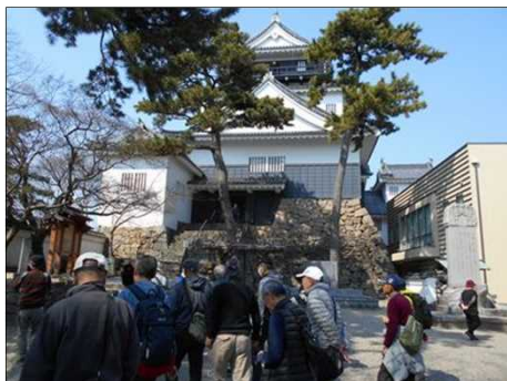
899 岡崎城の入口にて