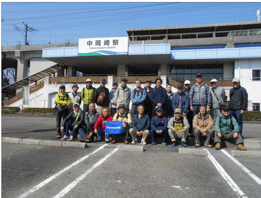
882 愛知環状線 中岡崎駅を晴天の下、24名で元気にスタート