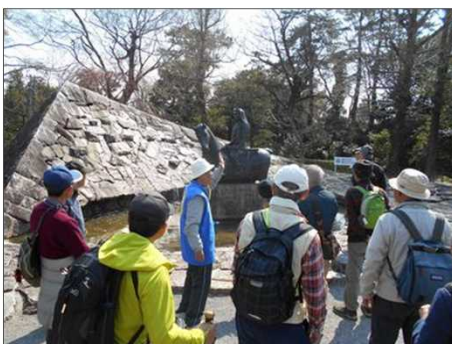
894 家康像を説明して頂く