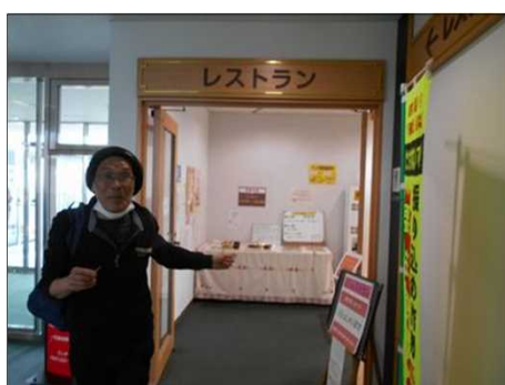
867 岡崎市役所内職員食堂で