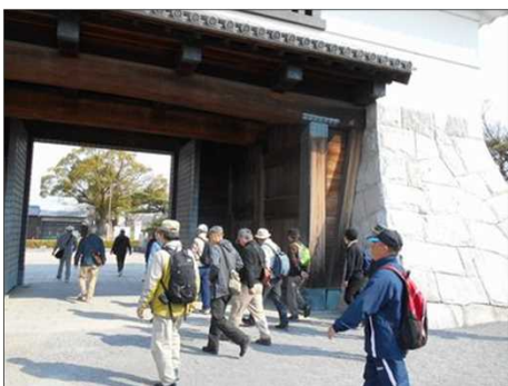
921 いよいよ八丁味噌へ