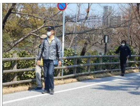
883 岡崎城内の桜並木