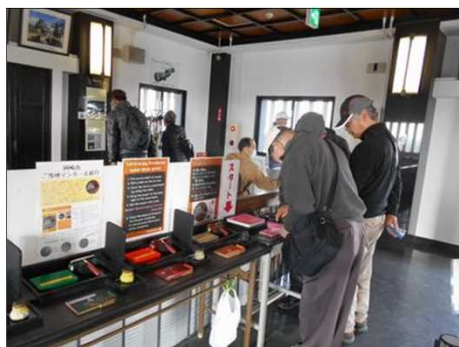
900 城内で遺品を観る