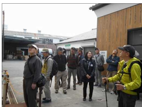
929 新人さんの説明を聴く