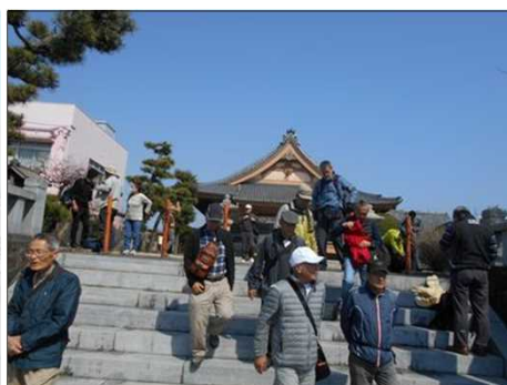
856 大林寺で初回の休憩