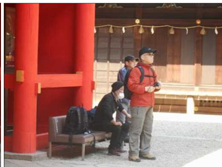
876 ビデオカメラを片手に