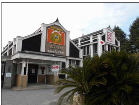
923 八丁味噌の老舗「カクキュー」