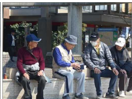
879 ベンチで暫し休憩