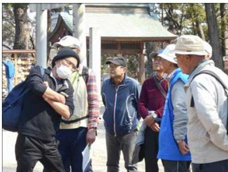
897 雑談で盛り上がる