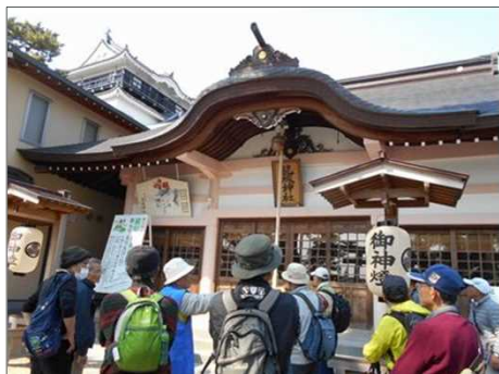
896 龍城の謂れを知る