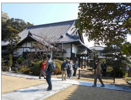
861 隋念寺 境内にて