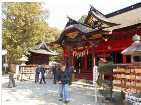
837 整備が行き届いた六所神社