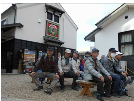
927 工場見学の順番待ちで