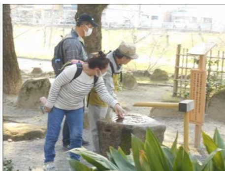
904 家康の産湯の井戸で