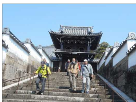
864 趣ある立派な山門