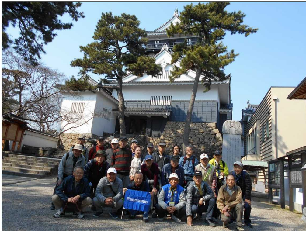
901 ボランティアガイドさんと一緒に、岡崎城を背景にして記念撮影