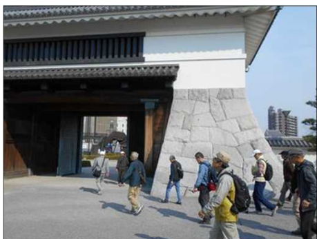
920 岡崎城に別れを告げる