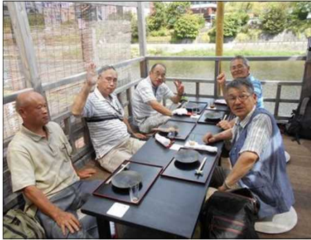
1242 食事が待ち遠しい