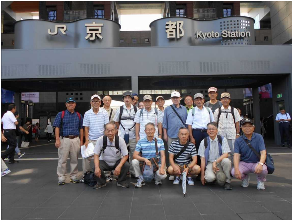
1232 京都駅を、19名でスタート