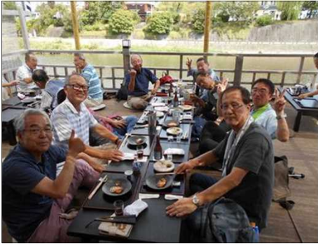
1241 鴨川の床で京料理を頂く