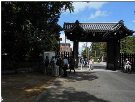
1233 京都御所の朔平門から境内に入る