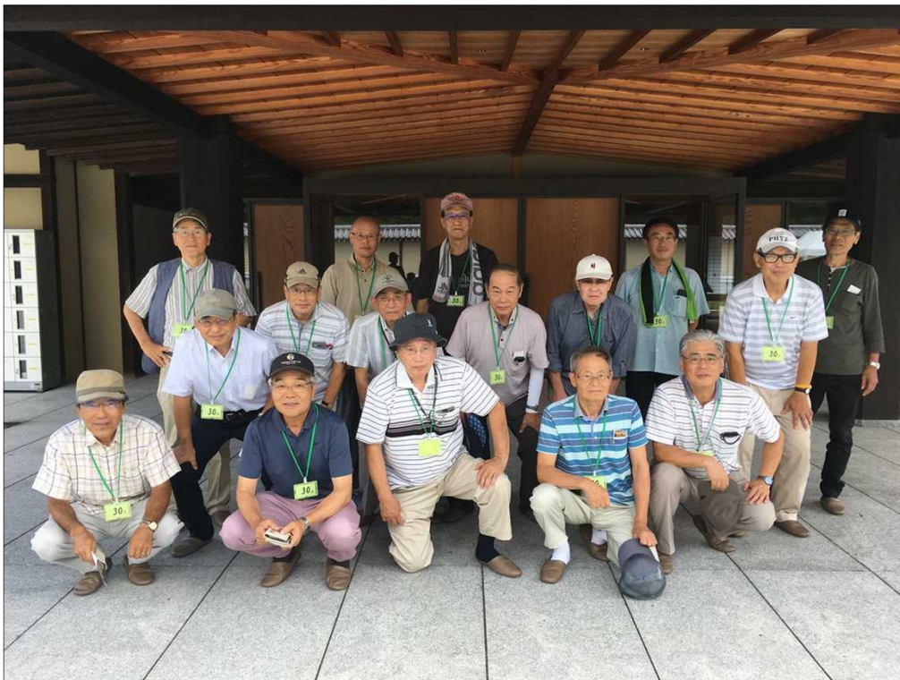
30 京都迎賓館 玄関前にて