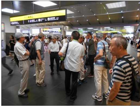
1228 スタート前のワクワク