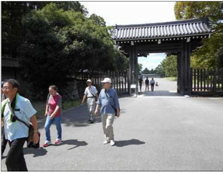
1238 一路 先斗町の料理屋へ