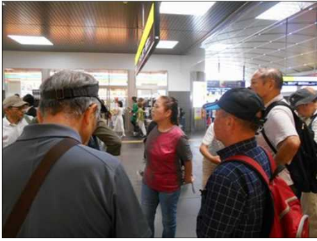
1227 京都駅で待ち合わせ