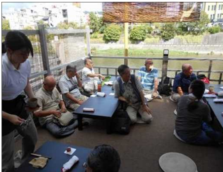
1245 すだれの下にそよ風