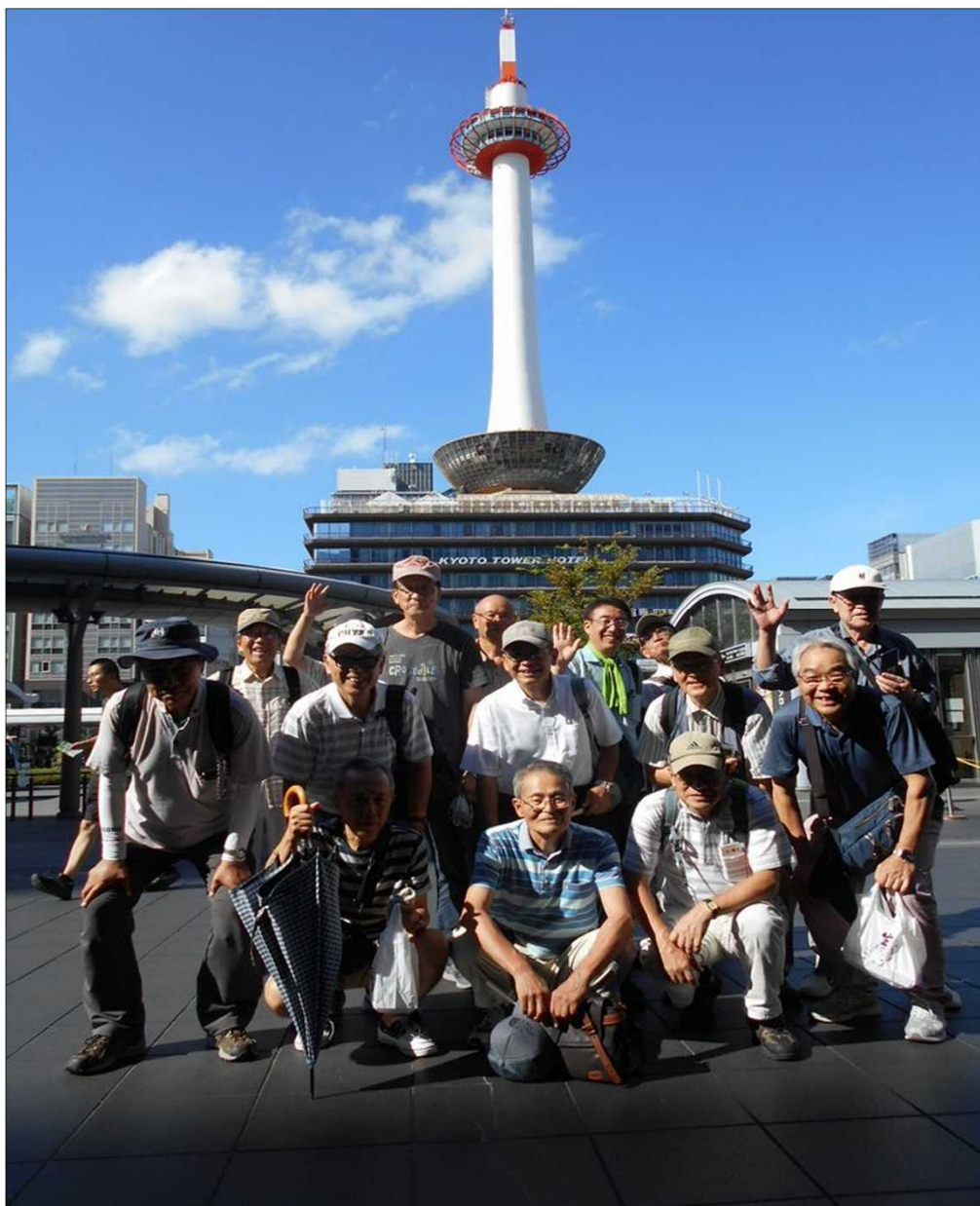
1248 無事元気にゴール！お疲れ様でした(京都タワーを背景にして)