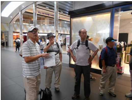
1230 トイレから戻る人を待つ