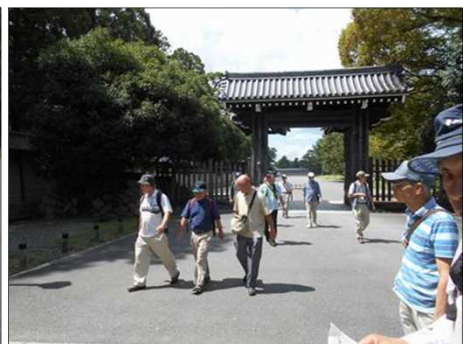
1237 京都御所を後にする