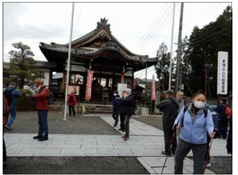
3022 長福寺で最初の休憩