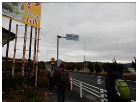
3025 19号バイパス沿いを歩く