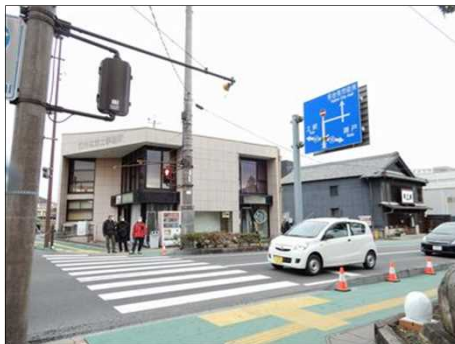
3059 オリベストリート出て