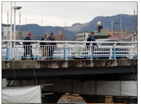
3063 ゴール近くの橋を渡る