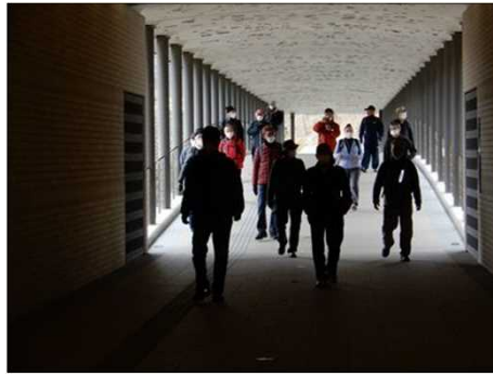
3050 セラミックパークMINOにて