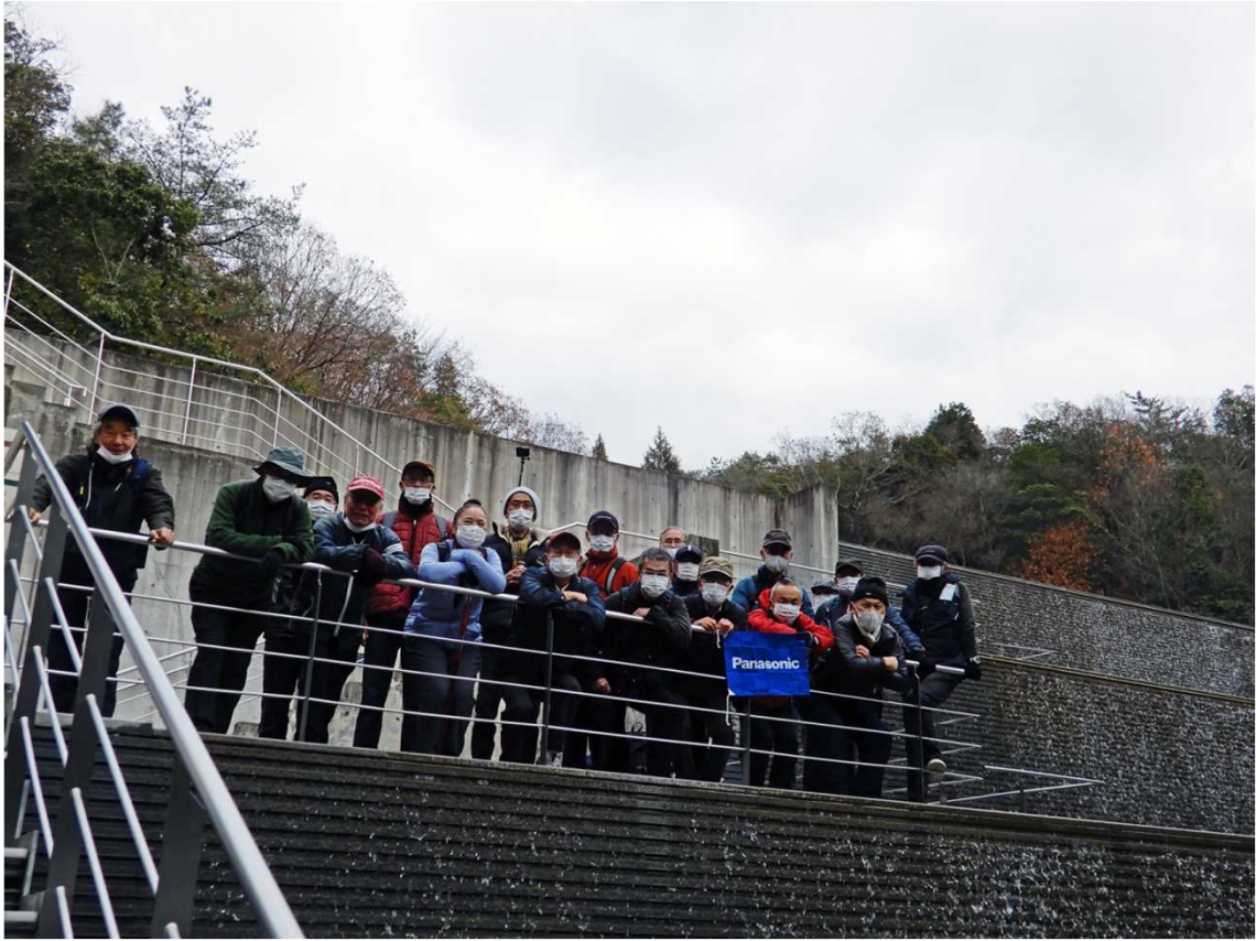
3051 セラミックパークMINOの壁面滝で全員写真