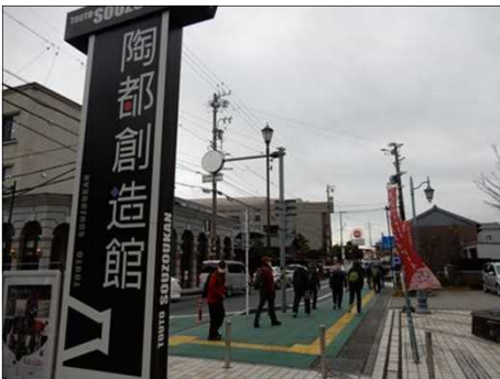
3058 陶都創造館を通過