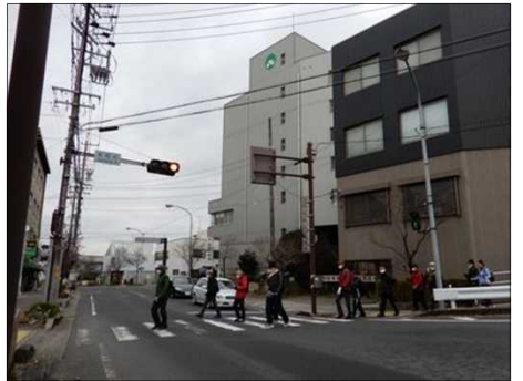
3057 オリベストリートに入る