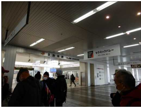
3012 多治見駅改札口で