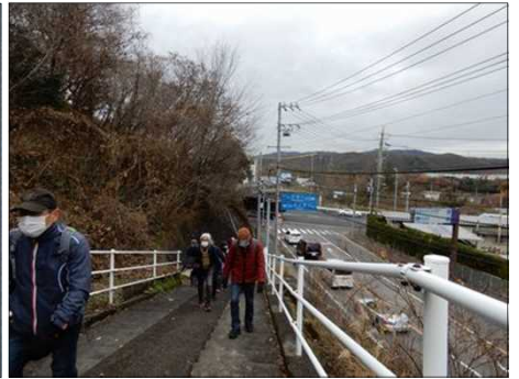
3033 長い階段の始まり