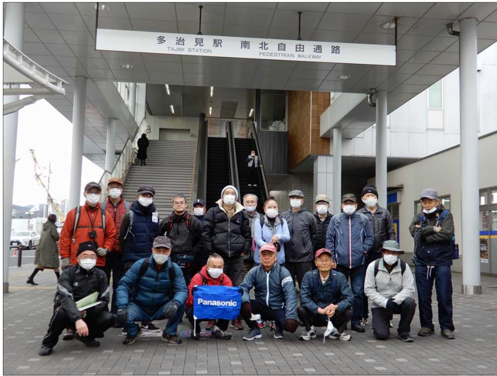
3020 多治見駅を、19名で元気にスタート