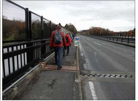
3029 一列になって歩く