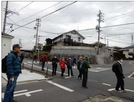
3055 いよいよ市街地へ