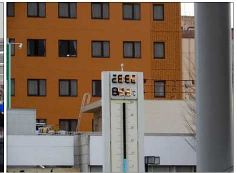
3015 有名な多治見駅前温度計