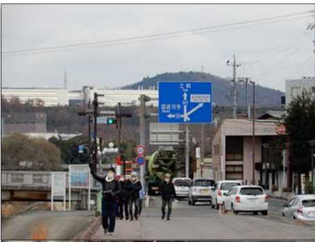
3061 土岐川左岸で足取り軽く