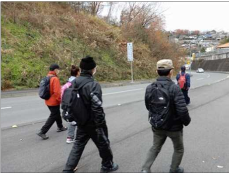
3054 下り道で足取りも軽く