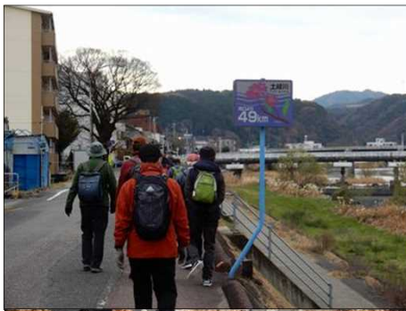
3062 無事に下りて来ました。