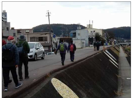
3060 土岐川左岸を歩く