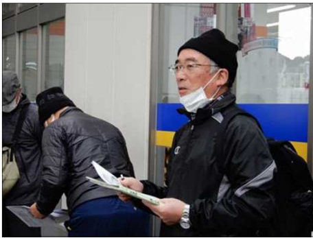
3017 小山幹事から説明