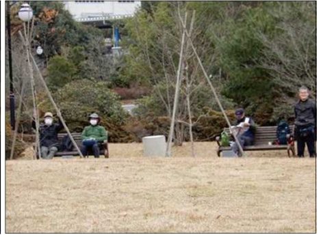
3046 マスクして雑談す