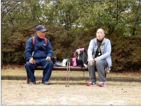
3044 昼食を頂いて雑談