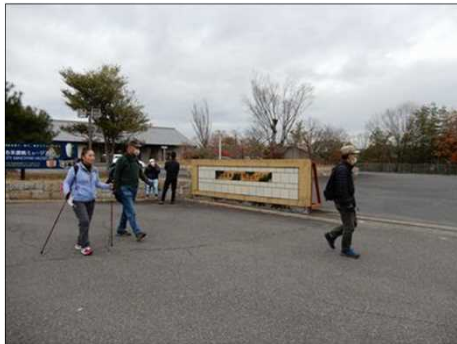
3035 美濃焼ミュージアム前を通過