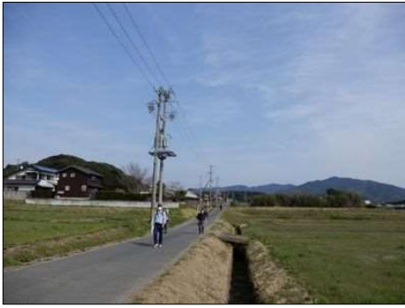
3251 整備された農道を行く