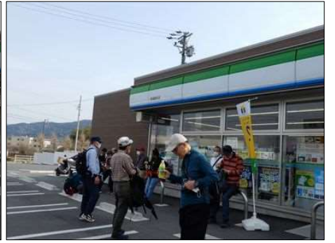
3257 英気を養っていざ