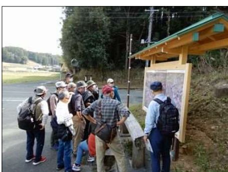
3249 織田軍と武田軍の戦を紹介