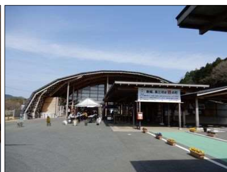
3234 『もっくる新城』の正面玄関