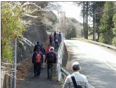
3227 杉木立の中を進む