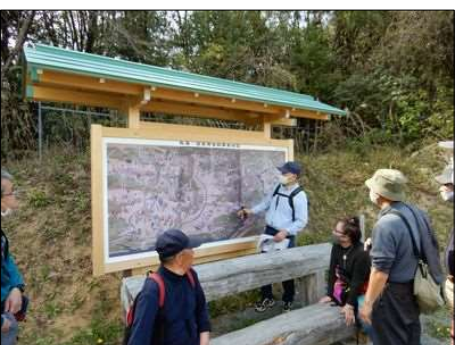
3244 綺麗な絵図で戦いを説明