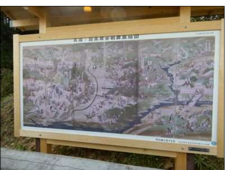
3250 素晴らしい歴史絵図