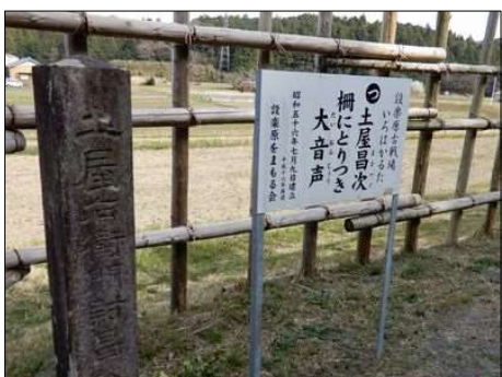
3242 織田軍の馬防柵と鉄砲台