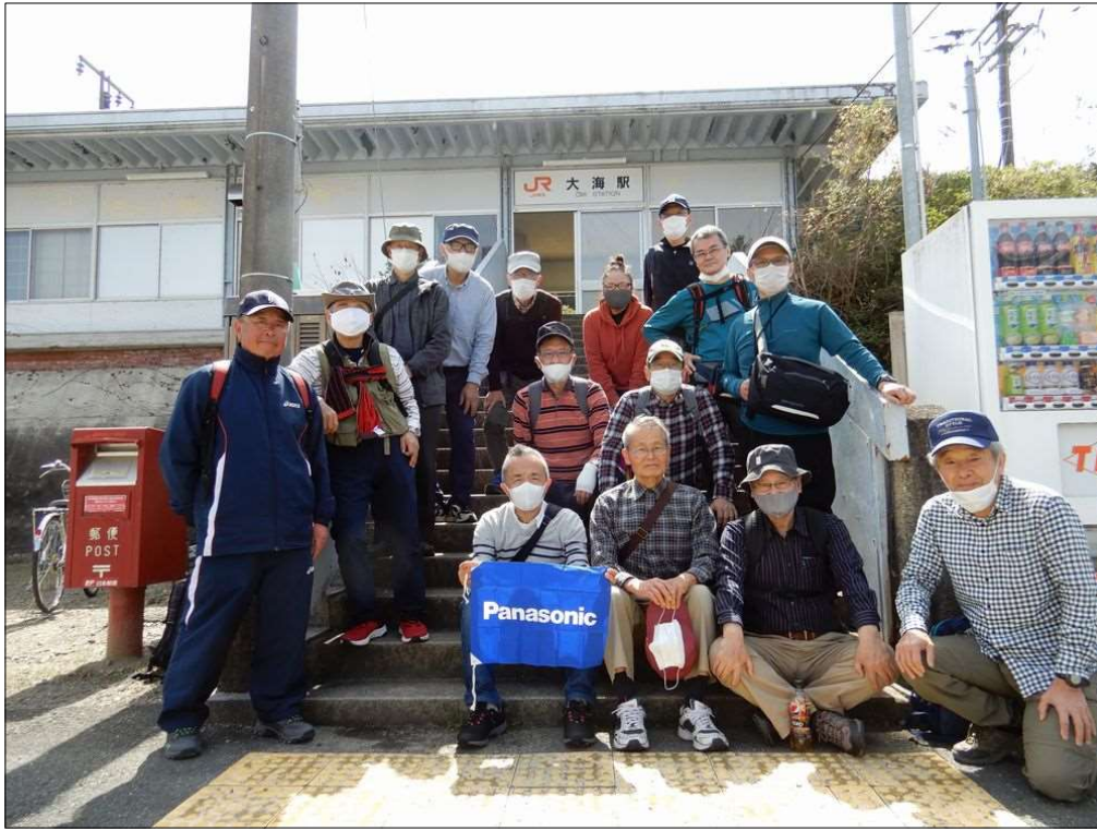
3226 大海駅到着、15名でスタート