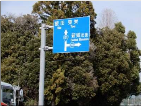
3259 道は国道151号線 信州へ