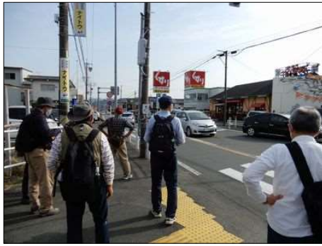
3260 いよいよお店が増えてきた