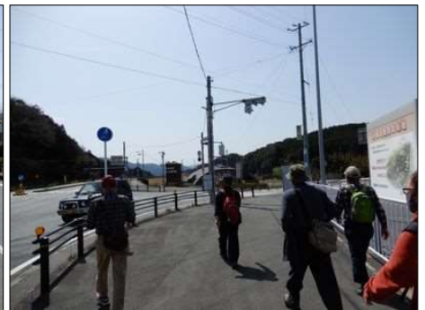
3229 道の駅『もっくる新城』が視野に