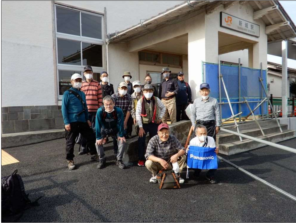
3263 無事元気にJR新城駅に到着！お疲れ様でした