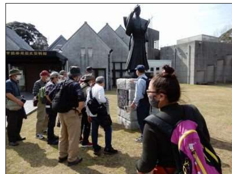
3238 岩瀬忠震の偉業を説明