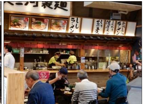
3232 食堂で新城を味わう