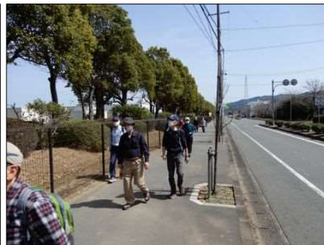
3228 大きな工業団を行く