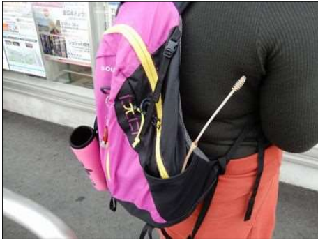
3254 長い土筆を見つけた