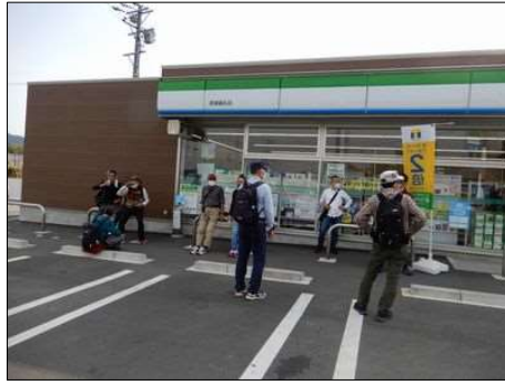
3256 コンビニで最後の休憩