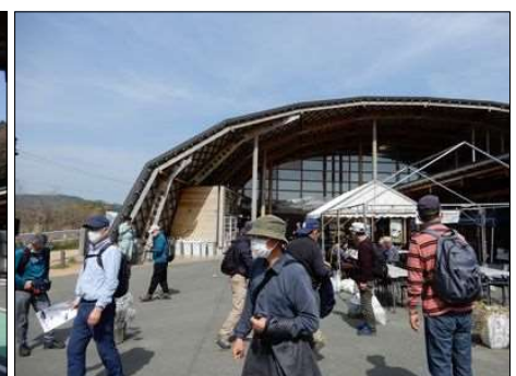
3235 屋食後英気を養った！