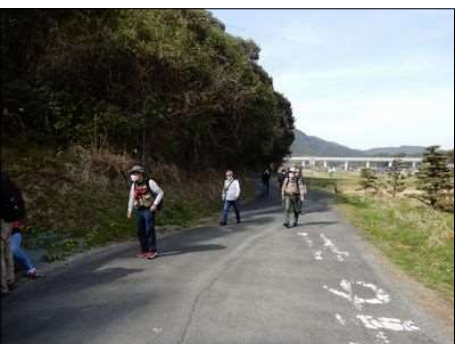
3247 マスク着用して行く