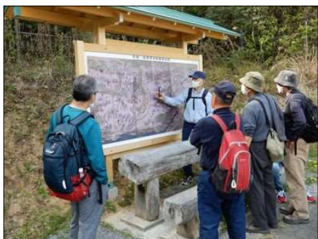
3245 騎馬戦術と鉄砲隊を