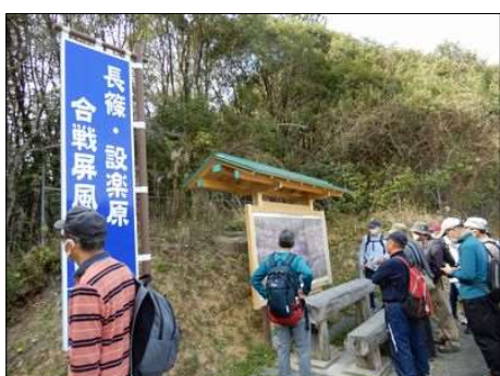
3248 馬防柵は大きな観光資源