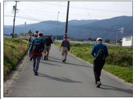
3253 ひたすらに真っすぐ歩く