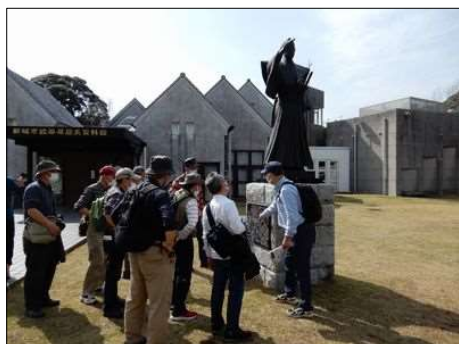
3239 開国を進言した外交官