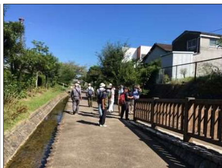
122 『せせらぎ広場』に行く