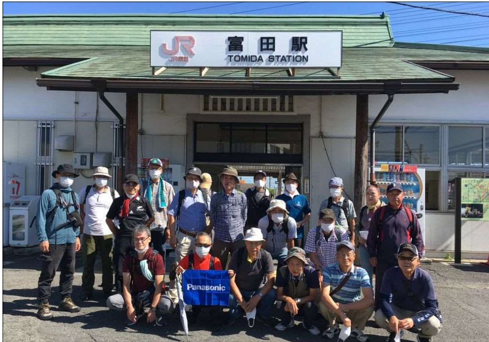
86 富田駅到着、21名でスタート