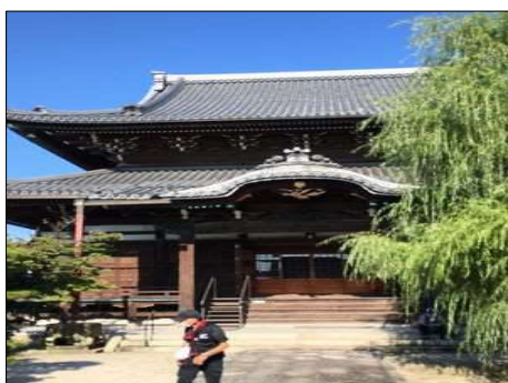
126 大きな屋根の善教寺