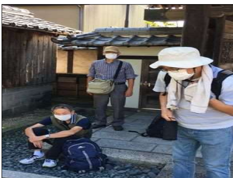
130 しっかりマスク着用