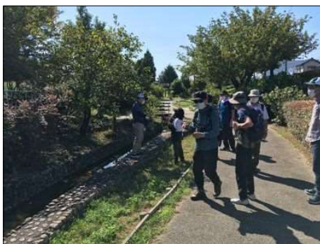
120 道端の柿を取る(了解済)