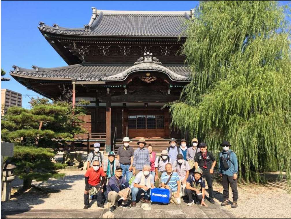
135 無事元気にゴール！お疲れ様でした(善教寺にて)