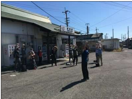
89 富田駅前ストレッチ体操