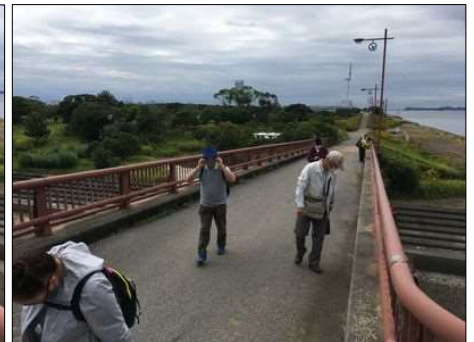
75 川には貝殻だらけ