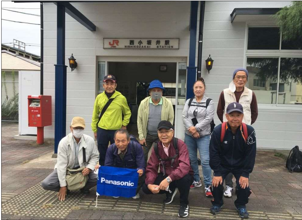
61 JR西小坂井駅到着、9名で皆さん揃って元気にスタート