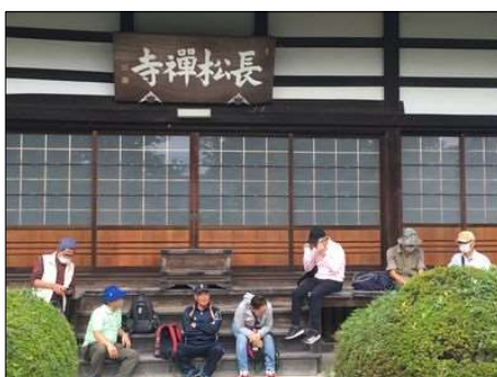
80 長松寺にて暫し休憩