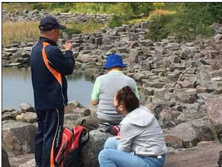
66 川の石の河原で昼食