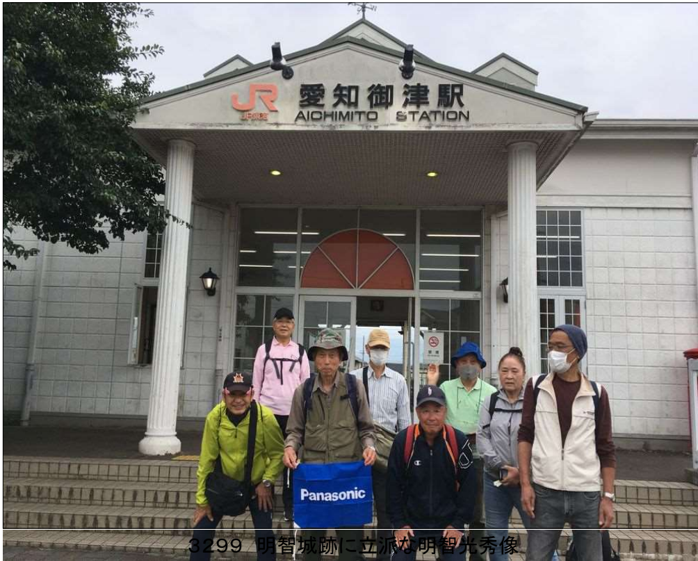
82 JR愛知御津駅に無事到着、天気にも恵まれたウォークでした。