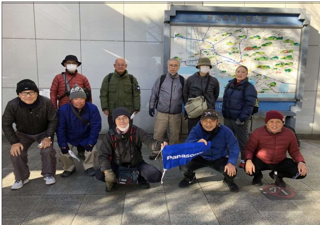
82 名古屋駅(太閤通口)を、11名でスタート