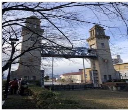
81 反対から見る松重閘門