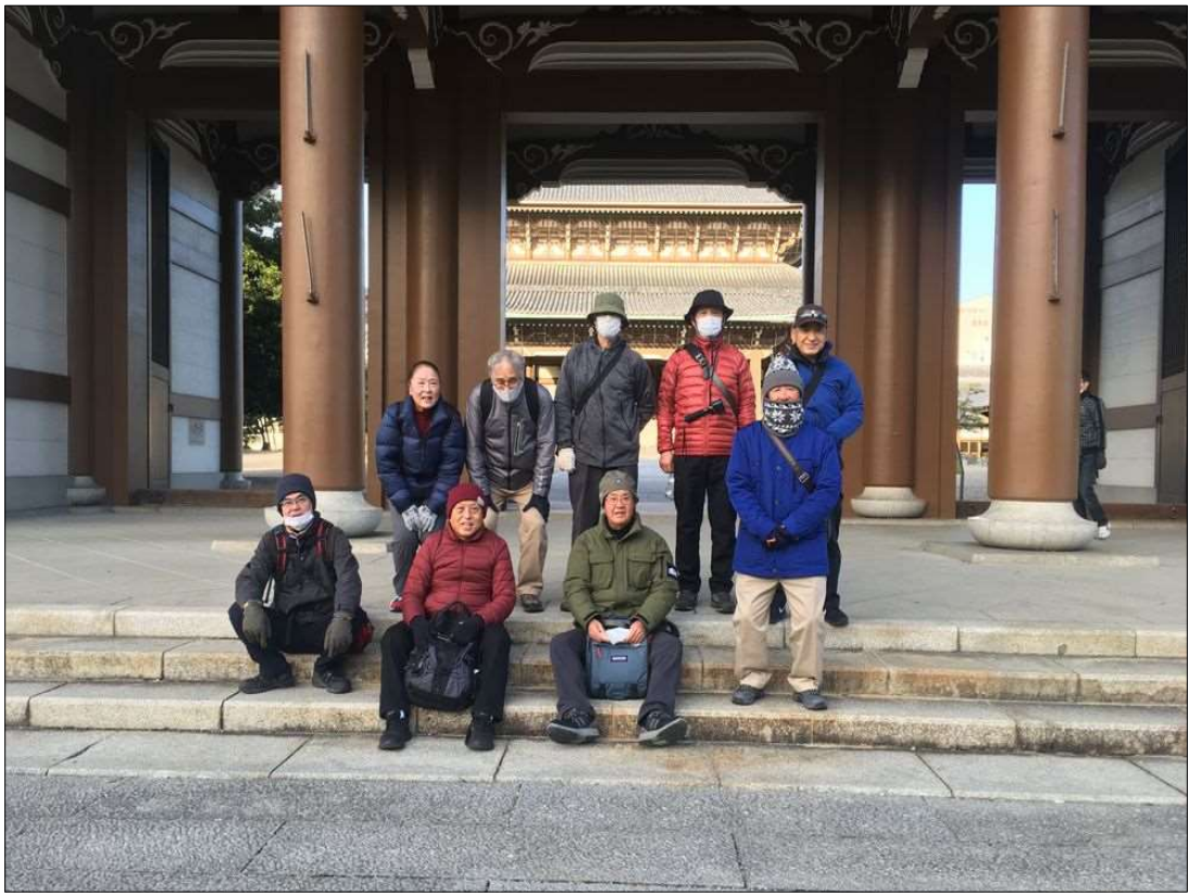
78 真宗大谷派名古屋別院門前にて