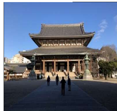
85 真宗大谷派名古屋別院