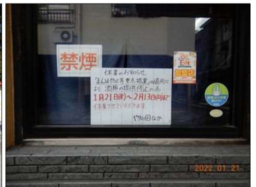
08 あちこちで休業のチラシが