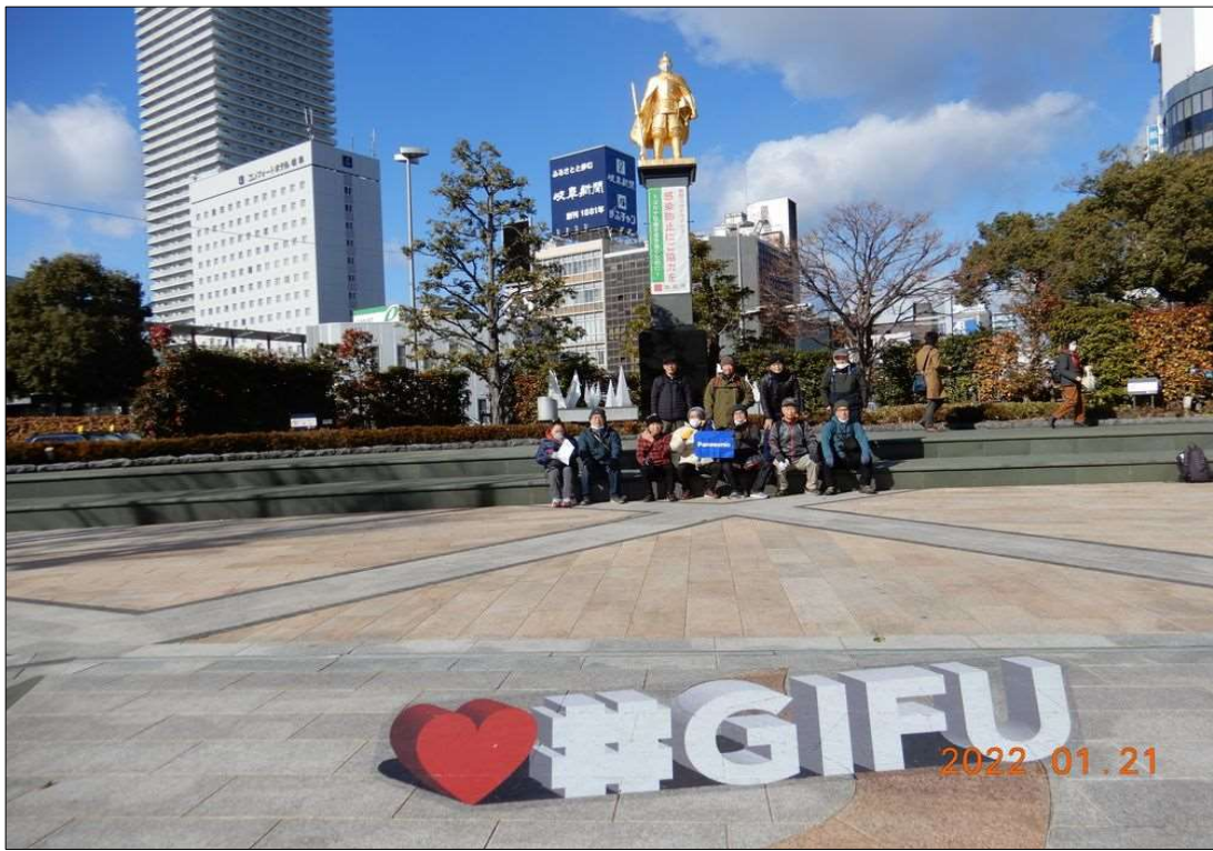
01 JR岐阜駅、11名で元気にスタート