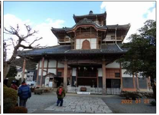
15 建屋が小さく感じる