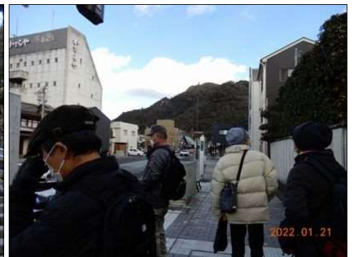
12 岐阜大仏に向かう