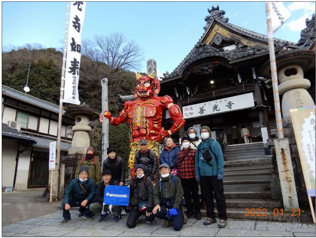
11 大きな赤鬼に金棒