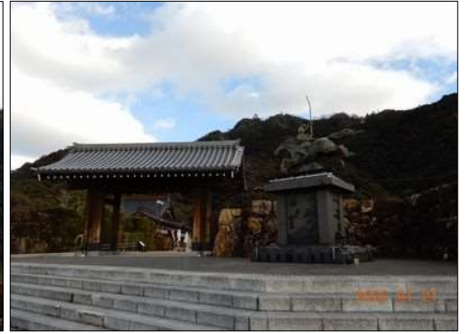
18 金華山近くには寺・神社が多い