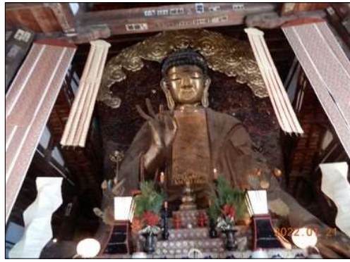
14 大きさに圧倒される