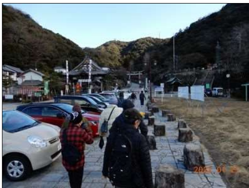
09 伊奈波神社に向かう