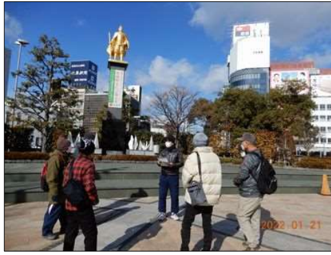
00 冬の空に黄金の信長像が映える