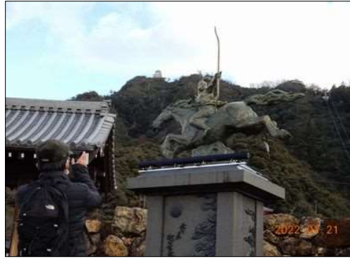
17 馬に乗る少年の像