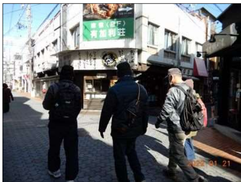
05 店頭には『休業』の案内が