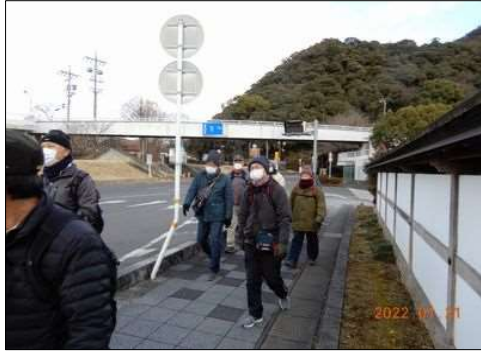
16 岐阜公園から引き返す