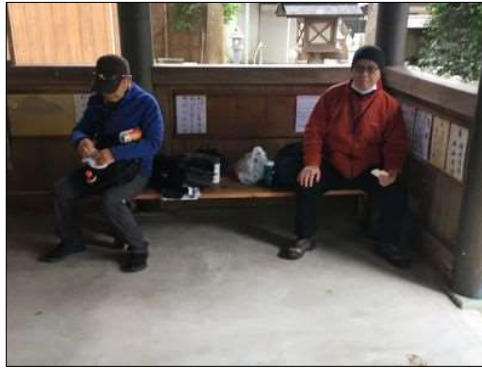
33 神社でお昼を頂く