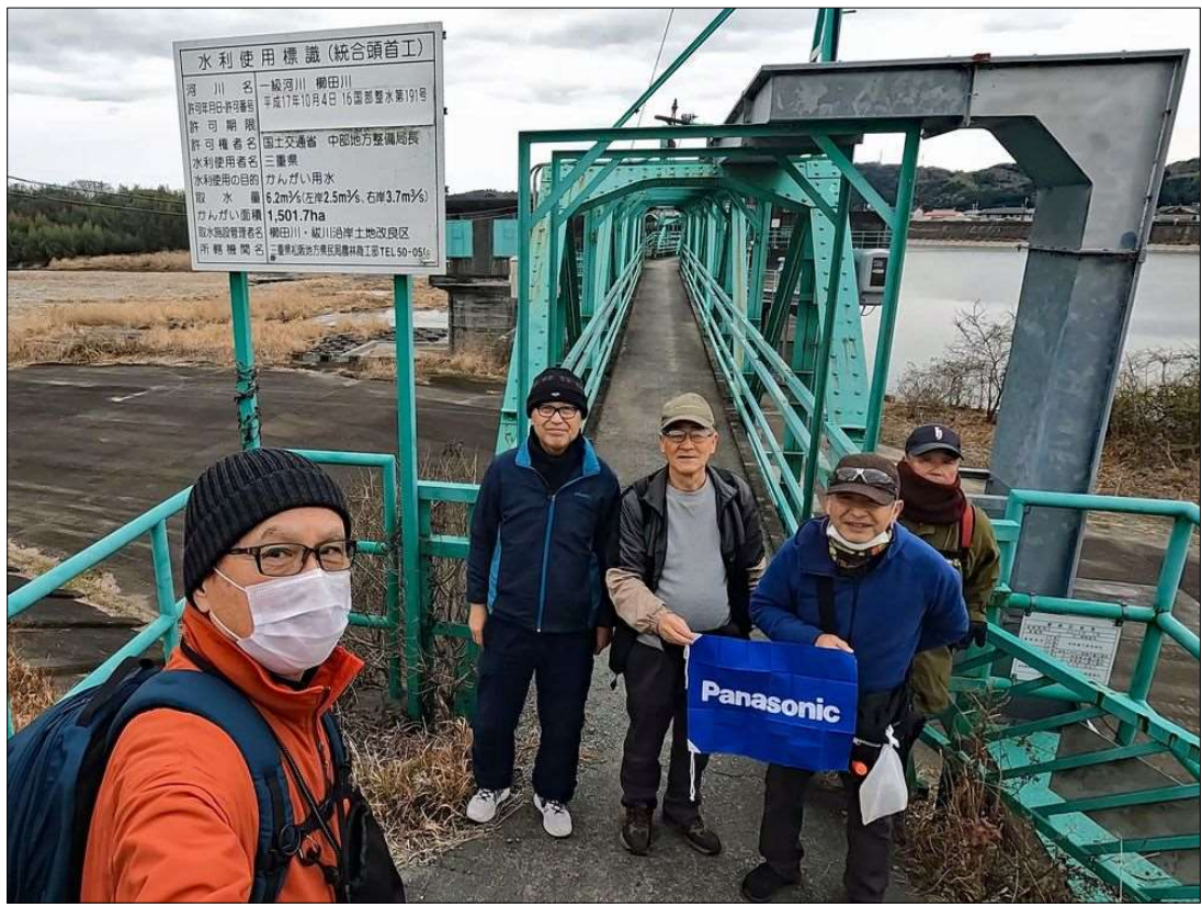
1 櫛田川に架かる可動堰を背景にして