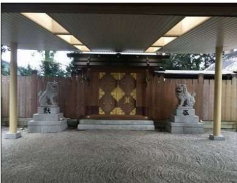
36 相鹿上神社の正面