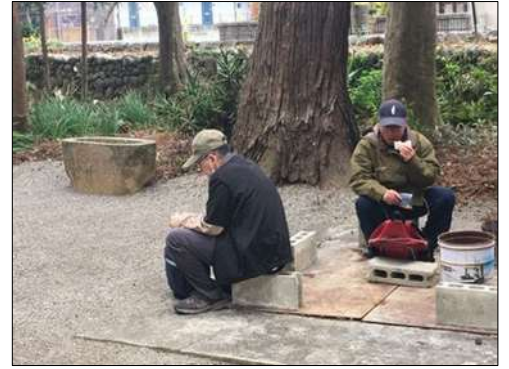
32 神社の境内で昼食