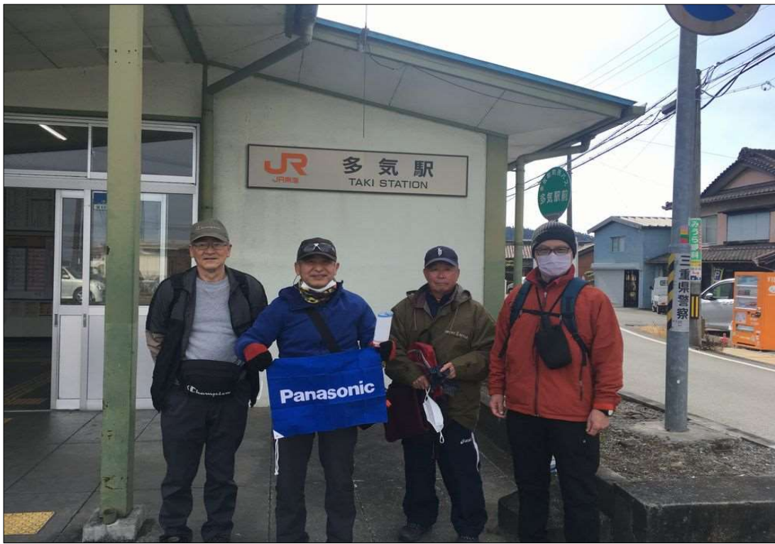
24 JR多気駅、5名で元気にスタート