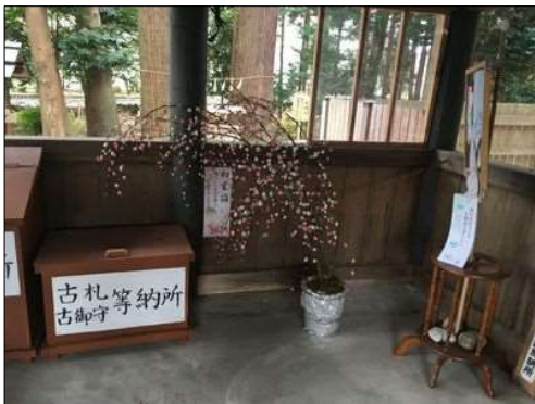
35 紅白の餅で作った梅?