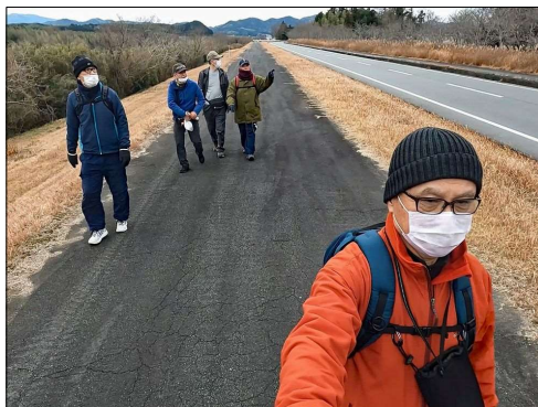
02 櫛田川の堤防を歩く