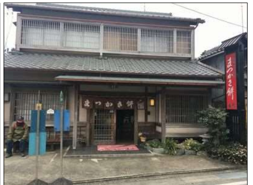
37 まつさか餅の老舗