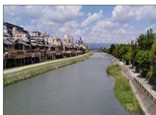
64 鴨川に栈敷が並んでいる