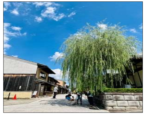
79 しだれ柳が揺れていました