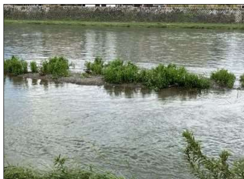
45 鴨川に鴨が数羽いた