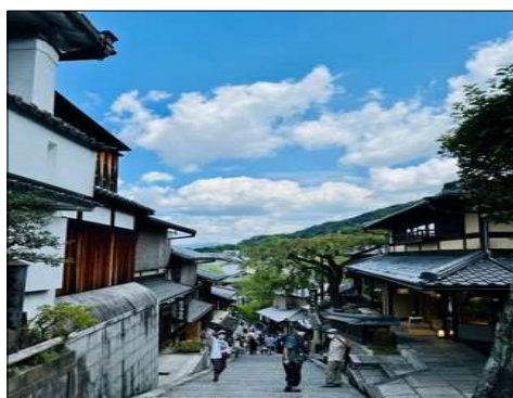
61 比較的空いていた