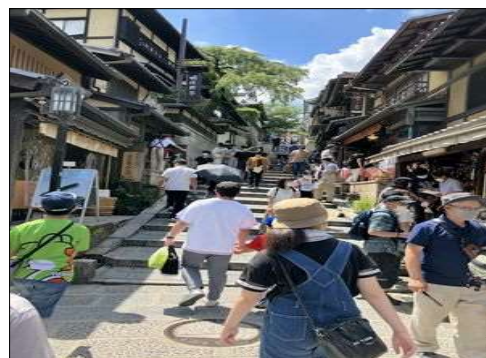
47 比較的空いている小径