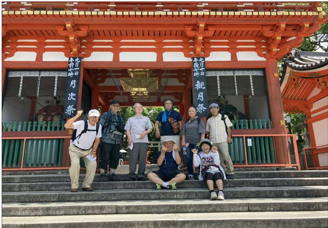
51 八坂神社の山門前で全体写真