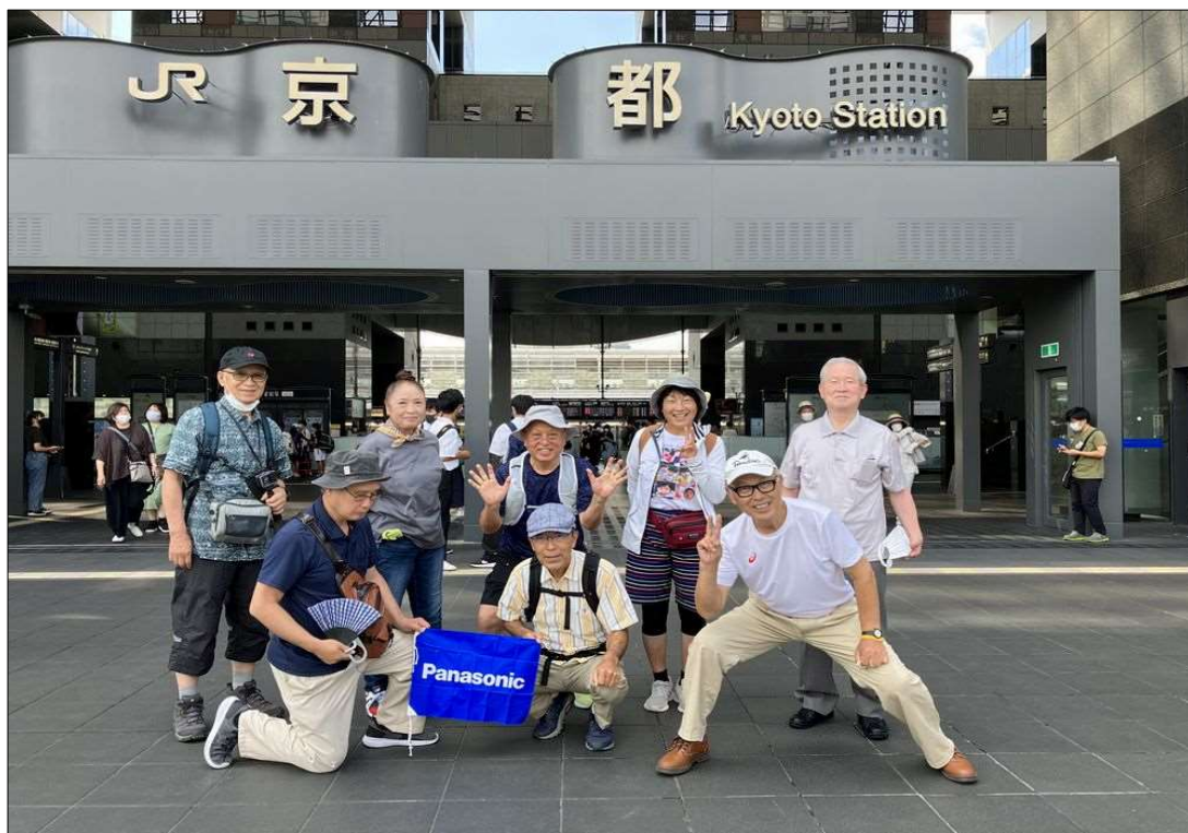
44 JR京都駅、8名で元気にスタート