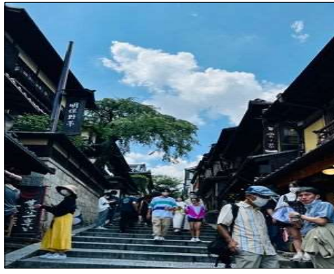
78 東山を楽しみました