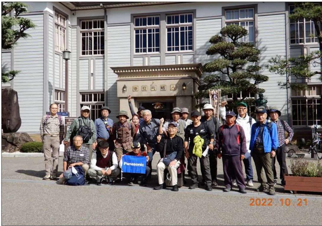
94 郡上八幡旧庁舎記念館前で