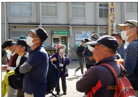
97 観光ガイドさんの話を聞く