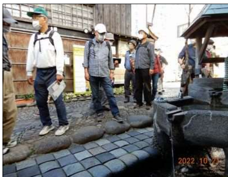
12 亀の形をした水路