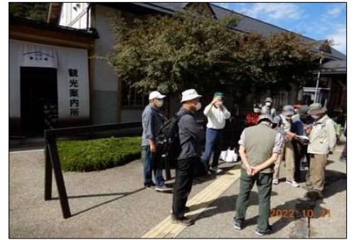
84 朝のミーティング