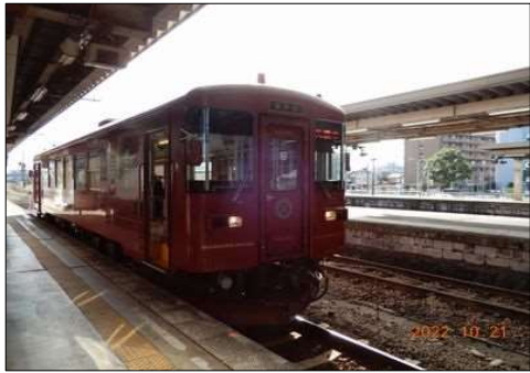
74 乗車した長良川鉄道 清流列車