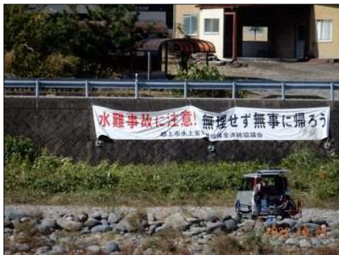
88 安全対策の垂れ幕