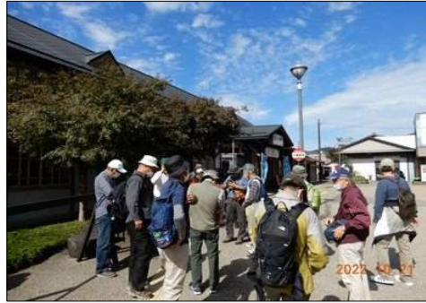
82 参加者に記念品の蛍光板を配布