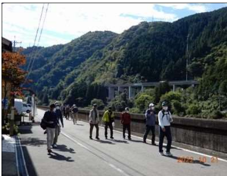
87 長良川沿いを歩く