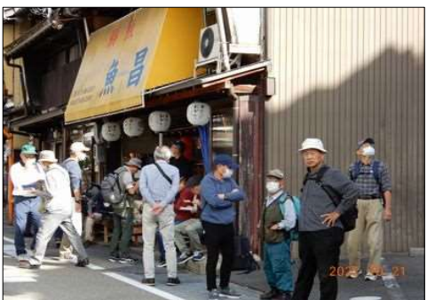
02 鮎の串差し塩焼きをゲット