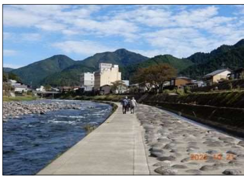
90 綺麗な吉田川の堤を歩く