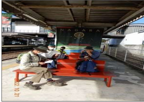
75 美濃太田駅で待つ