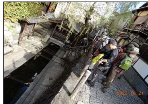
09 宗祇水の源泉を見る