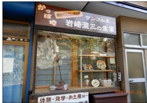
00 本物そっくりの食品サンプルメーカー