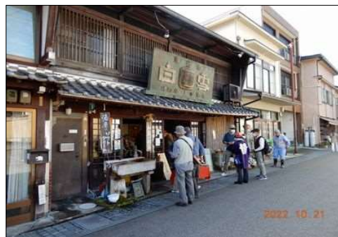
07 造り酒屋で地酒を飲む