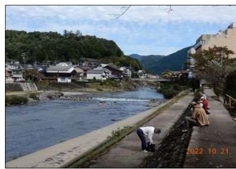
99 川面を見ながら屋食を頂く