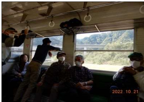
80 窓から身を乗り出して見る