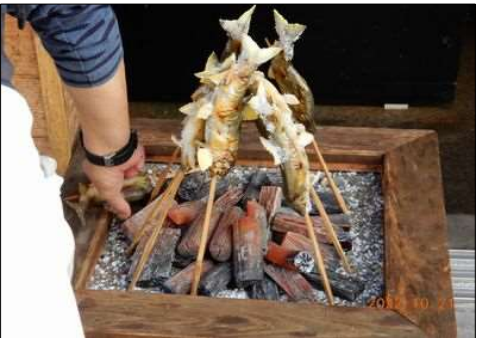
03 炭火で鮎の塩焼き