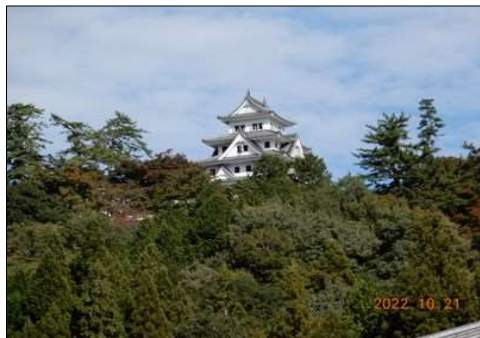
06 旧市街から郡上八幡城を望む