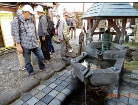
13 郡上八幡の豊富な水