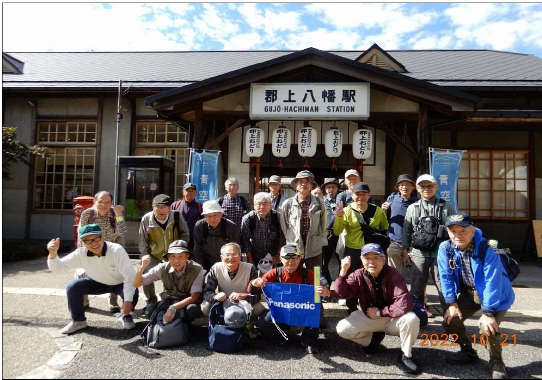
85 郡上八幡駅、20名で元気にスタート