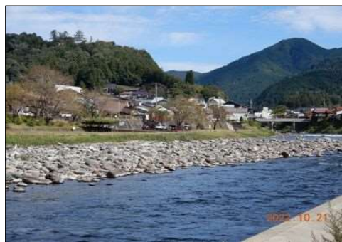
89 遠く山頂に勇壮な郡上八幡城