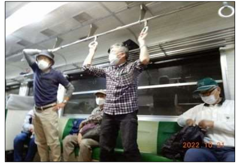
76 列車から綺麗な長良川を見る