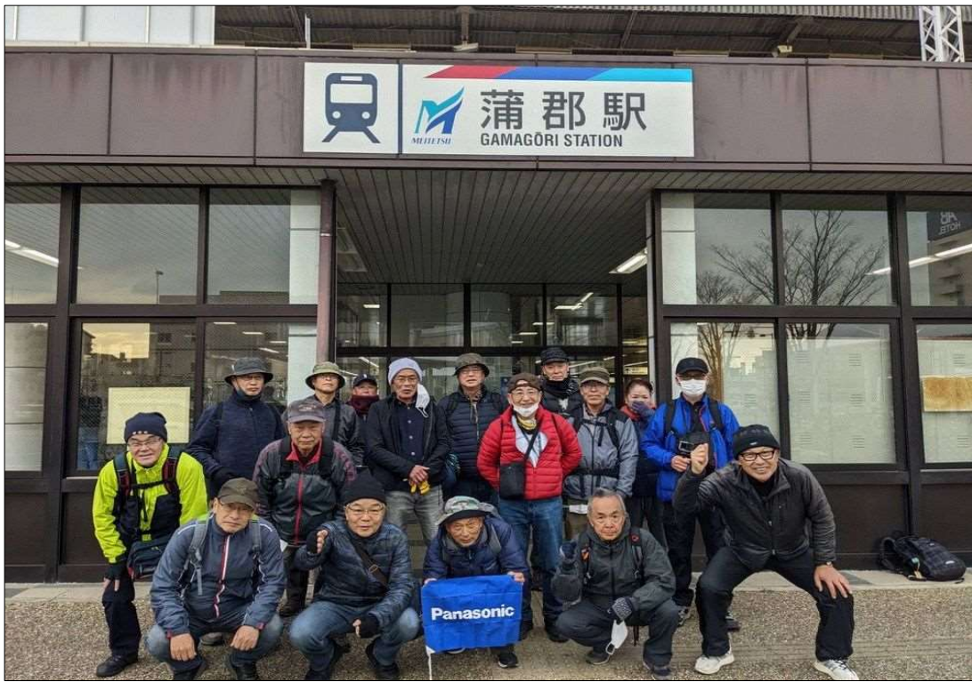
84 無事に蒲郡駅に到着