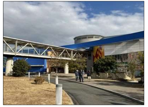
59 ラグーナフェスティバルマーケット