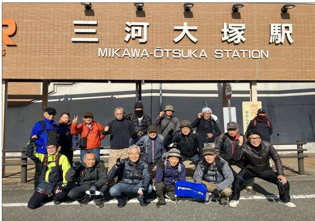
34 JR三河大塚駅、18名で元気にスタート