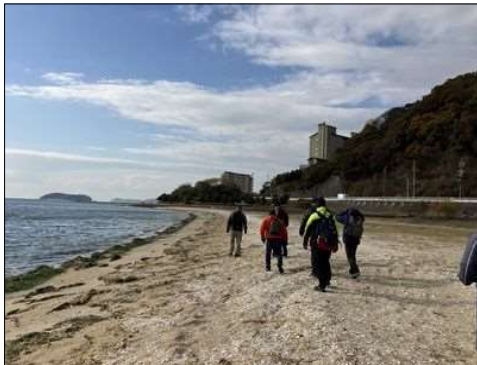
72 磯の香を感じながら砂浜を歩く