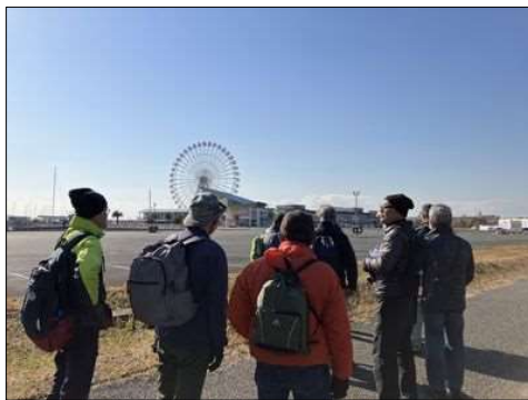
40 ラグーナの観覧車が見える