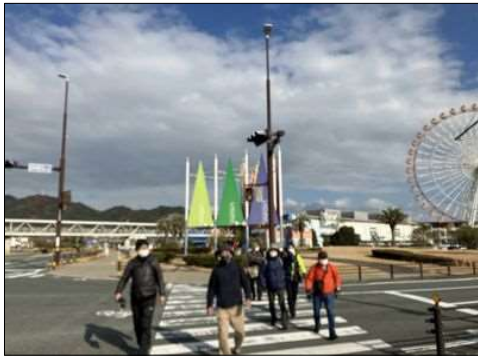
61 ラグーナ前の横断歩道