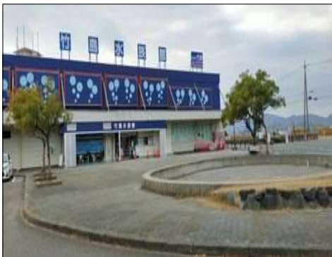
86 竹島水族館前を通過