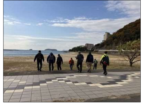
71 砂浜のある海岸に到着