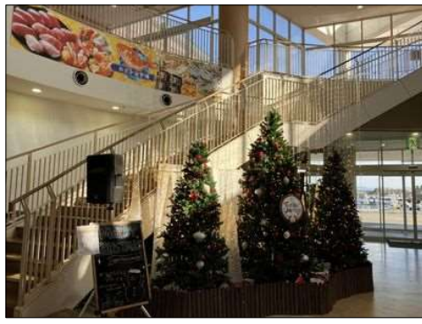
54 クリスマスツリーが出迎え