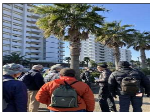
37 リゾートマンションが林立