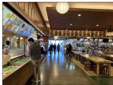
44 ラグーナフェスティバルマーケット