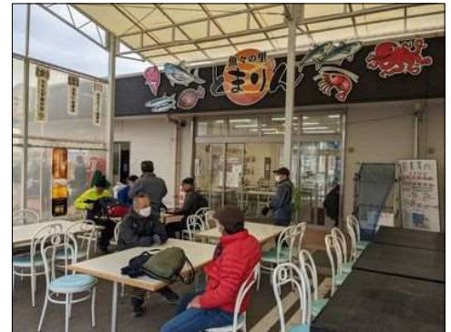
85 竹島ファンタジー館で休憩