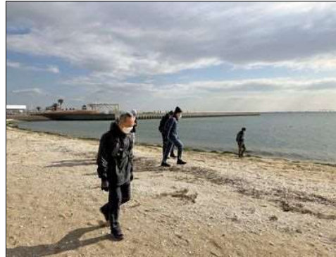
74 白い貝殻を踏みしめて