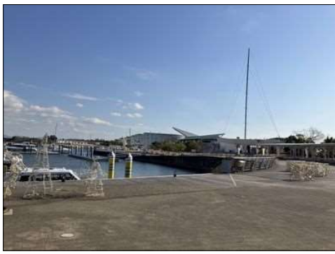
53 海岸には船が横付け