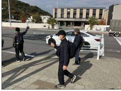
64 『変なホテル』前を通過