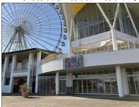
51 ラグーナフェスティバルマーケット