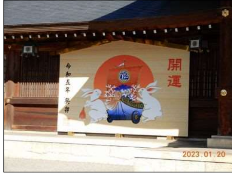
17 砥鹿神社の大きな絵馬