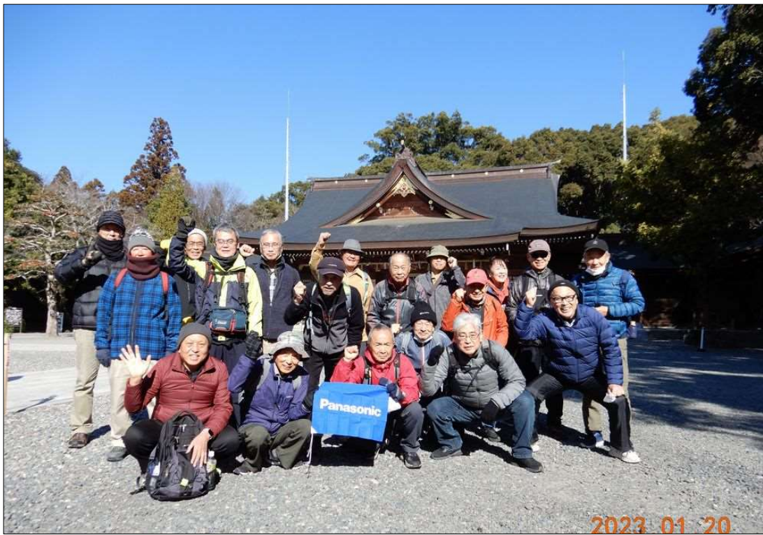
19 JR三河一宮駅近くの砥鹿神社を、19名で元気にスタート