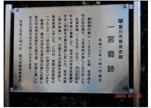
20 徳川家康公の一宮砦跡