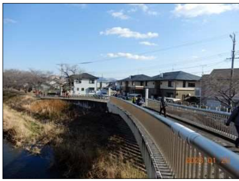
27 佐奈川に架かる立派な橋