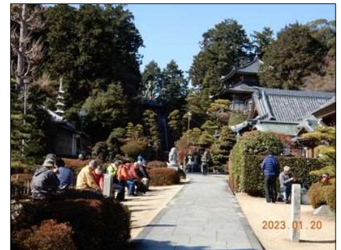
23 とても綺麗な境内でした