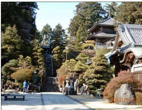
24 歴史を感じる建物多数