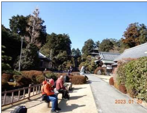
21 「みちびき不動尊」で昼食