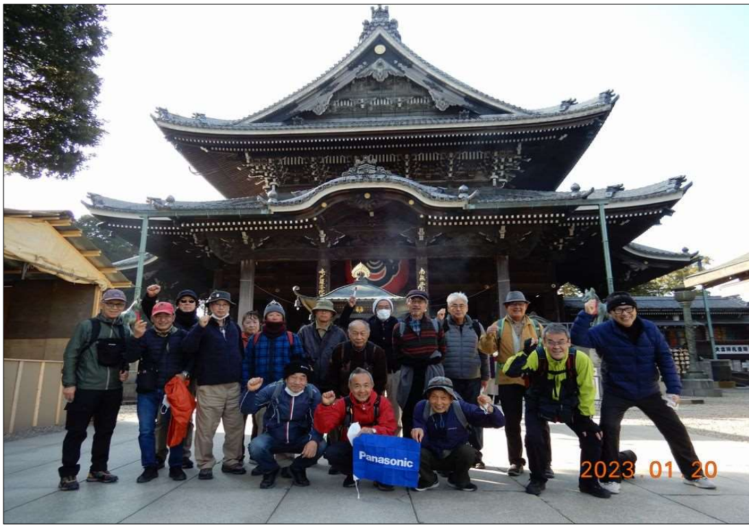
34 豊川稲荷の本堂前にて