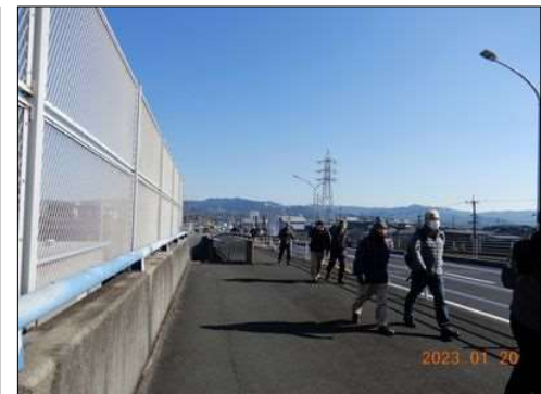
26 元気にウォーキング♥