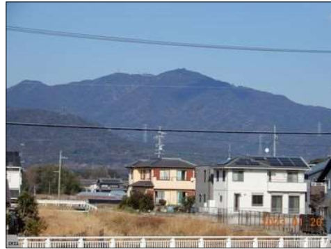
32 砥鹿神社の奥宮の本宮山