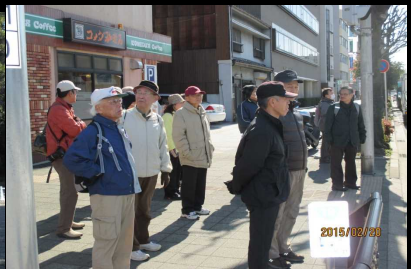
1759 信号待。交通ルール順守