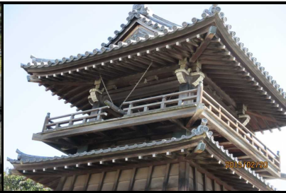
1825 宮の渡しの見張り台