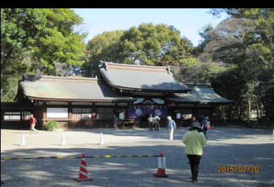
1758 広い境内の高座結御子神社