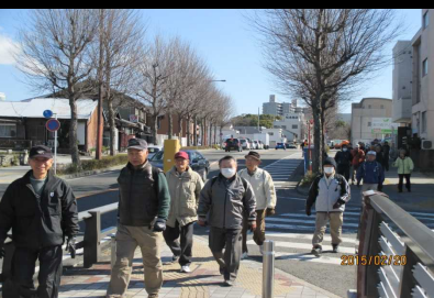
1762 健脚の先頭グループ