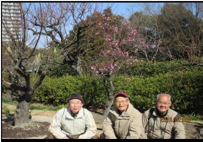
1793 皆さん しゃがんでハイ!