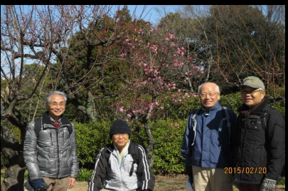
1792 皆さん 笑顔で