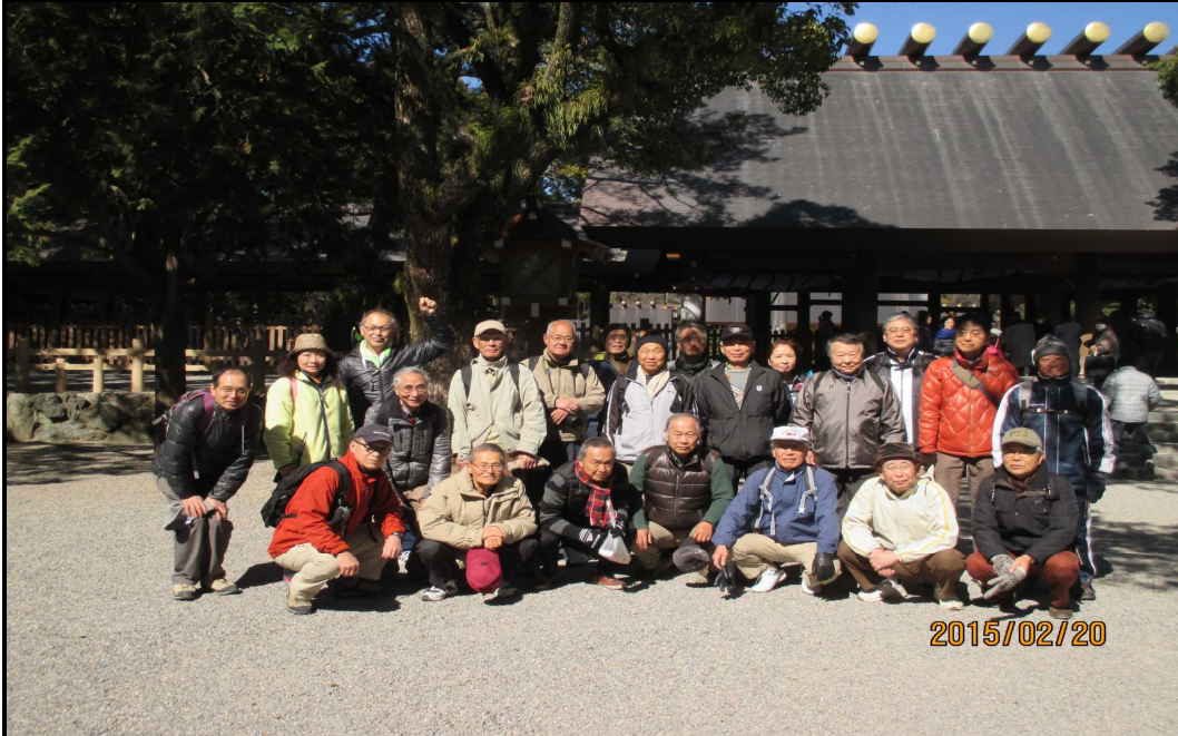
1866 全員無事、熱田神宮正殿前でゴールの記念撮影