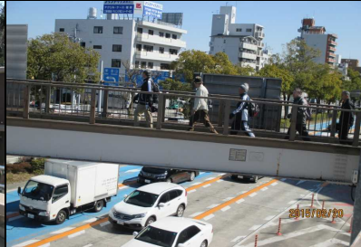
1843 足取り軽い皆さん