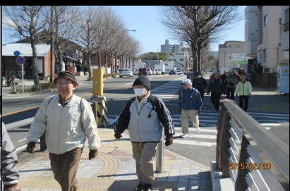
1763 若若しい山端さん