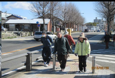
1765 角屋さんと安藤夫妻