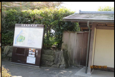
1777 白鳥公園正門にて