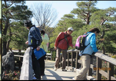
1800 橋上から鯉の餌やる