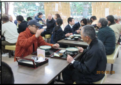
1864 食後の談笑を楽しむ