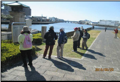
1819 遠くは名古屋港へ