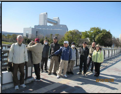
1769 名古屋国際会議場近く