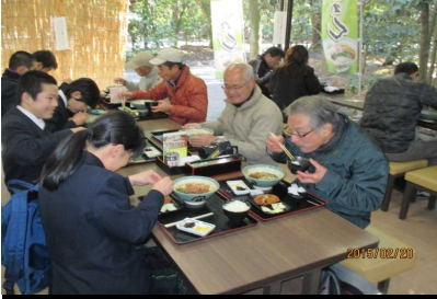
1857 高校生とご一緒に