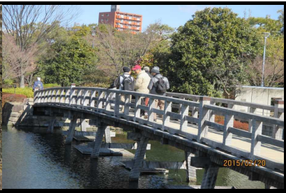
1797 公園内の木橋を渡って