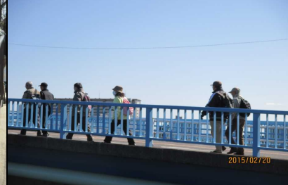
1807 元気に歩く皆さん