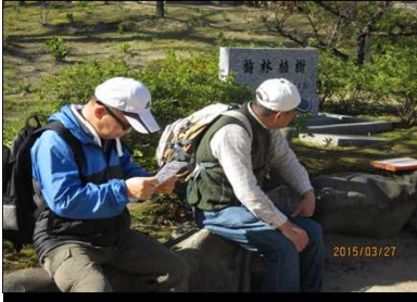
2059 もう少しでゴール