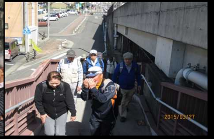
2051 顔を隠しても判るよ