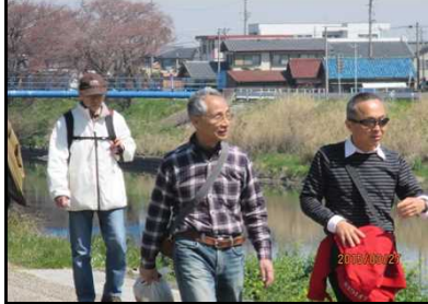
1975 上着を脱いで歩く