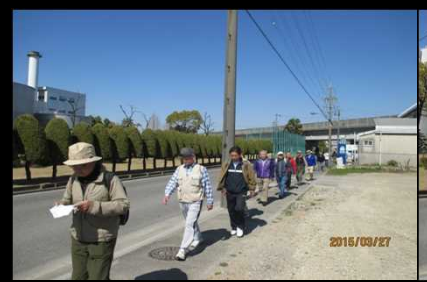
2036 さあ後半戦スタート