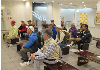
1984 お姉さんに聞き入る