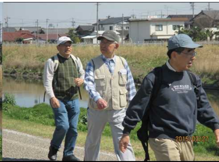
1973 長閑な堤防を楽しむ