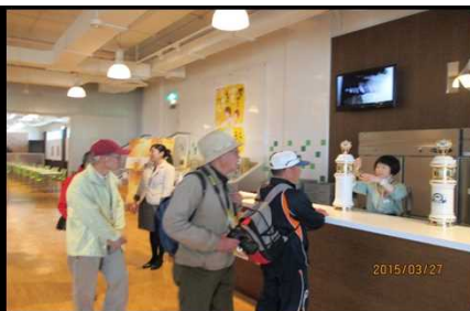
2003 待望の試飲会突入