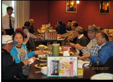
2028 工場内レストランで