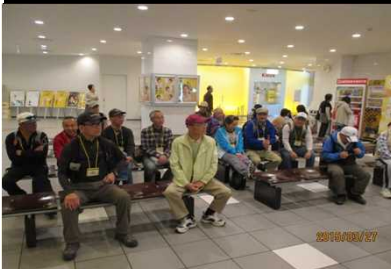
1980 キリンビール工場にて