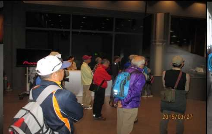
1995 早くビール飲みたい！