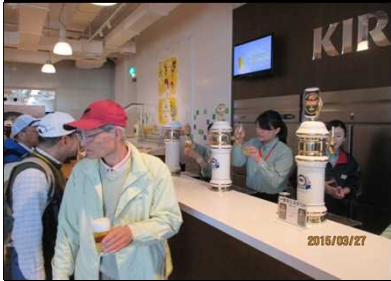
2010 趣あるビールサーバー