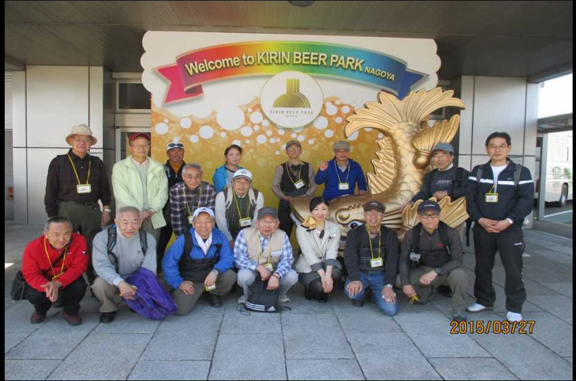
1979 金の鯨の前で記念撮影