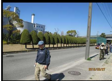
2035 麒麟ビール工場を出て