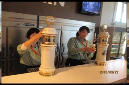
2019 麒麟ビールのお姉さん