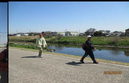
1971 五条川堤防を歩く