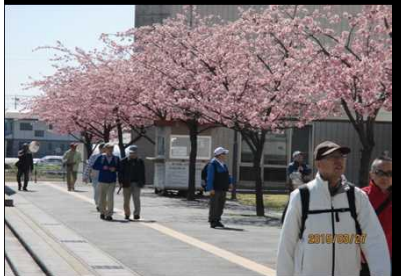
1968 綺麗な桜を見入る