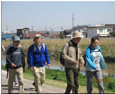
1972 談笑しながら歩く