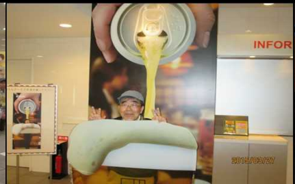
1981 御茶目な太田さん