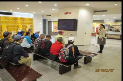
1982 プレゼンテーション