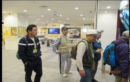
1987 ズボンに手を入れるな！