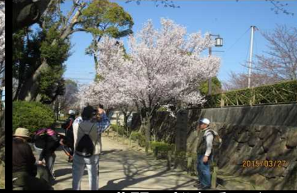
2055 満開の桜を愛でる