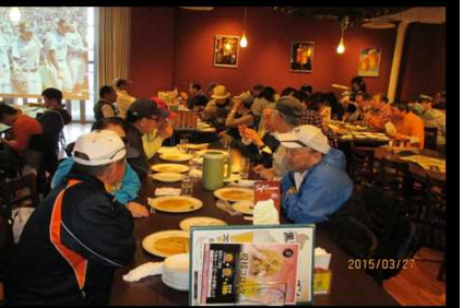
2033 食後の歓談を楽しむ