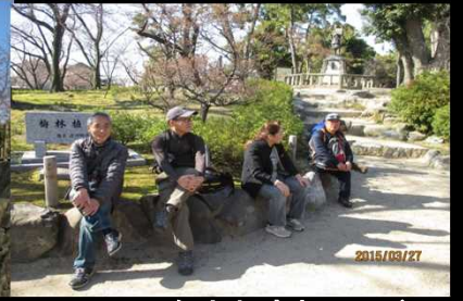
2057 多少お疲れモード