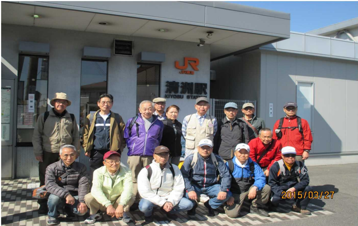
1956 とても心地いい季節の中、元気な17人でスタート

ウォーキングのマナー、交通ルールを守りましょう! ●道いっばいに広がって歩かないでください。 ●コース以外の山や畑(私有地)に入らないでください。 ●草花や木の葉をとらないでください。 ●日傘等の使用は周りのお客様にご注意ください。