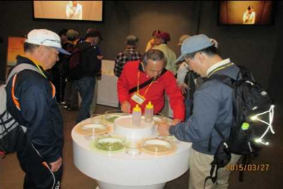
1991 原料の大麦を食す