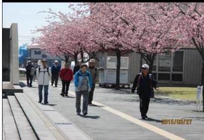
1965 満開の桜を楽しむ