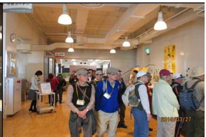
2007 まずは一番搾りから