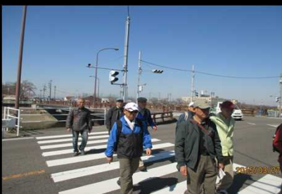
1970 交通ルールを守る