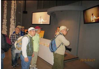
1993 説明を熱心に聴く