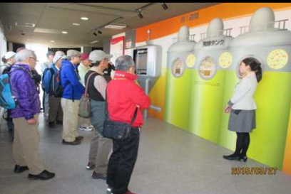
1998 発酵工程の話聞く