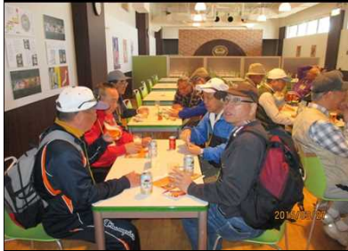
2023 ザックを背負って飲む