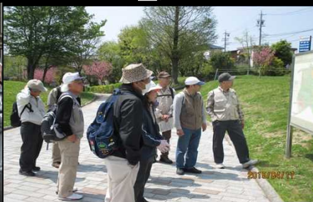
2078 広大な敷地の健康の森公園