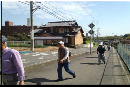
031 縦長になったご一行様