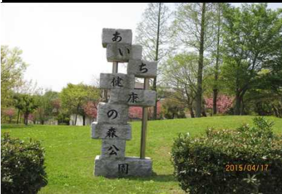
2080 特徴ある石の立看板