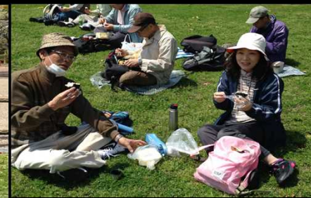
005 愛妻おにぎりの安藤夫妻