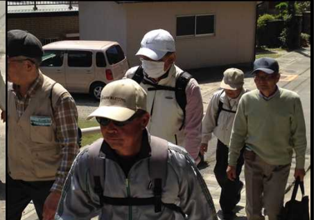
014 下を向いてもくもくと歩く