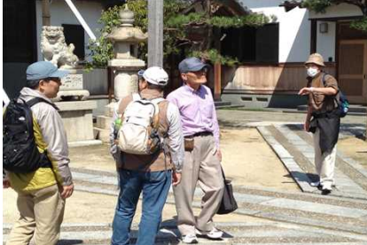
020 清掃が行き届いた普門寺