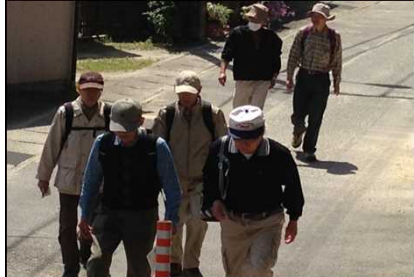
015 温かくなり上着を脱ぐ