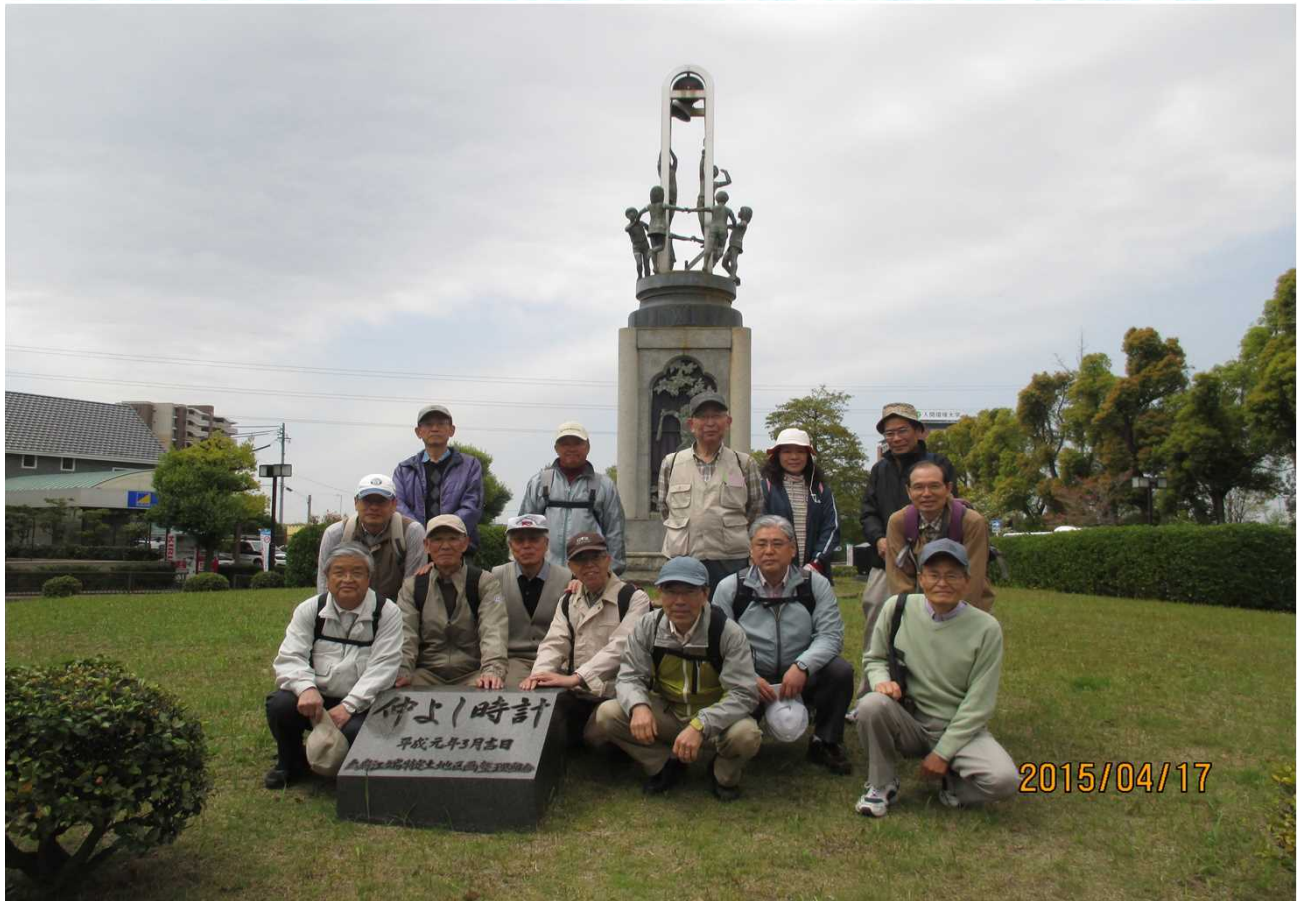
2070 雨上がりのさわやかな気候の中、15人でスタート