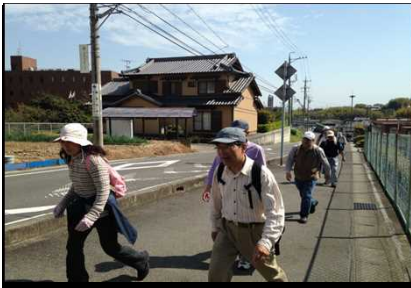
030 後半の難所の‘上り道’