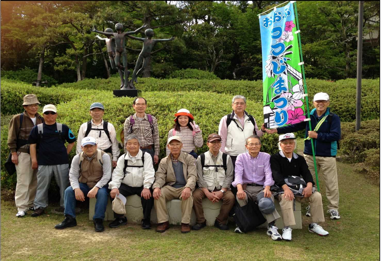
035 無事ゴール近くの大倉公園に到着！