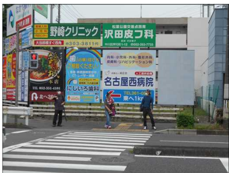
1499 信号待ちもソーシャルデスタンス