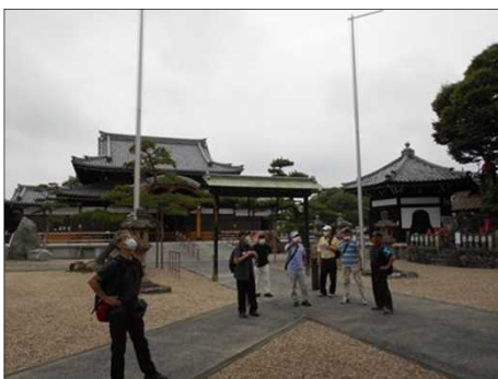
1495 清掃が行き届いた境内