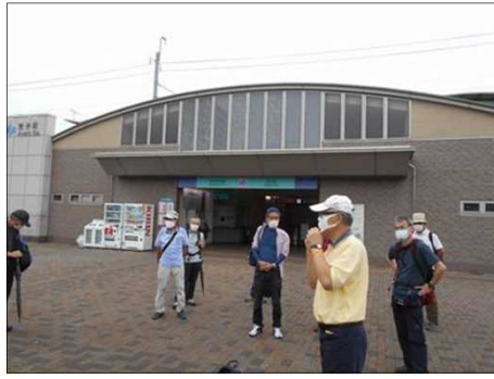
1475 ソーシャルデスタンスで