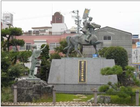
1473 荒子駅前の利家とまつの像