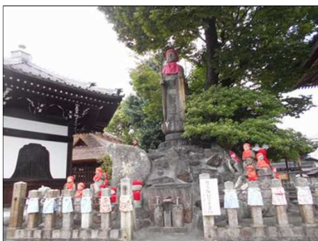
1494 荒子観音の仏像群