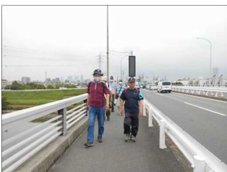
1503 いざ 春田駅に向かう