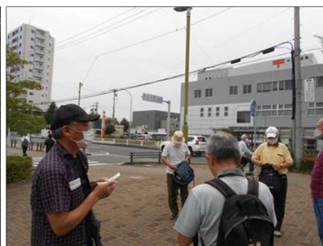
1487 出発前の打合せ風景