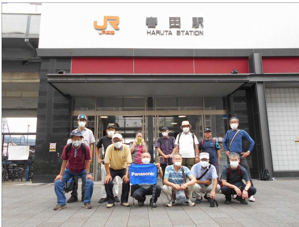
1504 無事元気にゴール！お疲れ様でした(JR 春田駅にて)