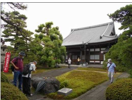
1501 10種の苔が見られる