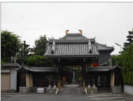
1498 金ぴかの「しゃちほこ」