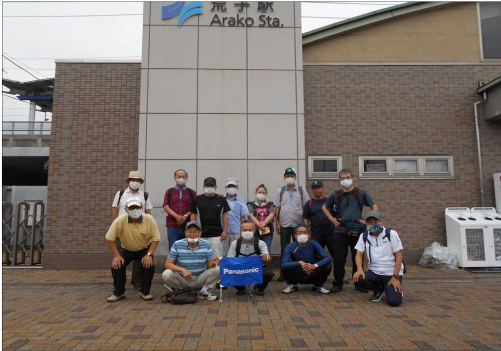
1484 荒子駅から14名が出発