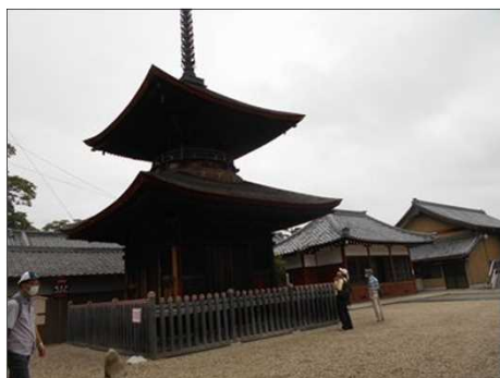
1493 重要文化財の5百年前の多宝塔