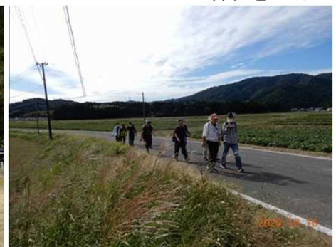
2837 東海自然歩道を歩く