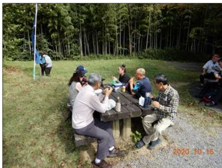
2820 四方山話で会話を楽しむ