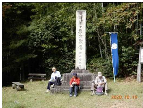
2821 見晴らしのいい昼食会