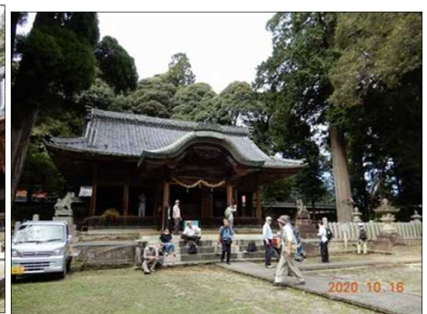
2834 地元の人々が神社を大切に