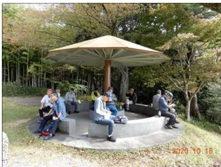
2819 山頂のベンチで昼食