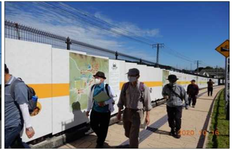
2809 駅前のメインストリート