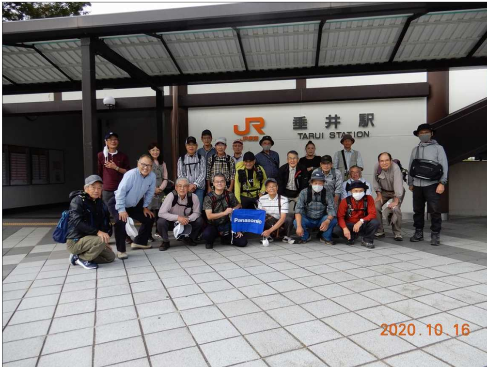
2846 全員無事元気にゴール！お疲れ様でした(JR垂井駅)