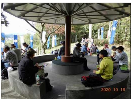
2825 景色を見ての昼食