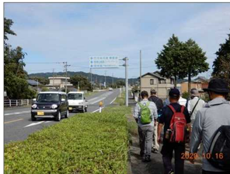
2838 久しぶりに大きな道路に出る