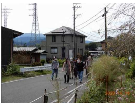
2831 ここでも道路を占拠