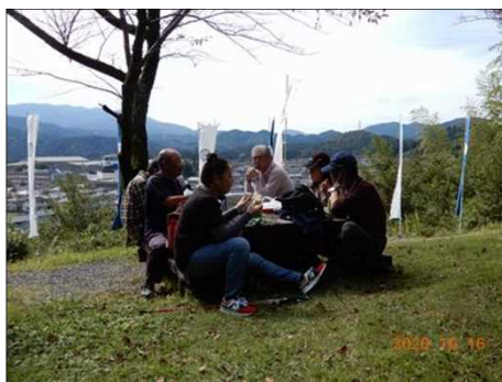
2824 眼下は関ヶ原を一望