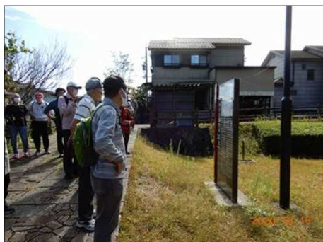
2813 細川忠興陣址看板