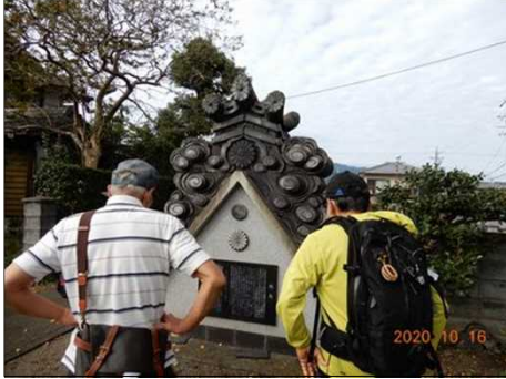
2844 大きな鬼瓦が残されていた