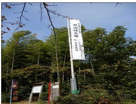
2822 岡山烽火場の大きい旗