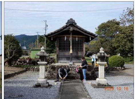
2840 五明稲荷神社に到着