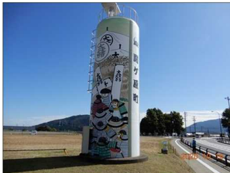
2811 大きな関ヶ原のモニュメント