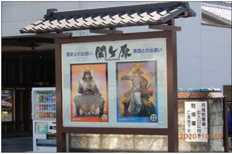
2803 関ヶ原駅の合戦説明