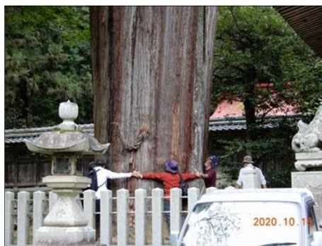
2835 杉の大木を皆で囲む