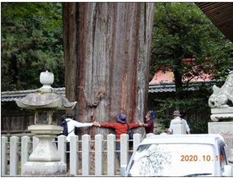
2835 杉の大木を皆で囲む