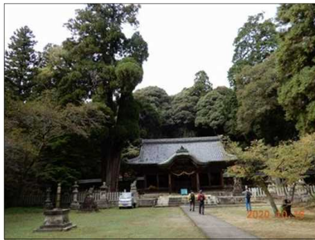
2832 伊富岐神社に到着