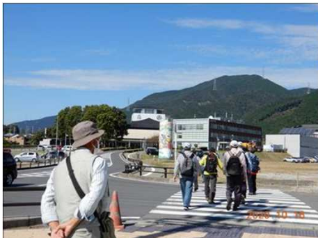
2810 すっかり綺麗になった市役所前