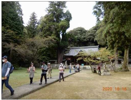
2836 いよいよ後半戦の始まり