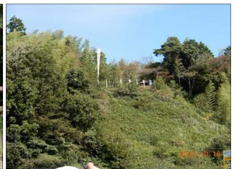
2815 岡山烽火場を下から見る