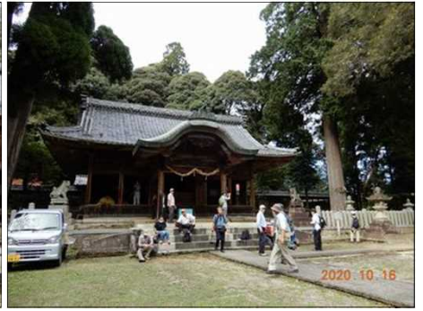
2834 地元の人々が神社を大切に