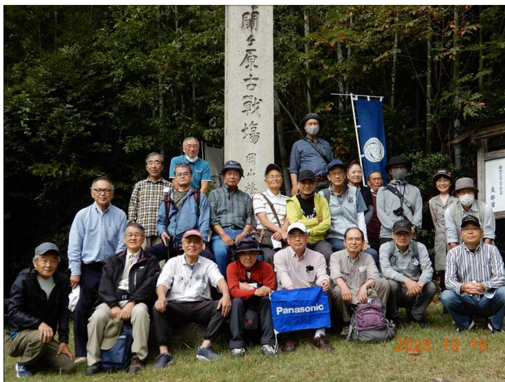
2829 関ヶ原古戦場(岡山烽火場)にて