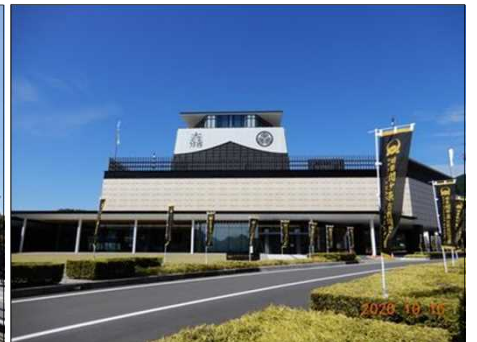
2812 開館迫る関ヶ原古戦場記念館