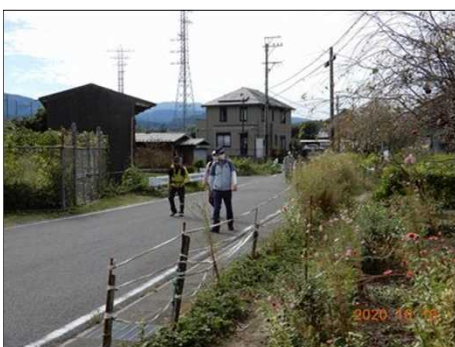
2830 沿道にはコスモスが満開