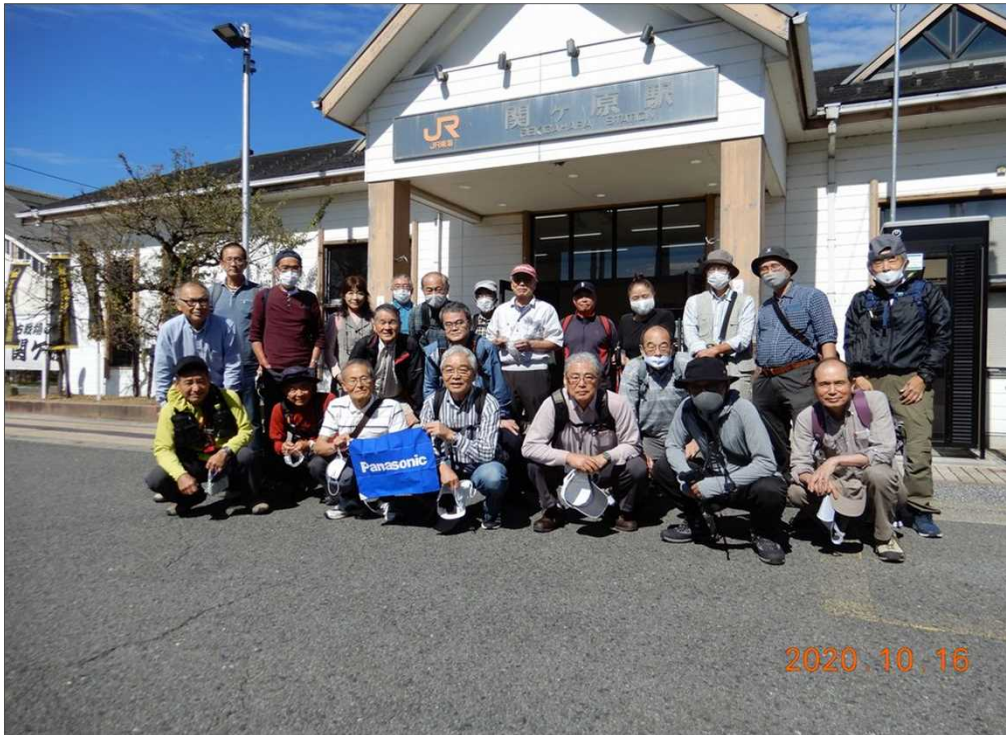
2808 JR関ヶ原駅を23名で元気にスタート