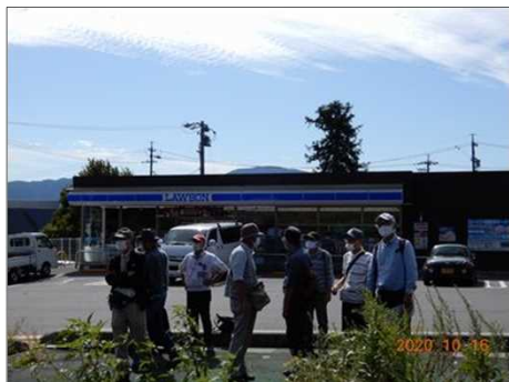
2818 コース唯一のコンビニ