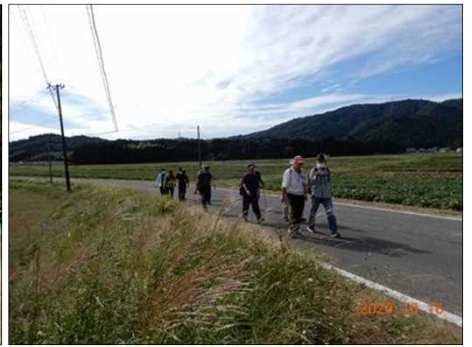
2837 東海自然歩道を歩く