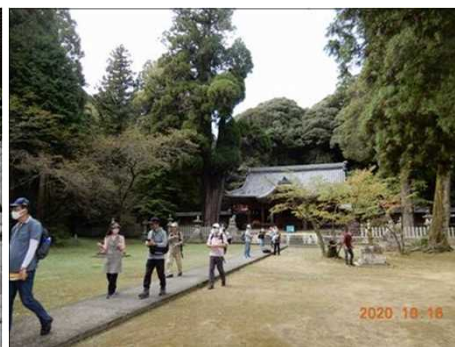
2836 いよいよ後半戦の始まり