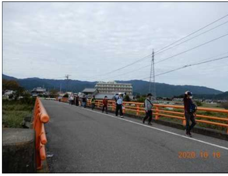
2842 一列になって歩く