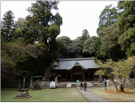
2832 伊富岐神社に到着