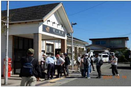
2805 関ヶ原駅前を占拠！