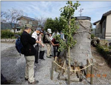
2841 大木の下部部分が残されていた