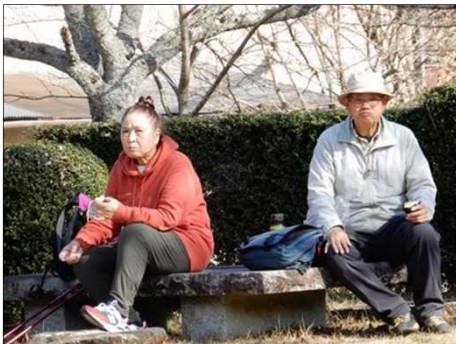
2986 お弁当で腹ごしらえ