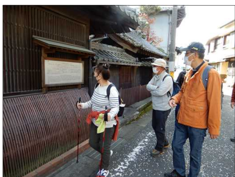
3006 皇女 和宮の逸話