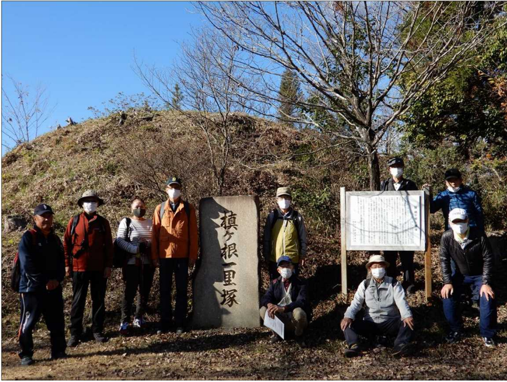
3003 榎ヶ根一里塚にて全員写真