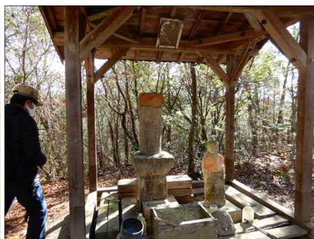
2998 首無し地蔵の首は何処へ