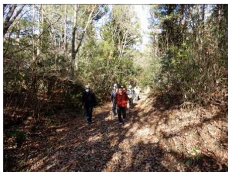
2996 中山道の山道を歩く