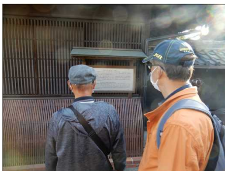
3005 中山道の住民の思いを記載