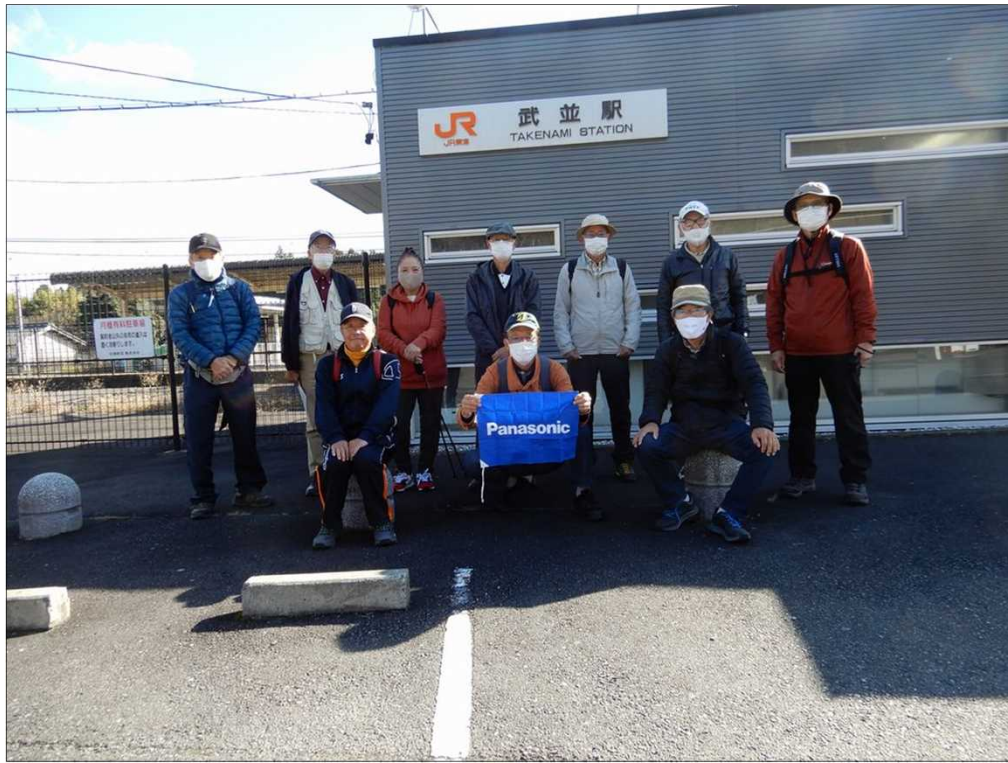
2982 武並駅を、10名で元気にスタート