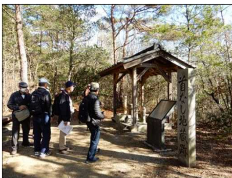
2997 首無し地蔵前にて