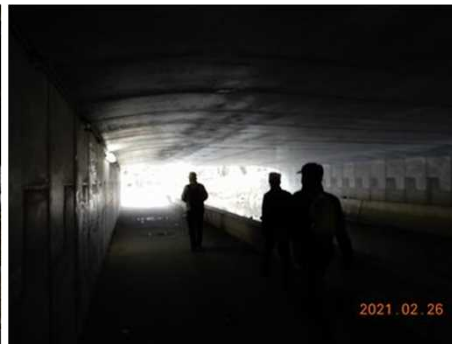
3157 道路の下の通路を歩く