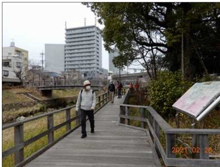
3156 岐阜駅に直結した公園