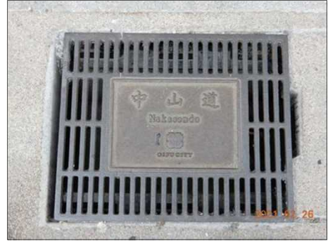
3164 排水溝の中山道名入り蓋