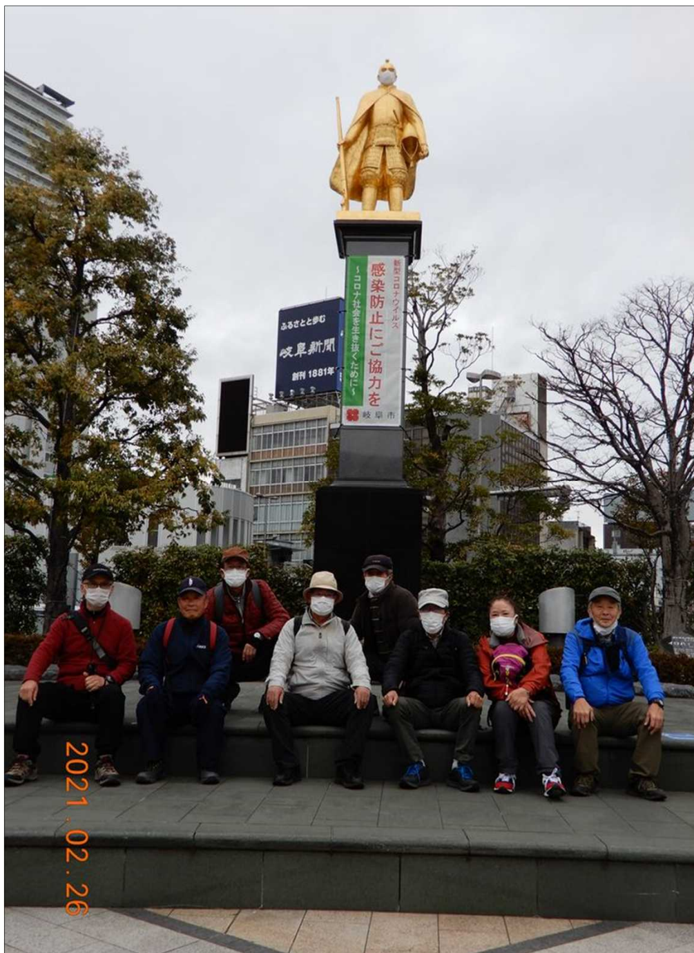
3169 無事元気にゴール！お疲れ様でした（織田信長像前）