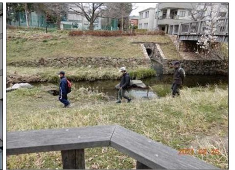
3155 清水緑地の遊歩道に行く