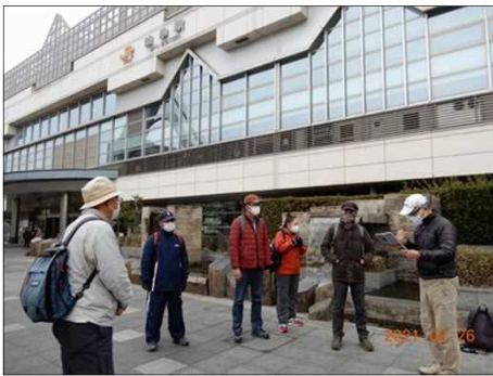
3151 本日の見どころを紹介