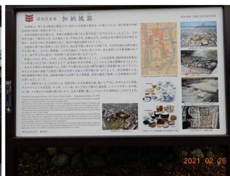
3160 加納城跡の説明文