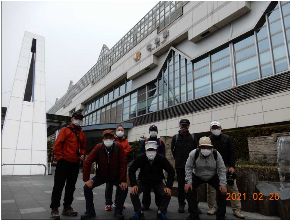
3154 JR岐阜駅到着、9名でスタート