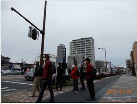
3165 ゴールの岐阜駅に到着