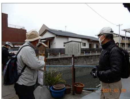
3159 中山道の高札場跡