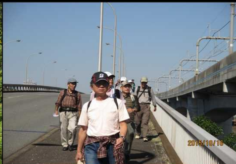
4031 いよいよ終盤です