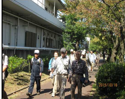
3993 団体さんのお通り！