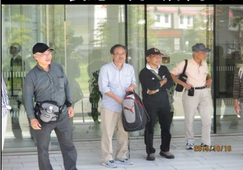
4040 ゴールでにこやか