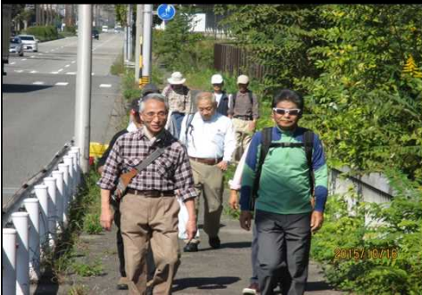
4030 サングラスがお似合い！