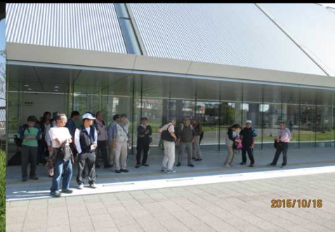
4037 リニア・鉄道館に到着