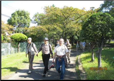
4000 また元気に歩き出す 4001 列が長くなっています～