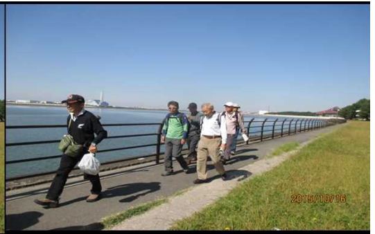
4023 ゴミはお持ち帰り