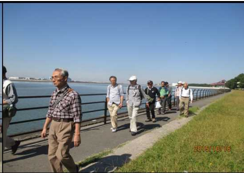
4022 さあ 歩くぞ！