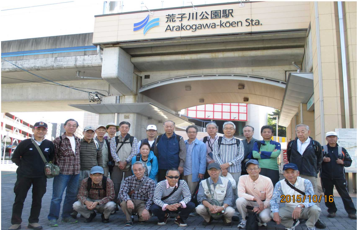
3978 あおなみ線 荒子川公園駅から 過去最高23名で元気にスタート