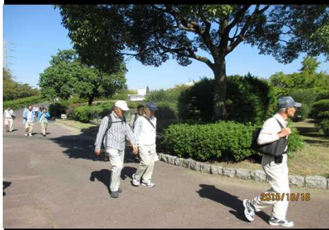
3986 いいウオーキング日和