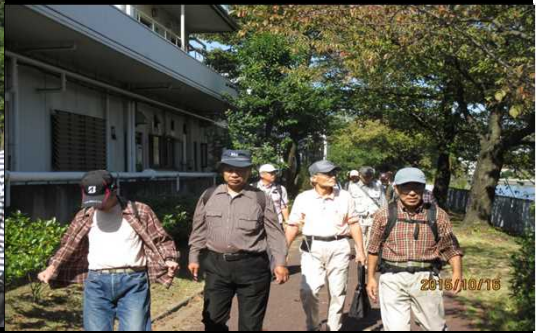
3992 川沿いの散歩道を歩く