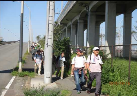
4033 長蛇の列と成りました