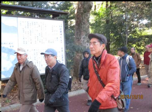
4940 元気よく歩き出す！