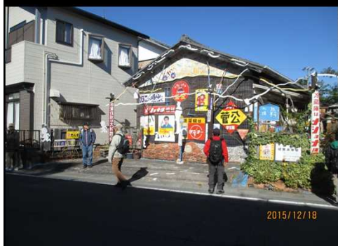
5005 壁一面に広告多種