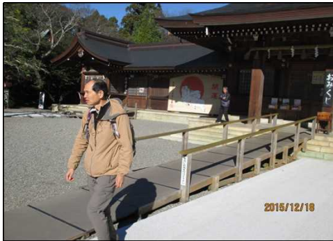
4945 ハンデキャップ用通路