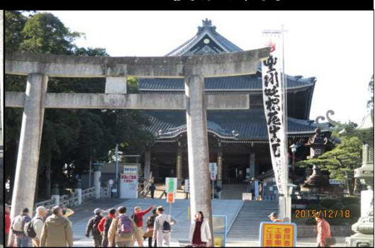
5027 豊川稲荷も正月準備