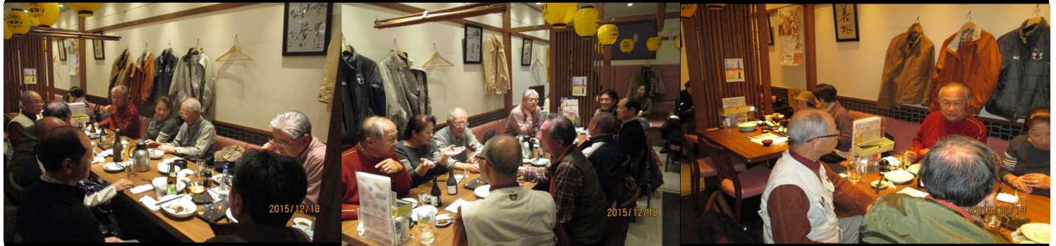
5038 賑やかに忘年会実施