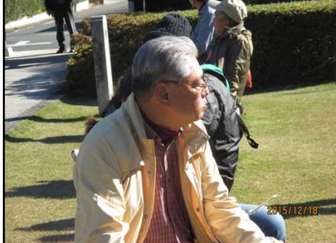
4983 おにぎりを頬張って