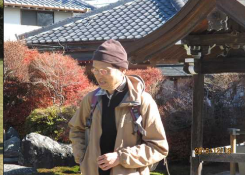
4984 日差しを受けて暖かい