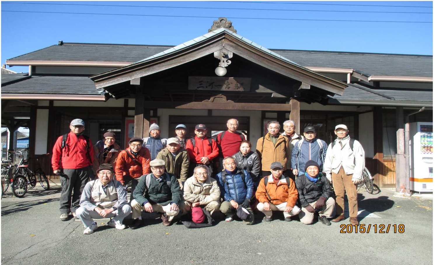
4936 飯田線 三河一宮駅を冬の澄み切った天候の下 20名でスタート