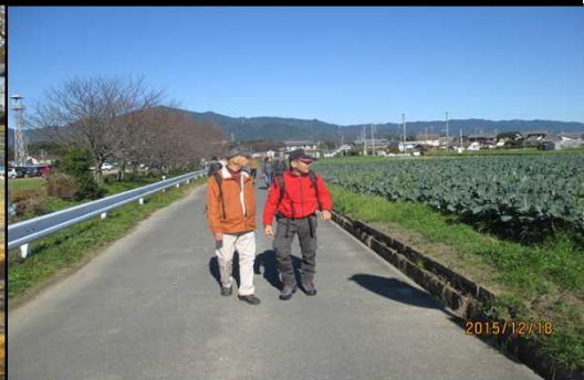
4976 晴天の下 畑作地帯に行く