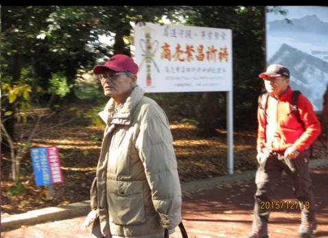
4943 整備された境内を歩く