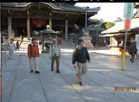
5033 建築中の社務所を見て