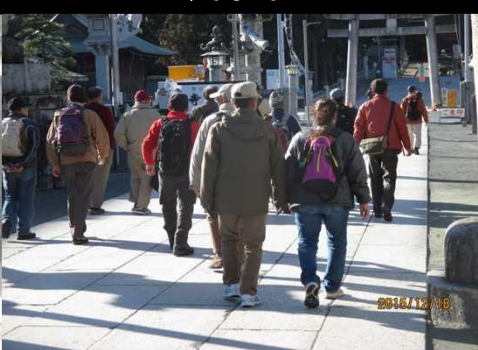
5024 参道を全員で歩く