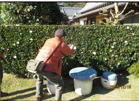
4996 綺麗な山茶花にパチリ