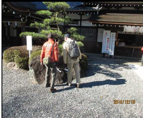
4955 どれどれ 何がある？