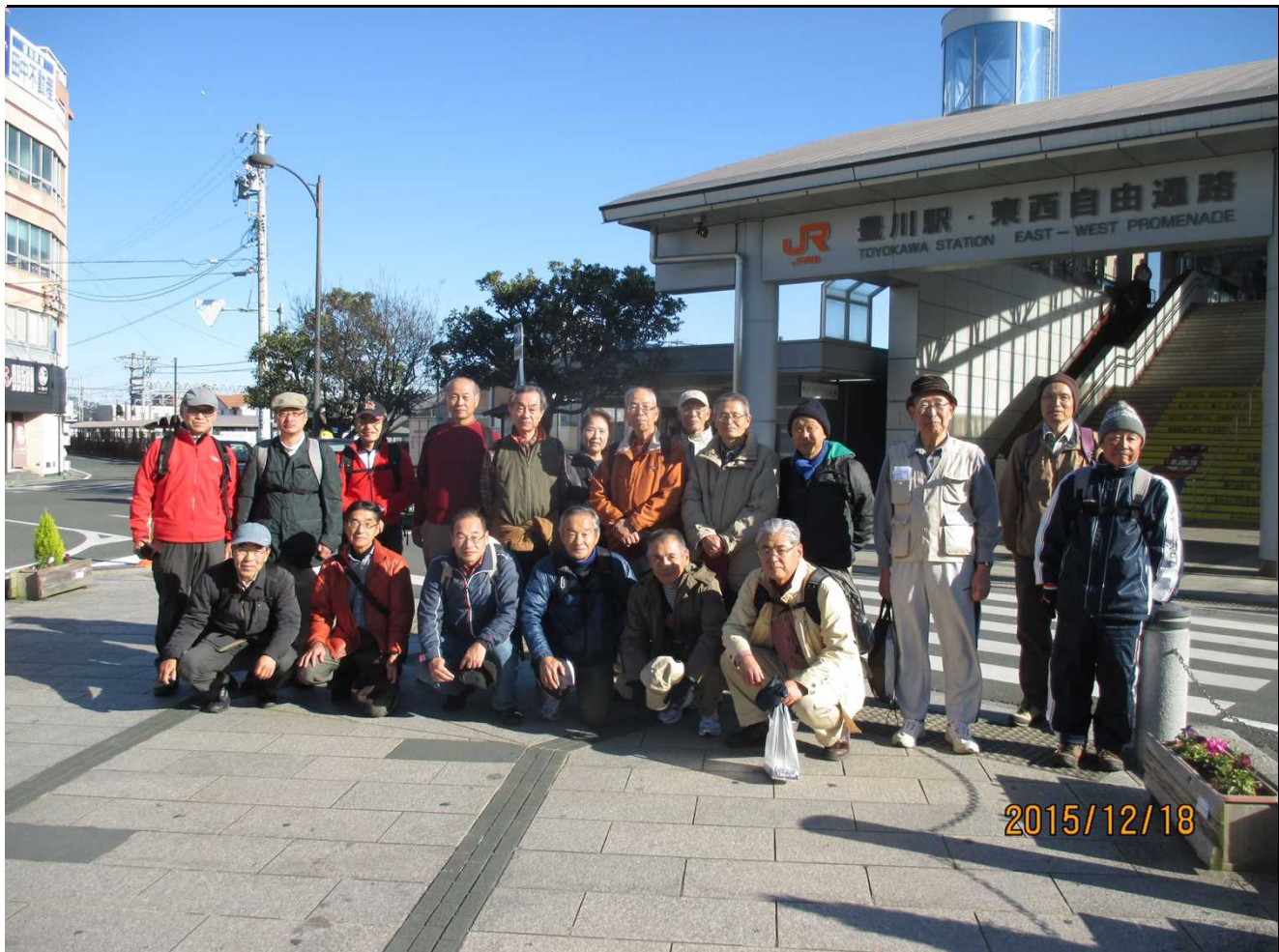
5037 無事全員元気にゴールしました！ お疲れ様でした。