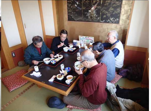
019 食事時は大人しい！