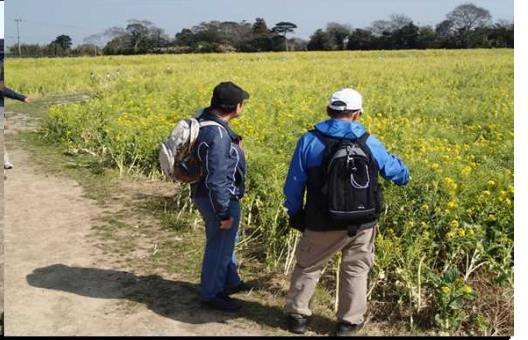
034 菜の花を前にして