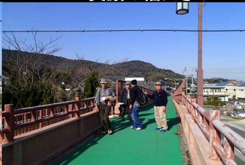
047 思い思いの帽子で