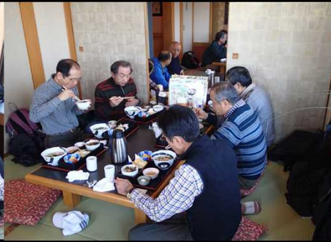
015 やっと来た！昼御飯