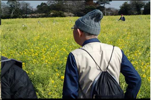
031 菜の花とおじさん！