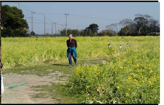
025 菜の花に包まれて