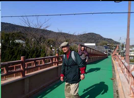
045 節制された角屋さん