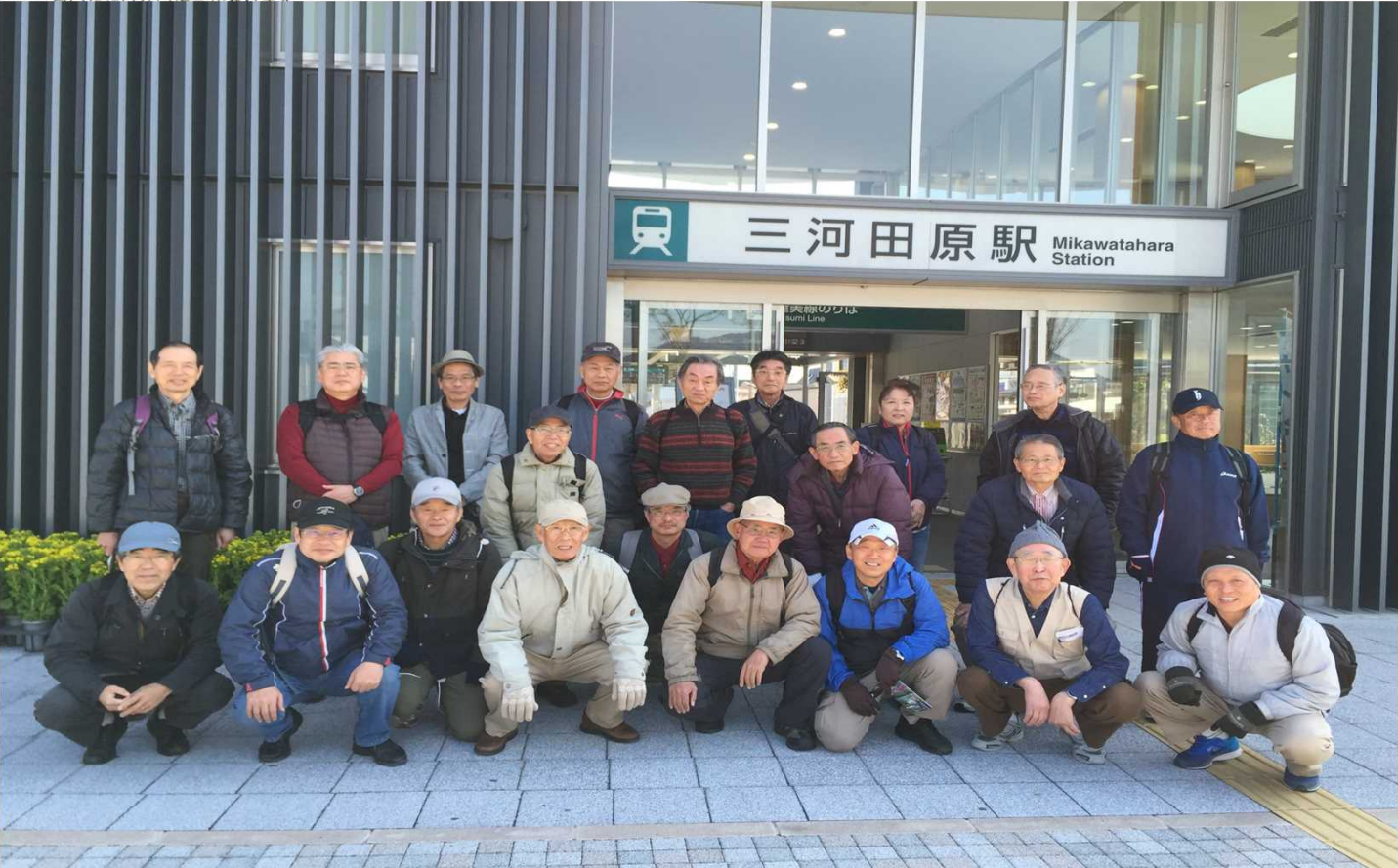
6373 豊橋鉄道 田原駅を温暖な気候の下 22名でスタート