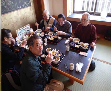
018 カメラ目線の角屋さん