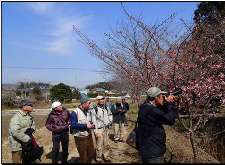
023 シャッターチャンスだ！