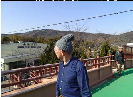
044 ニットの帽子がいい！