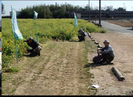
033 さすが、カメラ小僧！