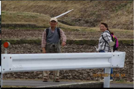
258 ここで待ってまーあす！