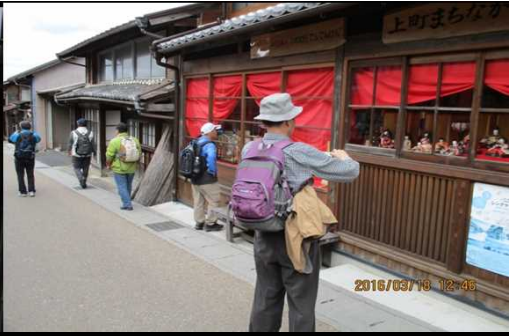
285 素晴らしい雛人形