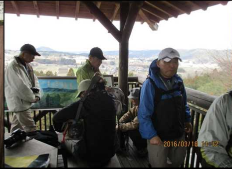
260 やれやれ展望台だ！