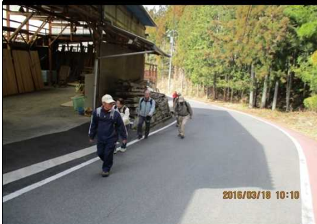
226 少し登り道で間隔が