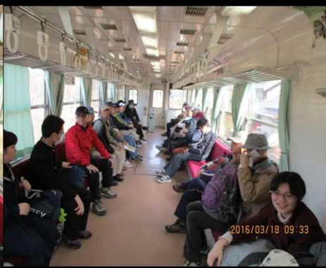
220 こじんまりした車両で