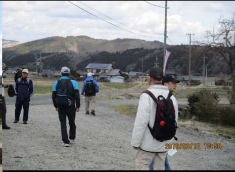
252 暫し 休憩