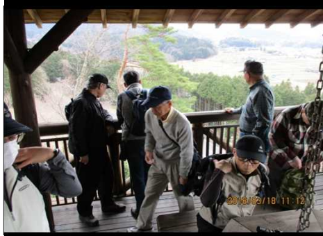
262 眼下は日本一の風景