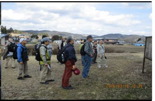
247 説明の看板を見る