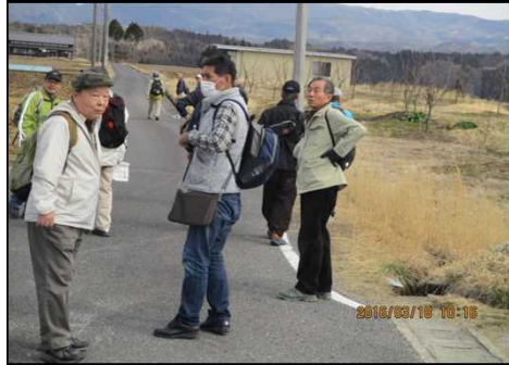
233 ロータリー式交差点で