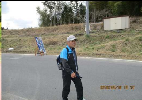
227 まずはスタイルから