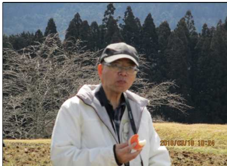
244 まずは食糧補給だ！