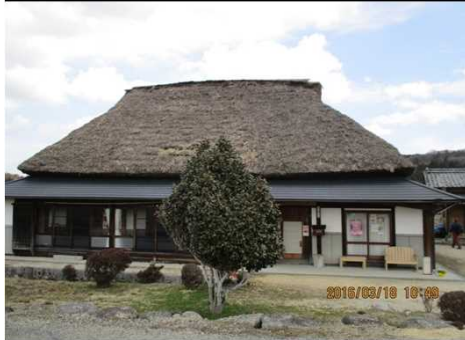
250 茅の宿 とみだ