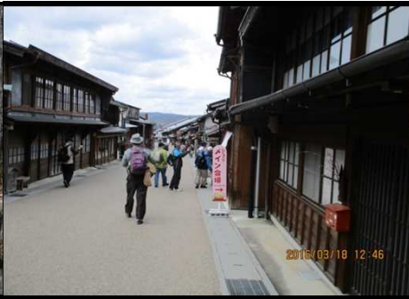
284 風情がある町並み