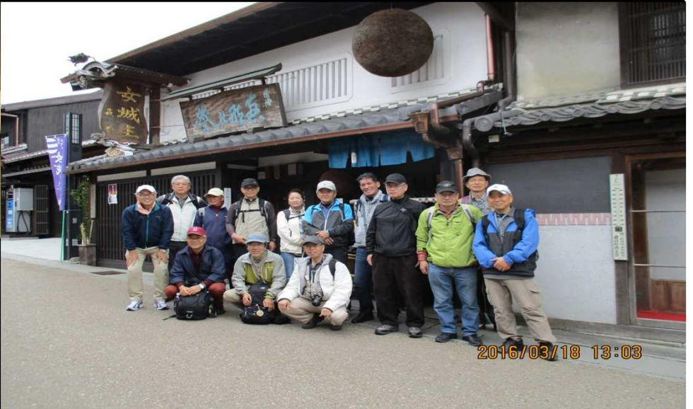
288 女城主の岩村酒造さんにて