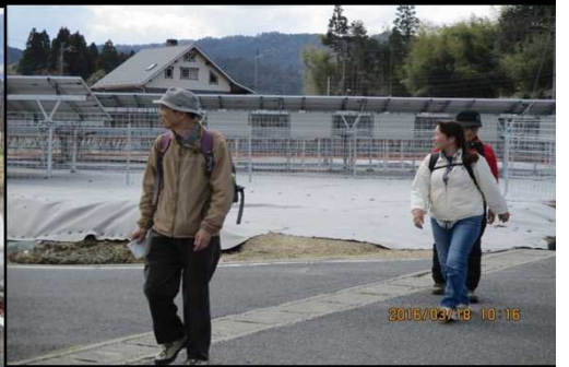
235 ソーラーパネルを見て