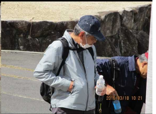
239 花粉も、水分補給も