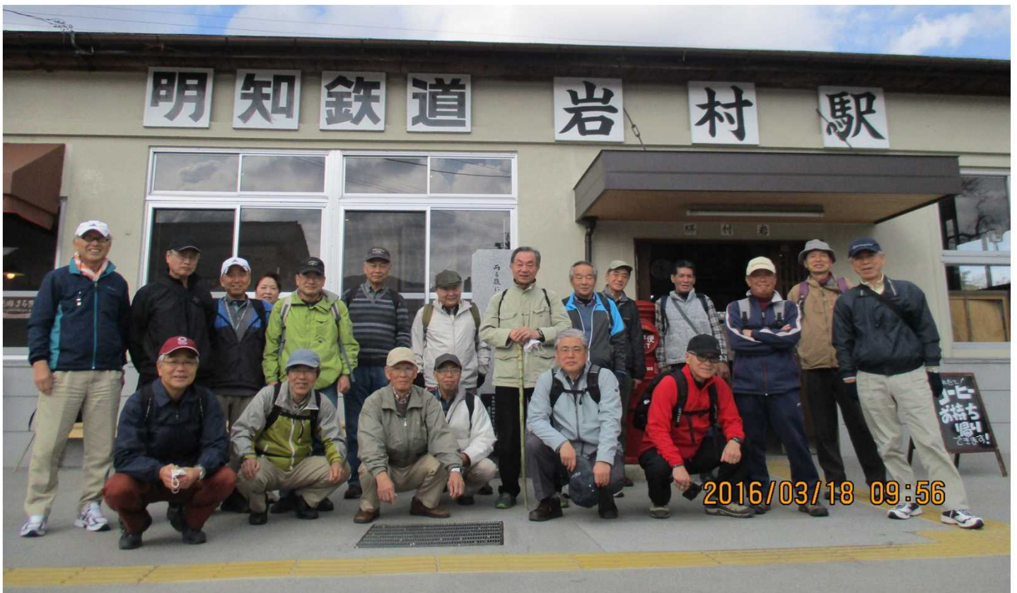
225 明智鉄道 岩村駅を曇り空の下 20名でスタート