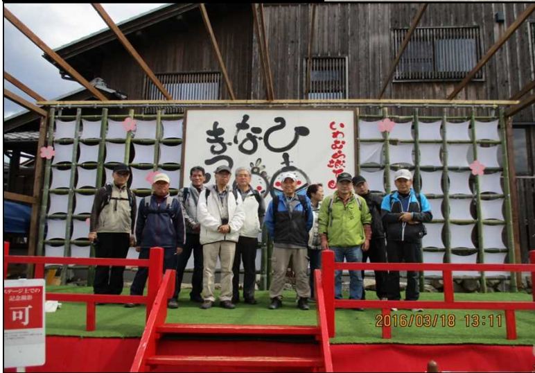
292 ひな壇で記念撮影