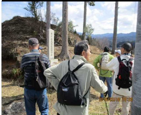
236 岩村藩鉄砲的場跡