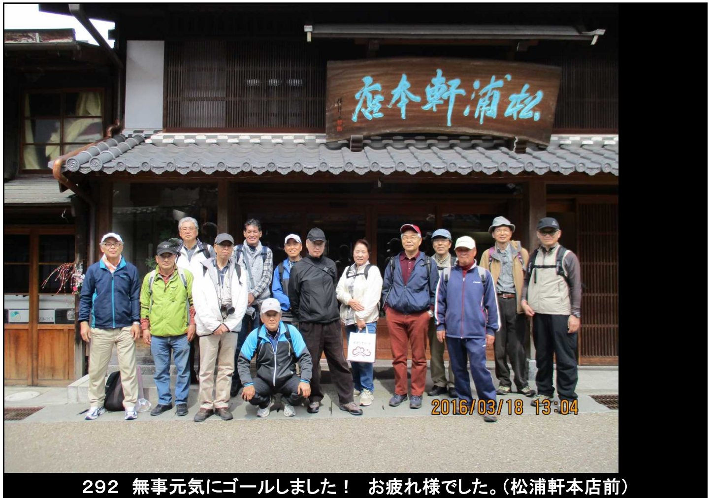
292 無事元気にゴールしました！ お疲れ様でした。(松浦軒本店前)