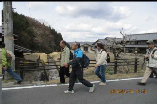
276 一見 かるやか？