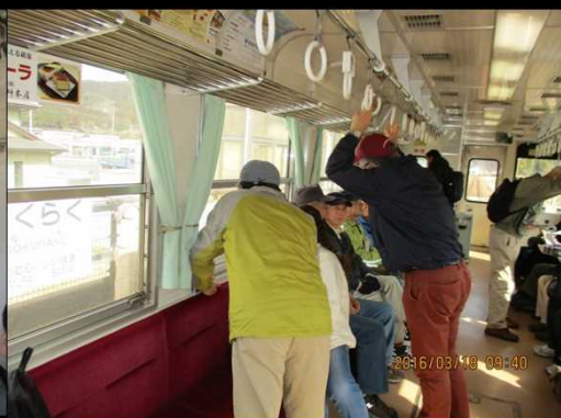
222 極楽駅で車窓を見る