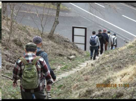
267 ようやく道路に下りる