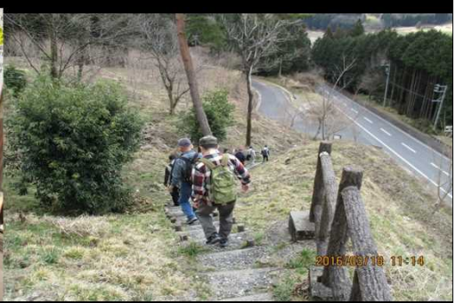
264 急な階段を下りる