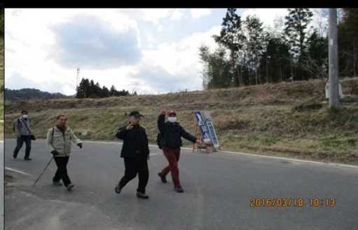
228 花粉症との戦いだ