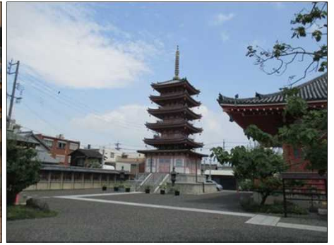
995 津観音の五重の塔