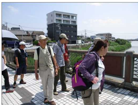
990 由緒ある欄干に感嘆