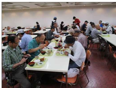
1032 一般人に交じって食べる