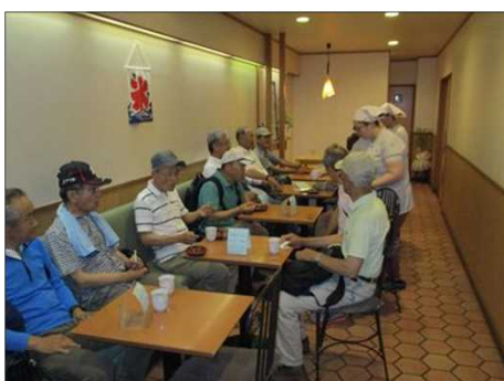
1011 店内で蜂蜜まんを頂く