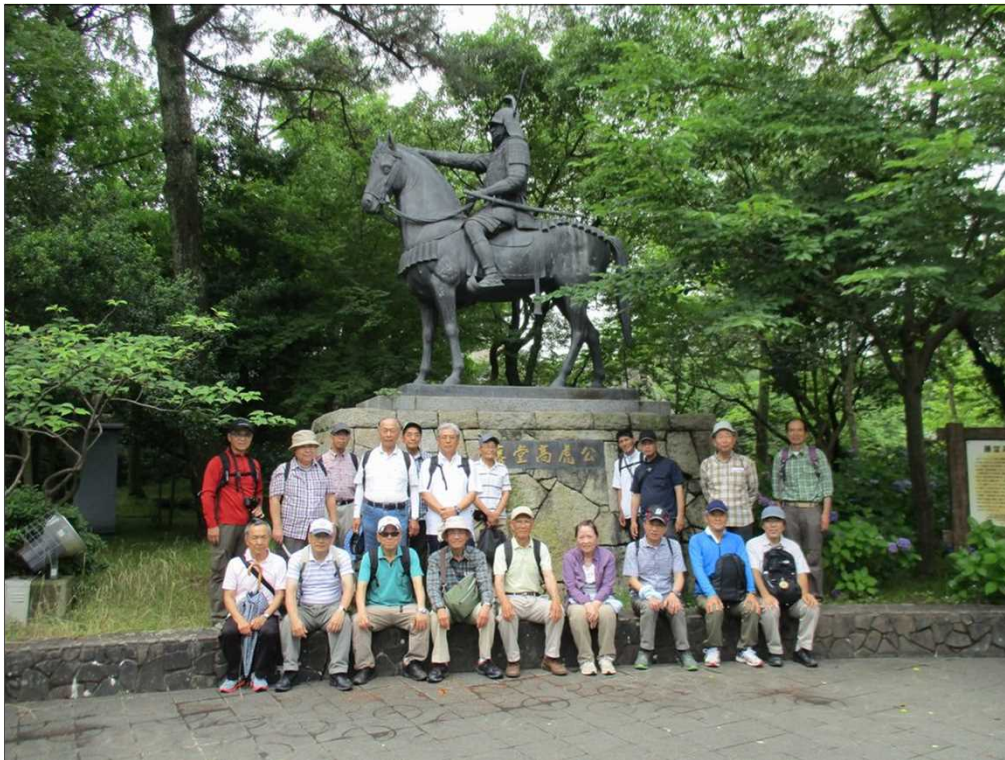
1021 津城址に立つ藤堂高虎像前に22名が揃う