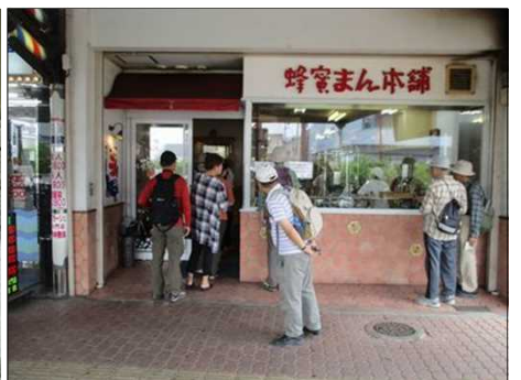
1009 蜂蜜まん本舗前にて