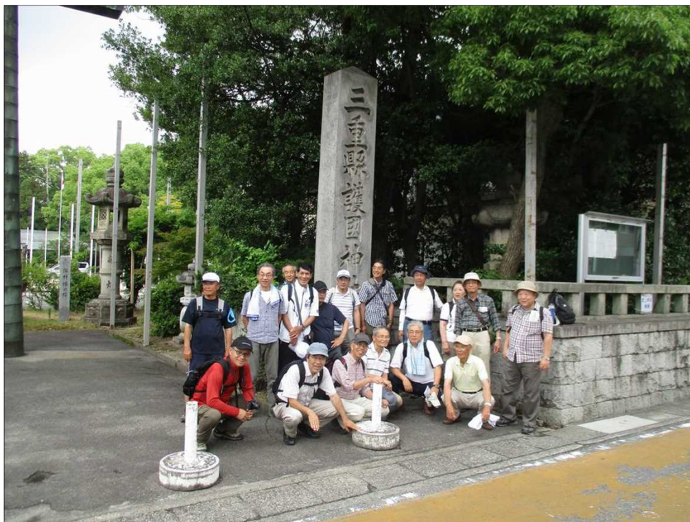
1061 津駅近くの三重県護国神社に到着