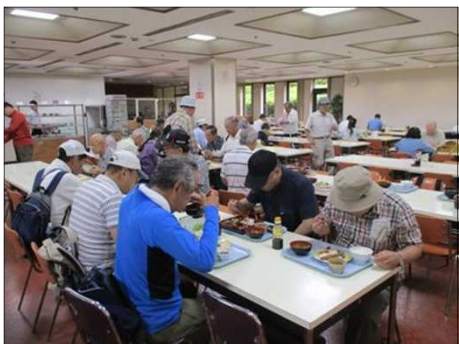
1034 津市役所職員食堂で