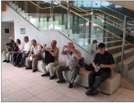
1058 三重県総合博物館にて