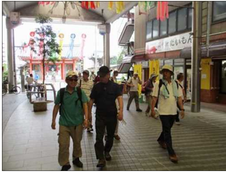
1007 アーケード内を歩く