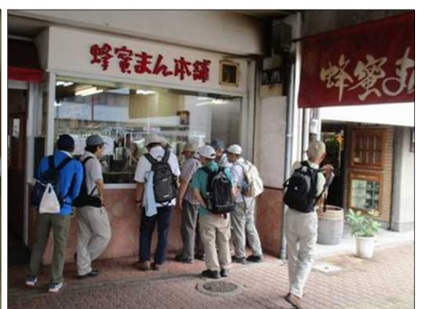
1014 蜂蜜まん作りを覗く