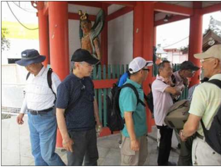
1005 津観音の仁王門にて