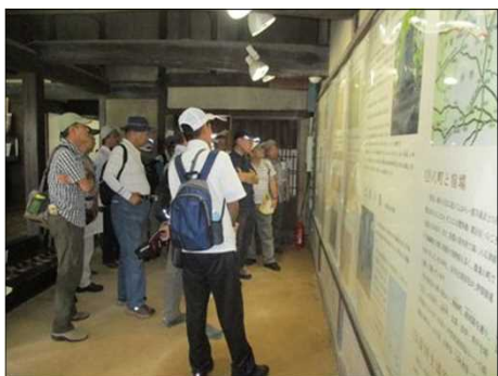
1042 全員が学芸員の話を聴く