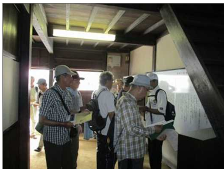
1040 谷川士清旧宅にて