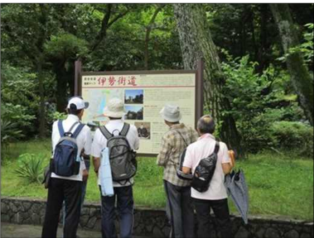
1023 伊勢街道に想いを寄せる