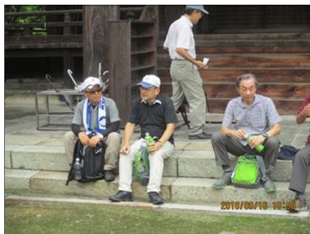
3729 専福寺の石段で休憩