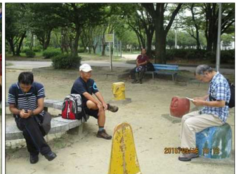
3722 皆さん 余裕たっぷり！