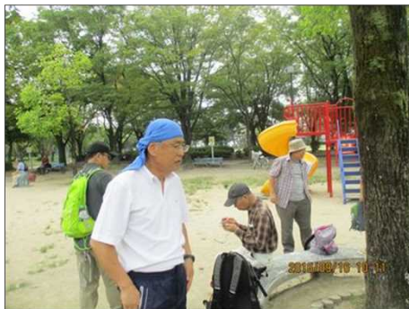
3720 頭にタオルを巻いて