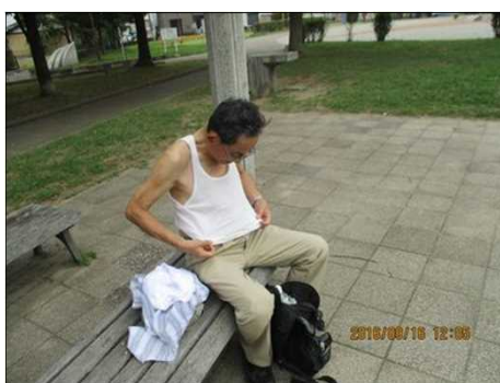
3747 墨谷さんの生着替え！