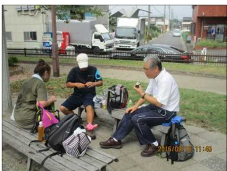
3740 アフター歩こう会は？