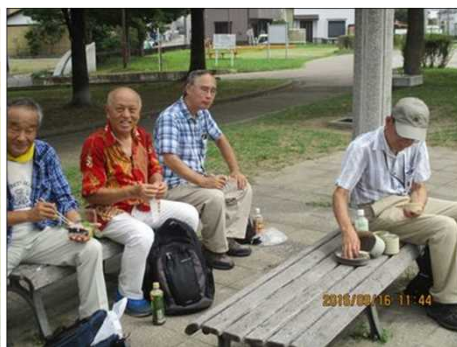
3739 歩こう会に昼が来た！