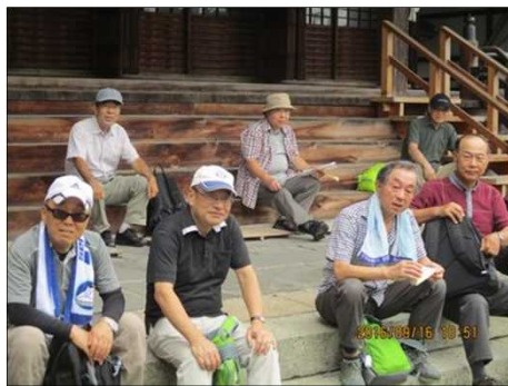
3733 お寺の石段で涼しい！