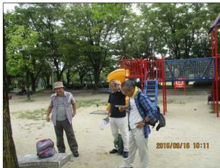
3721 最初の休憩で(彦田公園)