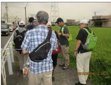
3737 田んぼの側で暫し休憩