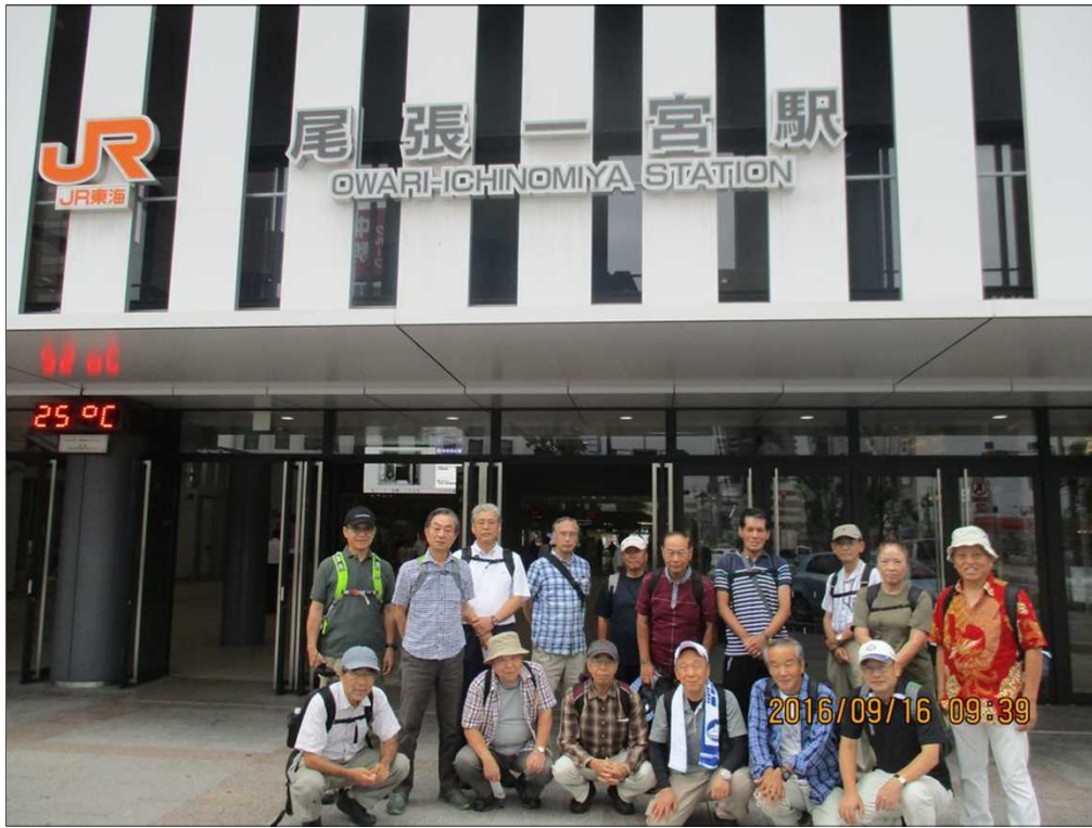
3719 曇り空の下、JR尾張一宮駅を17名で元気にスタート