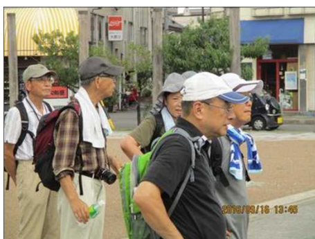
3781 ゴールの尾張一宮駅に到着