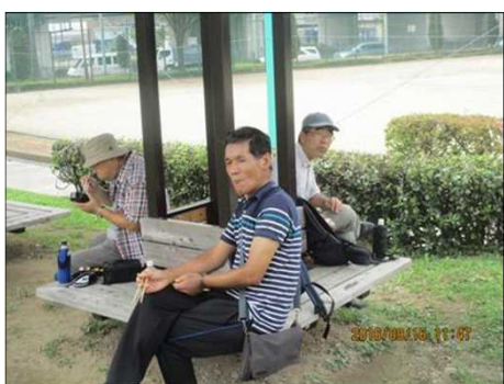
3745 ベンチに座ってお昼を