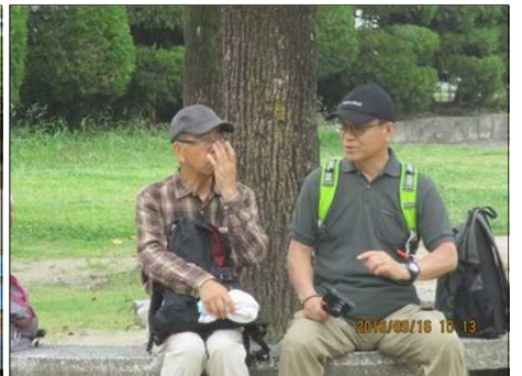
3727 久しぶりで話が弾む