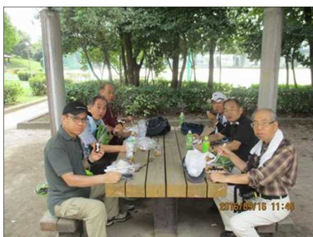
3742 揃ってお弁当を頂く