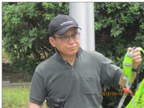
3757 平野さんのお蔭でビデオが