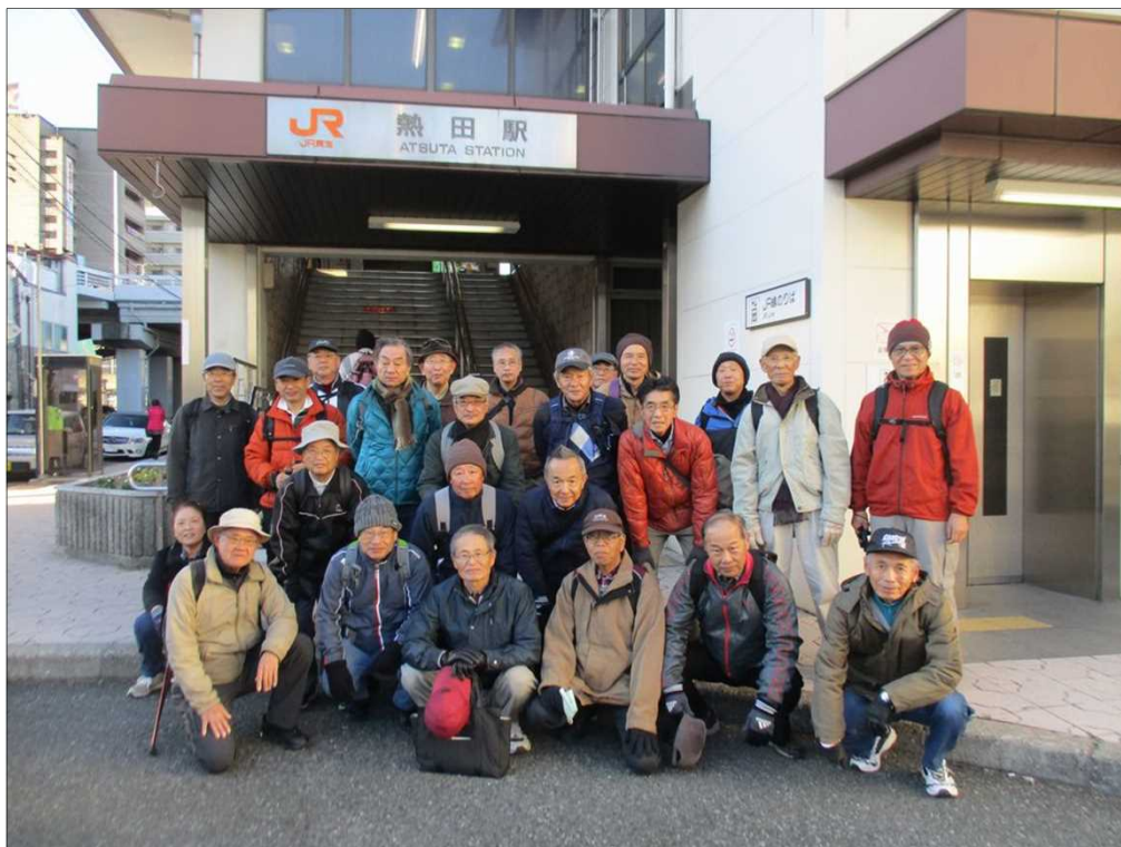
4056 無事、全員 12km 踏破！！お疲れ様