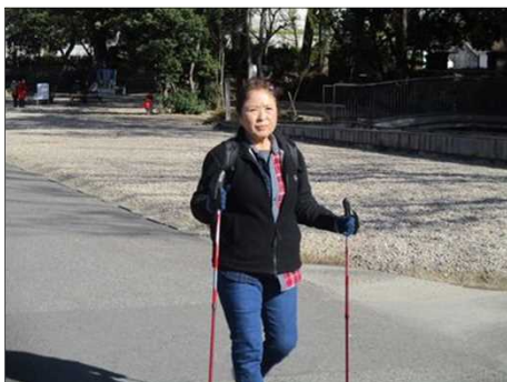
4035 我らがマドンナ参上！