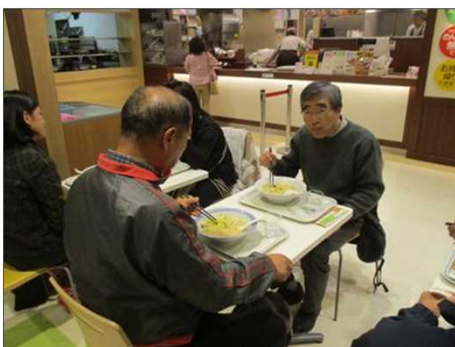
4037 イオンモール内にて