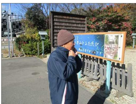
4020 八事興正寺にて電話中