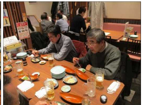
4062 今日もお酒は美味しい！