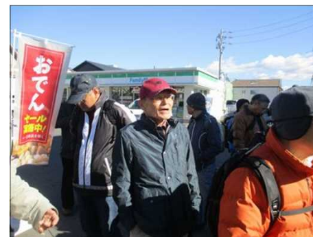
4018 皆 余裕たっぷり