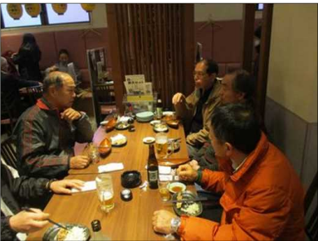
4060 ひと仕事終わって楽しむ