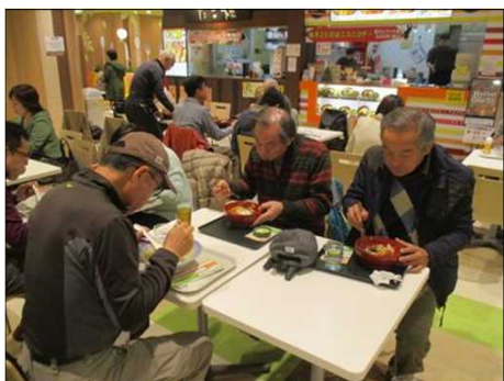
4036 昼食中 お疲れ様