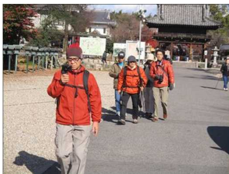
4032 ビデオ撮影ご苦労様