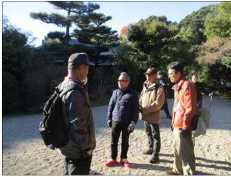
4049 暫しご休憩で談笑