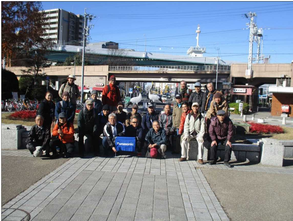
4005 鶴舞公園入口を25名元気にスタート