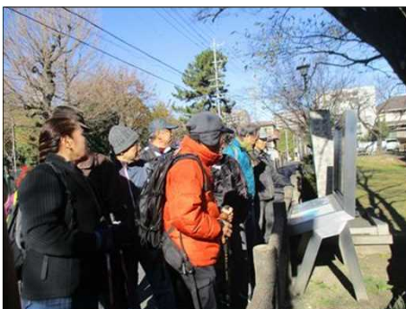
4008 大勢なので交代で見学