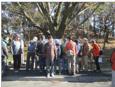
4006 八幡山古墳の説明を見る