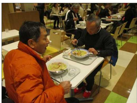
4040 こちらも長崎ちゃんぽん？