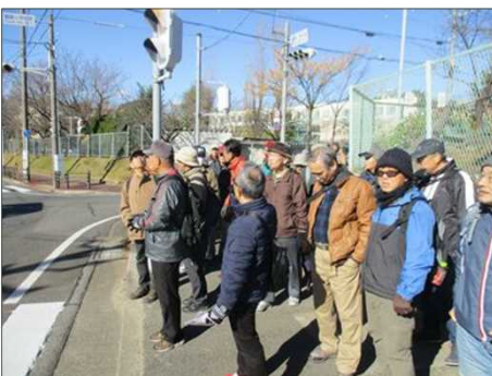
4013 道一杯になる位多い