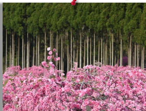
⑧ by Mr.Murata