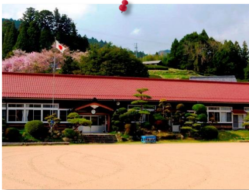
① 田峯小学校 (有形登録文化財)