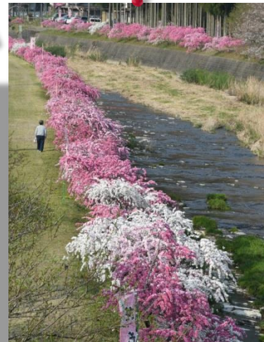
⑨ by Mr.Murata