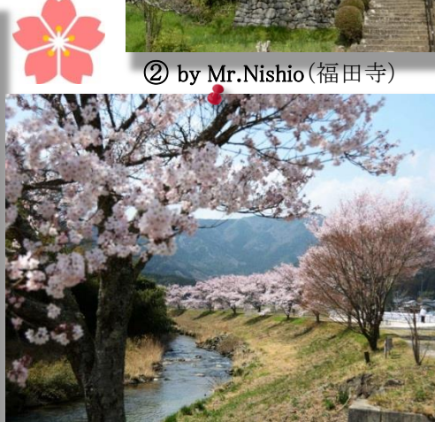
⑤ by Mr.Nishio (名倉川コガン桜並木)