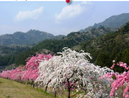
⑦ by Mr.Nishio (新城玖老勢地区 シダレ花桃)