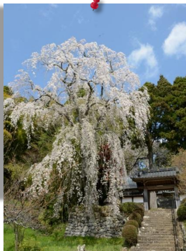
② by Mr.Nishio (福田寺)