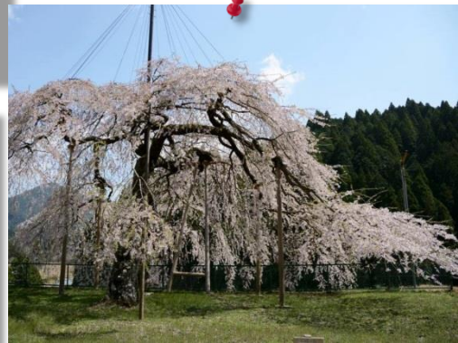
⑥ by Mr.Nishio (八橋ウハヒガン桜)