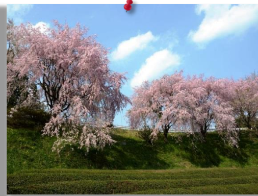
③ by Mr.Nishio