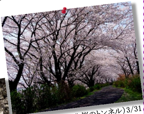
⑮by Mr.Onji(安八桜のトンネル)3/31