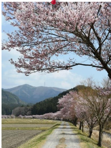
④ by Mr.Murata