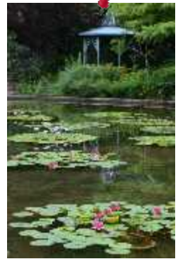
7月10日 名古屋 フラリエ スイレン