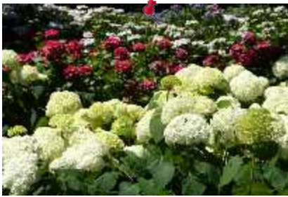
6月13日 四季の森 紫陽花