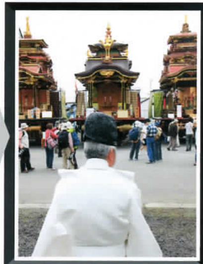
⑧

☆神前に三つの山が勢揃い。 お清めを受けて、それぞれが 舞台となって、神前奉芸が 披露される。