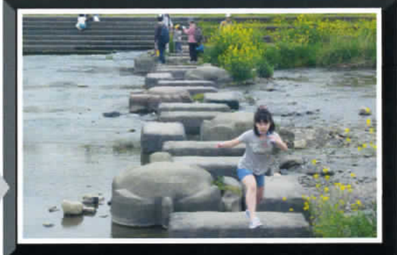
② by Mr. Fukuda