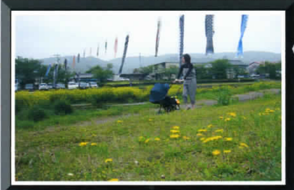
① by Mr. Fukuda