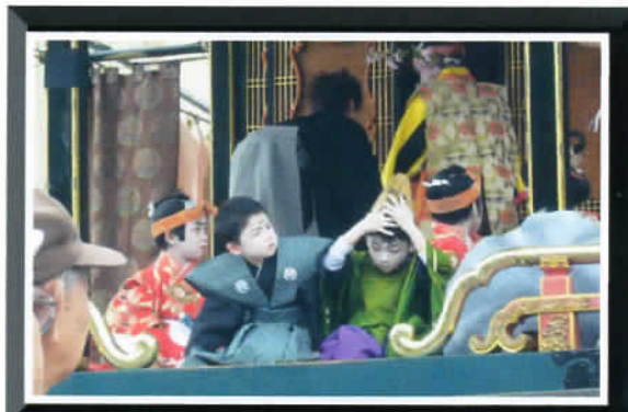
⑬ by Mr. Fukuda

☆出番待ち。 脚がしびれたり、 烏帽子が外れたり、 ここには、子供らしさが・・・