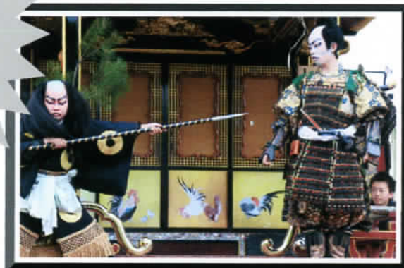
⑩

いずれ劣らぬ、 名演技ぶり！ 長台詞をこなし、 見栄を切り、踊り 真に迫り・・・ そして、女人禁制 お見事でした！