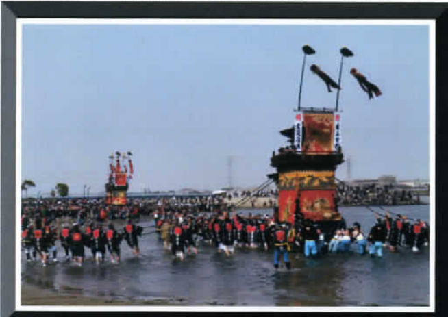
③ by Mr.Murata