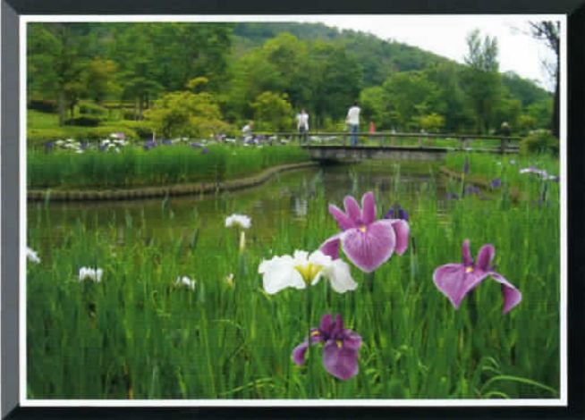
⑥