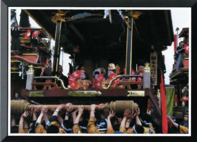
① by Mr.Murata

☆5月3日 垂井『曳山まつり(子供歌舞伎)』・・・村田さんの作品 ※拍手・喝采!!