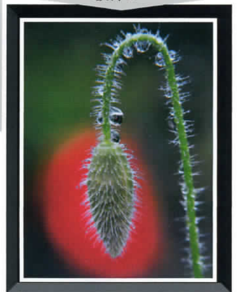
⑤ by Mr.Murata