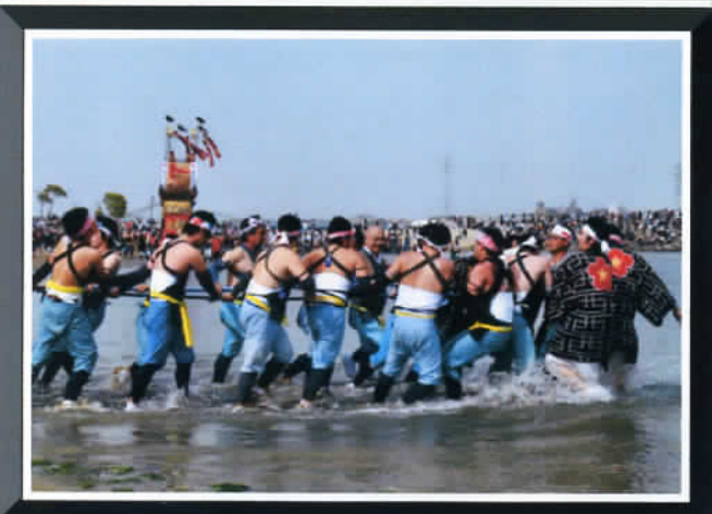
④ by Mr.Murata

☆県文化財の5輦の山車が神社前の浜辺へ地元漁師たちによって曳き下ろされる、勇壮で絢爛なまさに 伝統美 !!