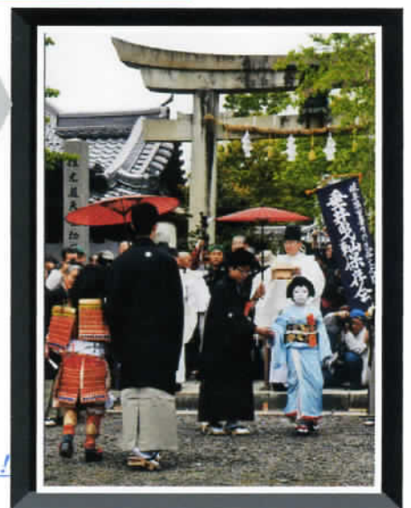
② by Mr.Murata