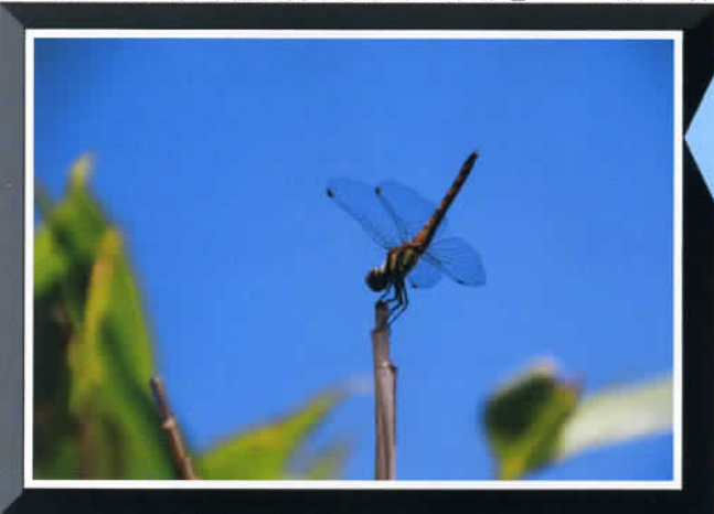
⑩ by Mr. Matsukura

☆アキアカネ; 清涼感...! 6月末羽化し、秋に 向けて、涼しい高地 (平地比-10℃)で 過ごす...! 乱舞中!