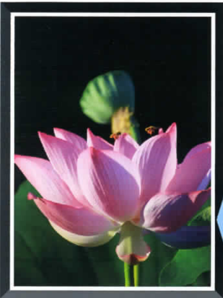
⑨