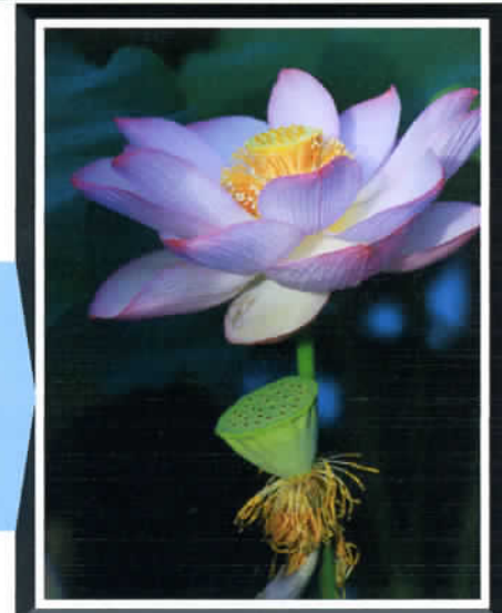
⑥

切ってしまう花！ 時刻や日差しと共に変化し、ミツバチやトンボを呼び込む存在感は 圧倒的！