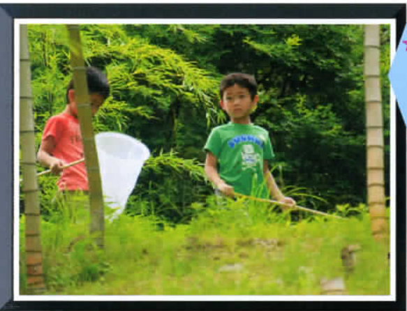
⑨