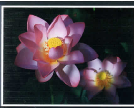
⑤ by Mr. Matsukura