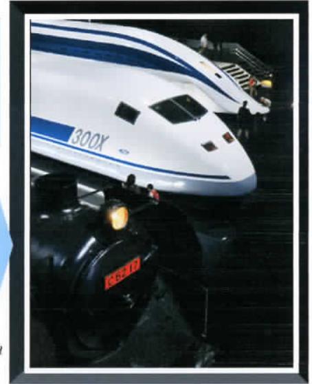
⑧ by Mr. Murata

☆時のエース達！ 手前=C621:SL世界最速(129Km/h)を達成！ 真中=700系を生み出した開発車両(300X) 奥 =リニア実験車両 未来を生み出す！