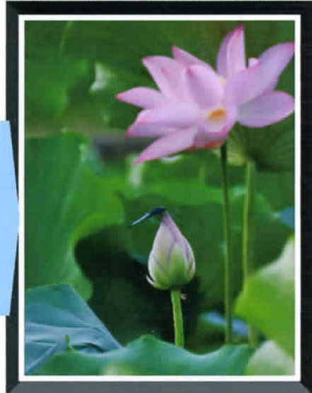
② by Mr. Murata

普段は、泥沼のような池なのですが、毎年、この時期に、蓮の花が凛として咲き誇る様には、本当に自然の力強さを感じます！