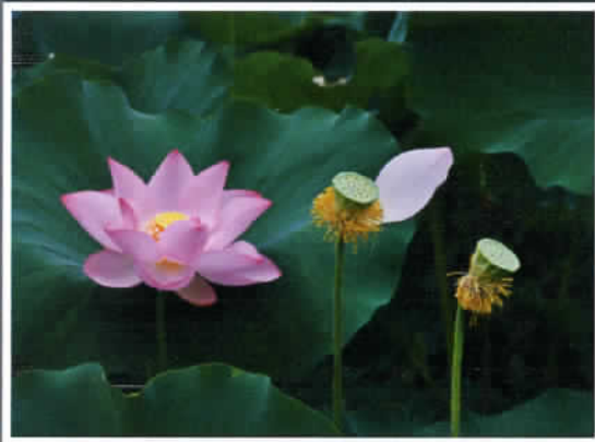
① by Mr. Murata