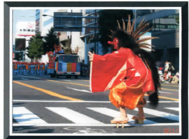
⑤ by Mr. Hotta