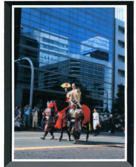
③ by Mr. Murata