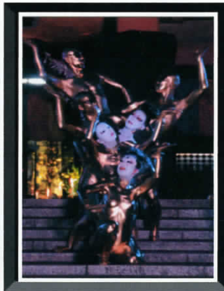
② by Mr. Murata