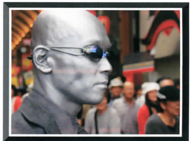
⑨ by Mr.Matsukura