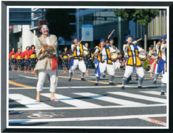
⑥ by Mr.Hotta