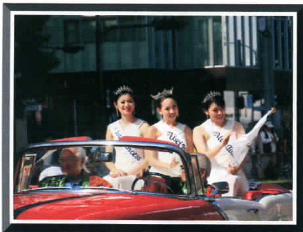
⑩ by Mr.Matsukura