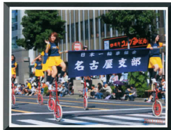
⑦ by Mr.Hotta