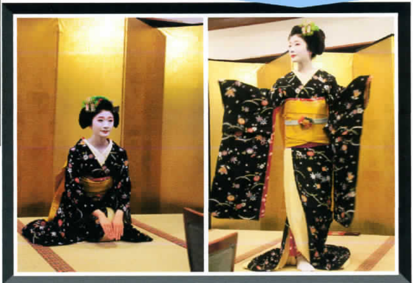
↑ ⑨ by Mr.Matsukura