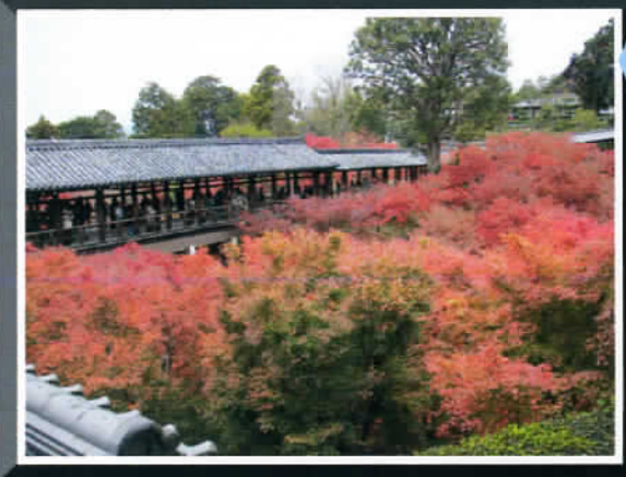
☆『東福寺』“天門橋”から“臥雲橋”を望む・・・