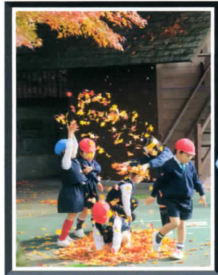
☆“永観堂幼稚園”の園児たち恵まれた環境でのびのびと・・・