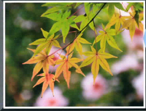
☆ピンクの山茶花をバックに・・・