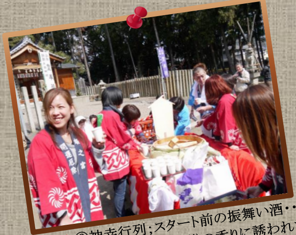
★⑧神幸行列;スタート前の振舞い酒・・・お姉さんの笑顔と樽の香りに誘われて! by Mr.Fukuda

★神幸行列;先頭は、天狗(猿田彦)⑨、楽器、騎乗の役人⑩、神輿、花笠⑪などが続きます。 ⑨by Mr.Murata ⑩⑪by Mr.Matsukura