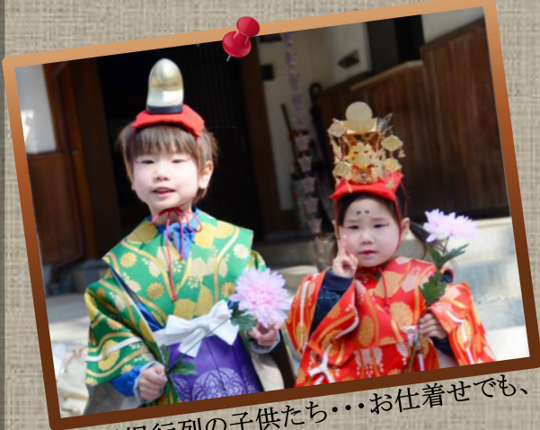
★⑦稚児行列の子供たち・・・お仕着せでも、可愛く「はい、ポーズ！」 by Mr.Murata

★豊年祭;午前11時～“稚児行列”が、午後1時～“神幸行列”が行われ、お神酒も入って徐々に祭りらしい賑わいになって来ました。