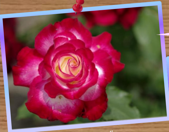
① by Mr.Onji