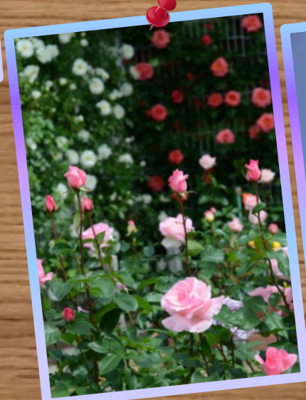
⑥ by Mr.Murata