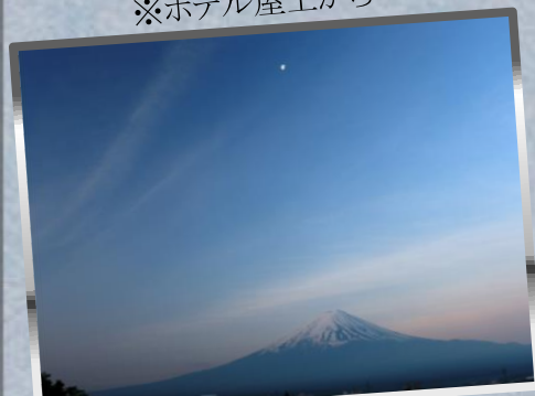
⑬夜明けの富士 ※ホテル屋上から