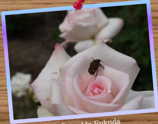
④ by Mr.Fukuda