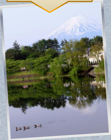
⑮湖畔から富士を・・・

☆5月4・5日 名古屋市『よさこい夢まつり』(白鳥庭園、熱田神宮);村田さんの“まつり探訪”作品(⑯～⑲)