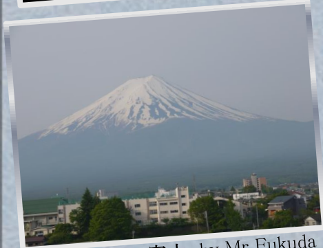
⑪早朝の富士 by Mr.Fukuda ※ホテル屋上から