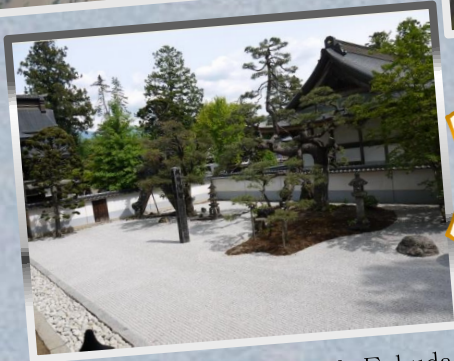
⑫恵林寺 石庭 by Mr.Fukuda