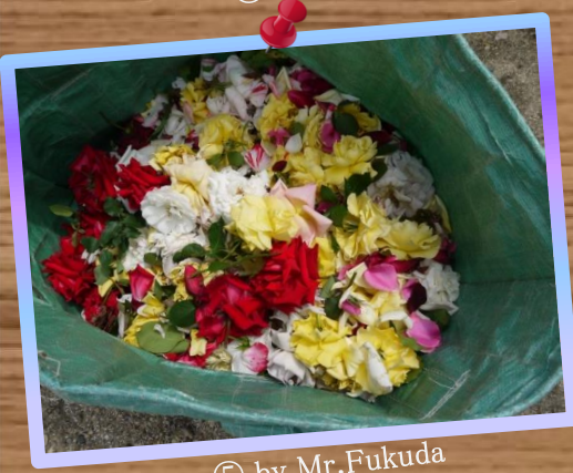
⑤ by Mr.Fukuda