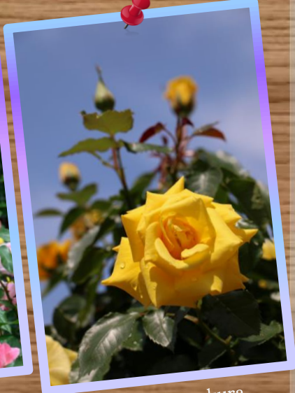
⑦ by Mr.Matsukura