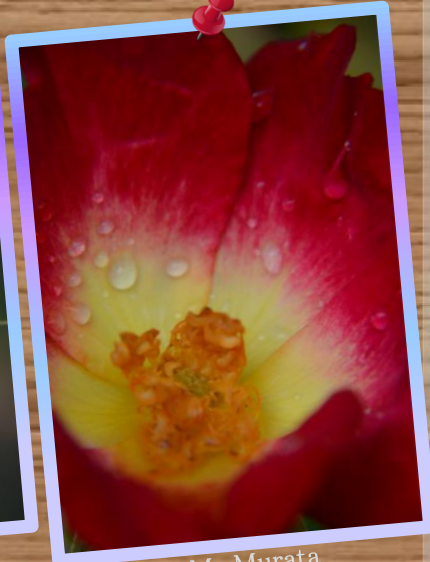
③ by Mr.Murata