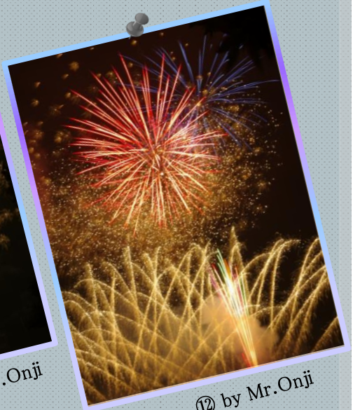
⑫