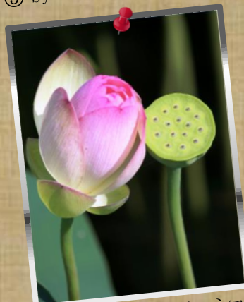
⑧ by Mr.Matsukura; ツーショット