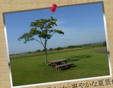
③ by Mr.Fukuda; 爽やかな夏景色