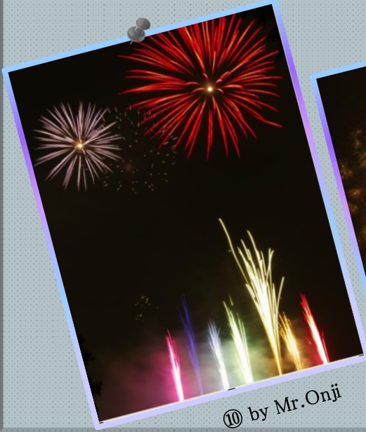
⑩ by Mr.Onji