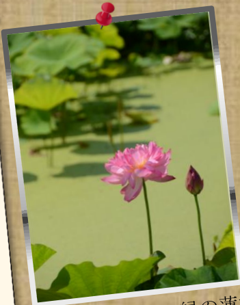
② by Mr.Murta; 緑の蓮池...