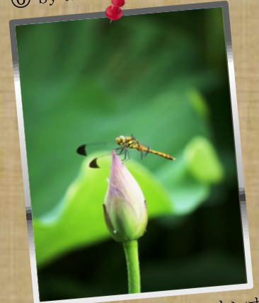
⑨ by Mr.Matsukura; 蕾にトンボ