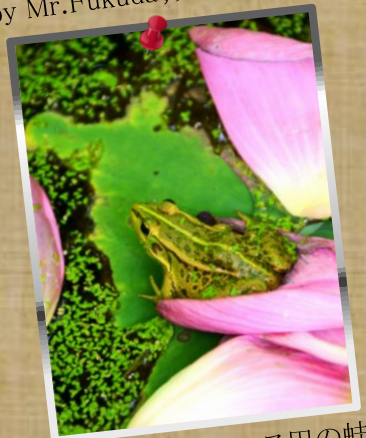
⑥ by Mr.Murata; ハス田の蛙