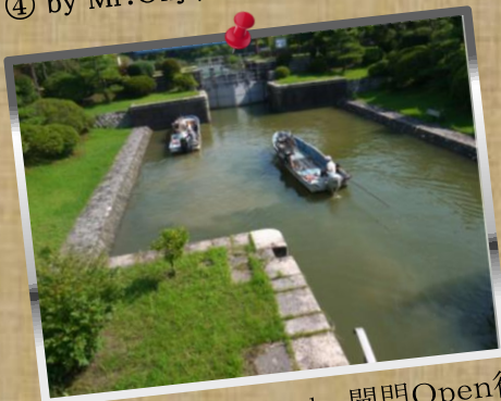
⑦ by Mr.Fukuda; 閘門Open待ち!