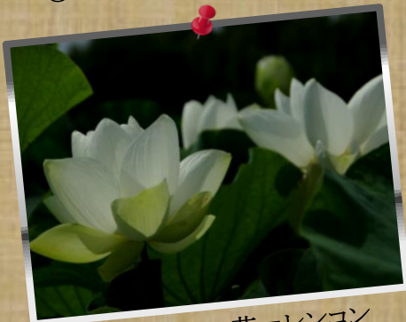
④ by Mr.Onji; 白い花=レンコン