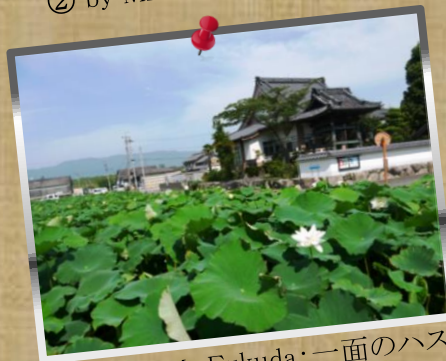
⑤ by Mr.Fukuda; 一面のハス田