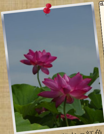
① ; 際立つ紅色