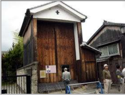
山車倉・「関の山」の語源にも