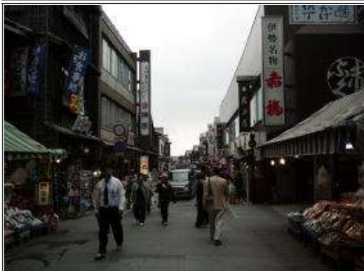
おはらい町・お祭りみたいに賑やかです