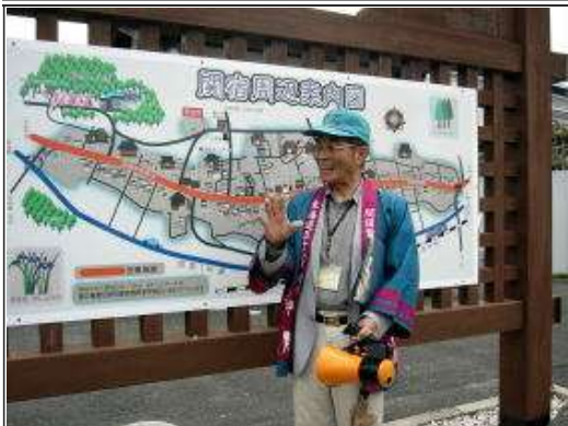
関宿の案内、ありがとうございました