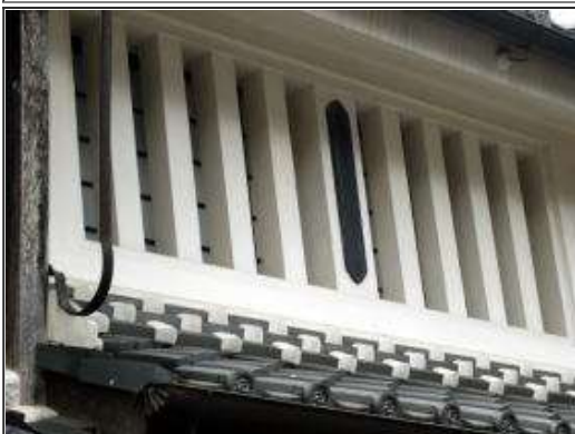
虫籠窓・上から見下ろすとお手打