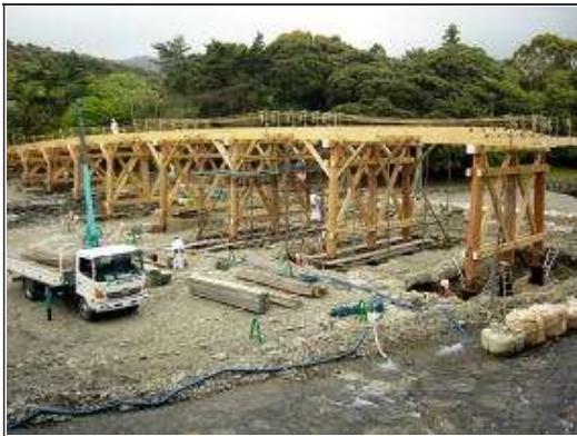
内宮入口の宇治橋・式年遷宮架けかえ中