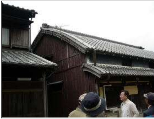
職人泣かせの屋根・壁の漆喰黒色を見て