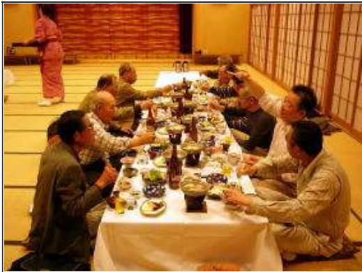
お酒が入れば盛り上がります