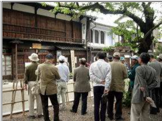
関宿を代表する旅籠「会津屋」だった？