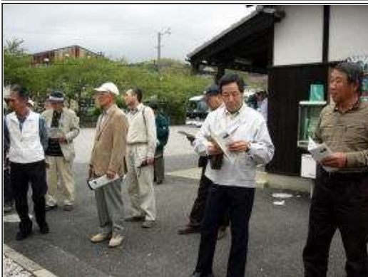
熱心に聞き入る皆さん