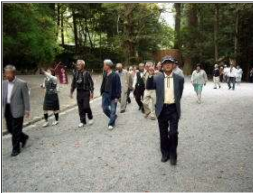
身も心も清めてお参りしましょう