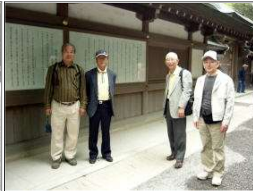
お参り後の清々しい皆様です