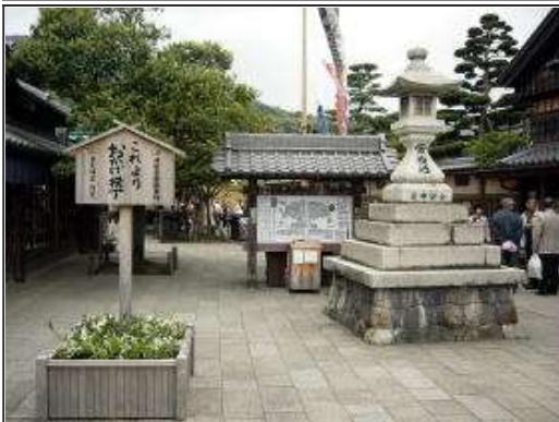
おかげ横丁入り口