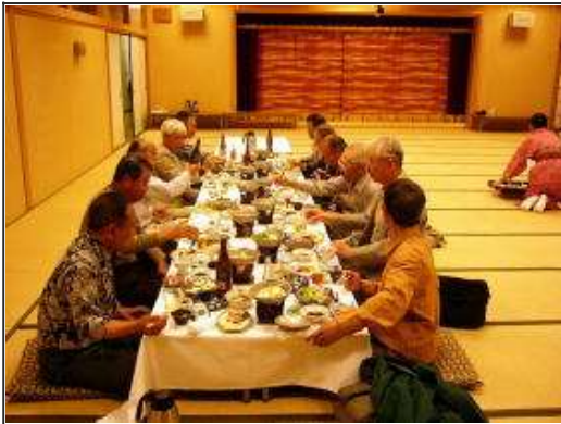
こちらのテーブルだって負けてません