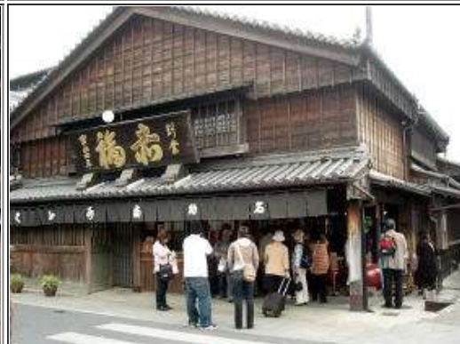
赤福本店・例の騒ぎもなんのその・・・