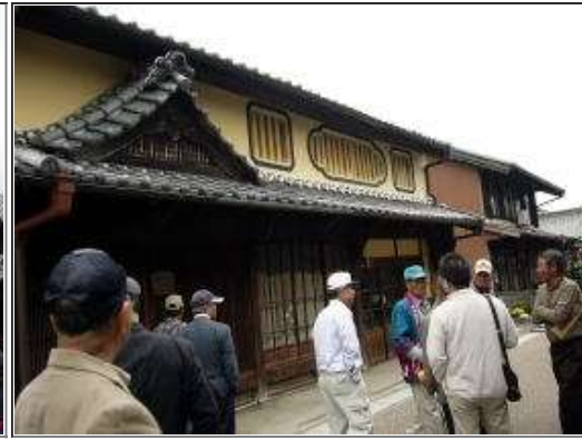
旅籠「鶴屋」・壁黄（1黒2黄3白） 格式順？