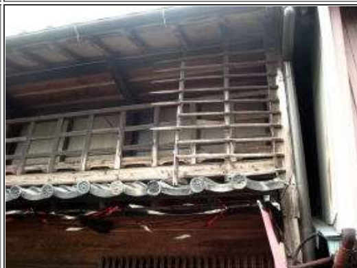
忍び返し？だったか、忘れた