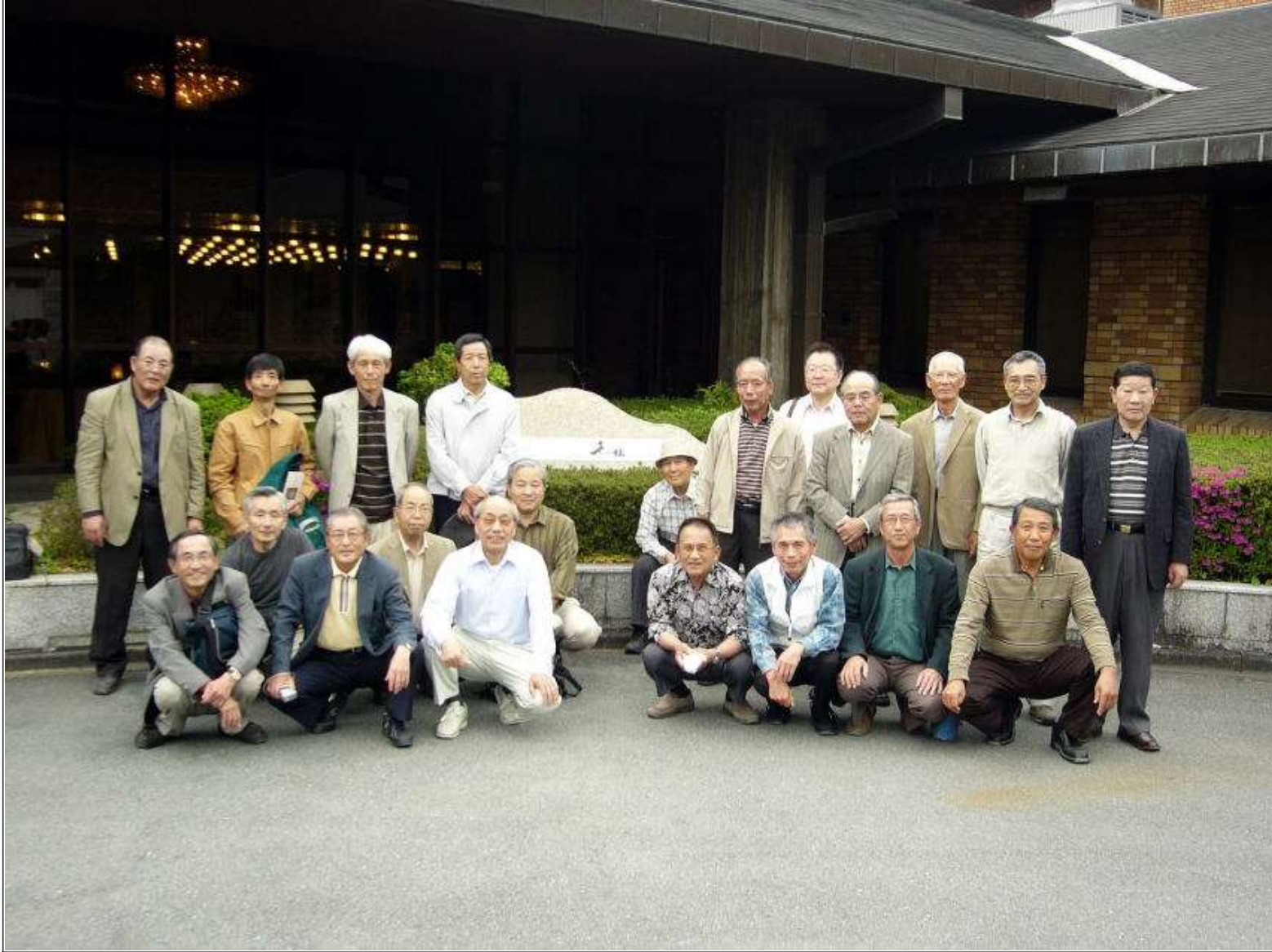
千の杜 玄関前にて記念撮影（歓迎と送別のドラの音が忘れられません）