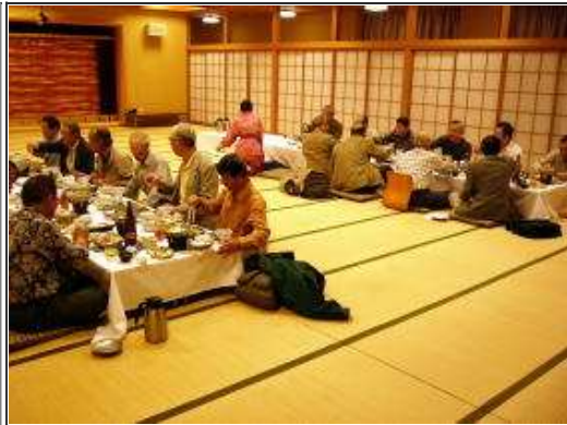
つい飲みすぎちゃって予算オーバー？