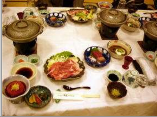
会席料理・これだけでも元は取れた？