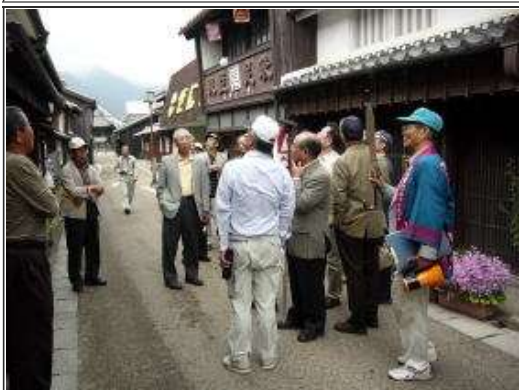
全長1.8kmの1/3をゾロゾロと見学