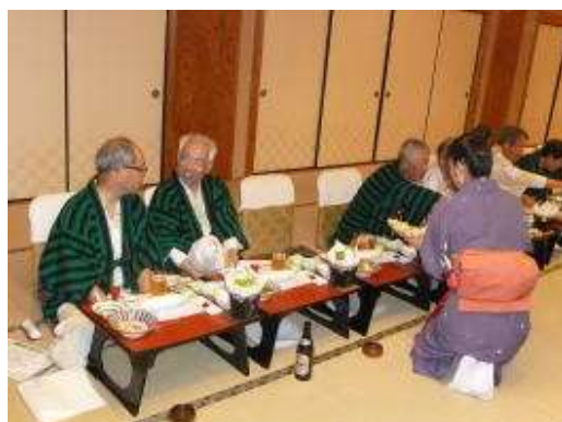
明日の歩きは駄目だね