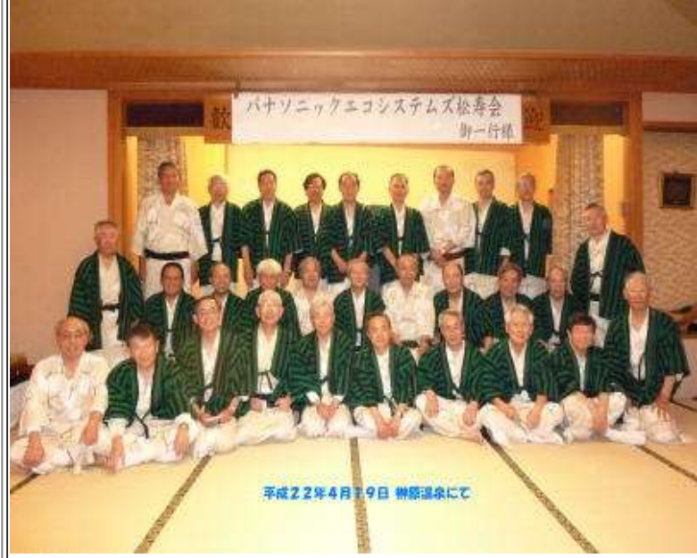
平成22年4月19日 榊原温泉にて