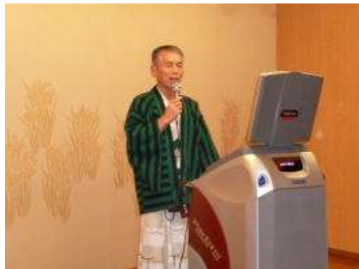
なかなかの音量です