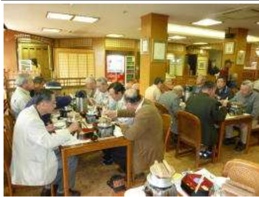
先ずは腹ごしらえから