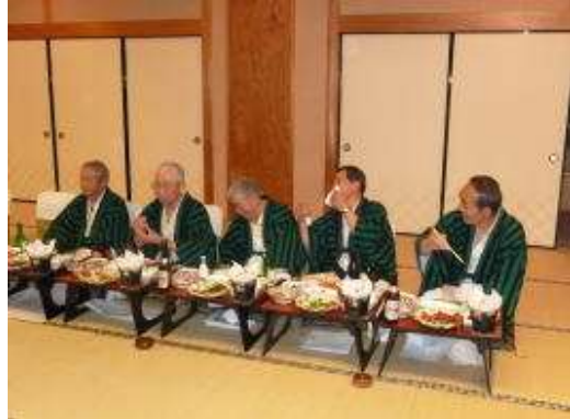
取りあえず今日は飲もう！