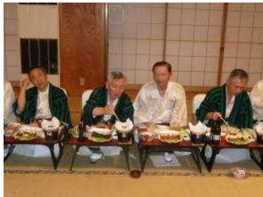
料理まあまあかな