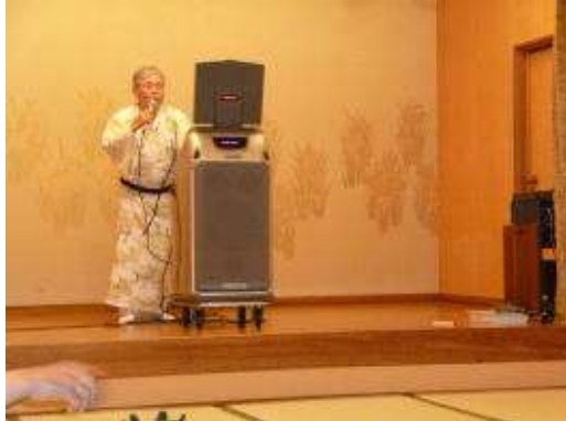
いつものように幕が開き