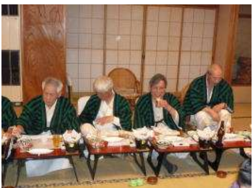
ビール飲み放題だって