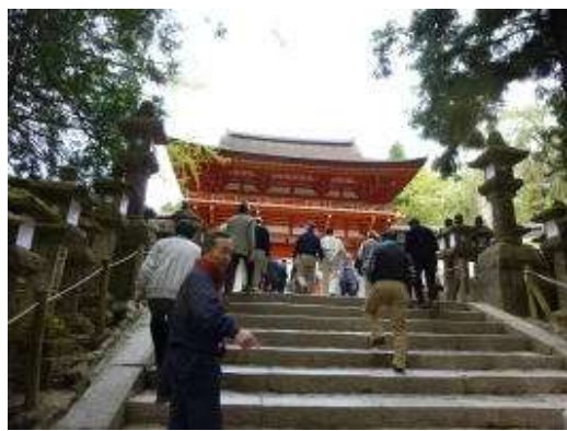
春日大社への上り階段