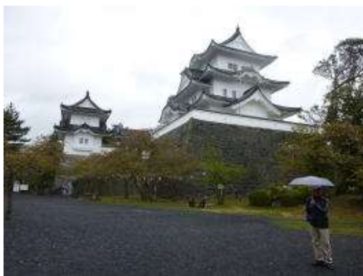
伊賀上野城のふもとで佇むは誰？