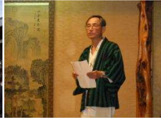
榊原温泉 地区代表の挨拶