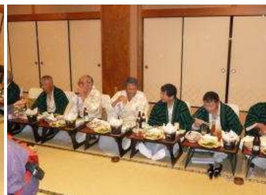
ゴルフもどうなることやら