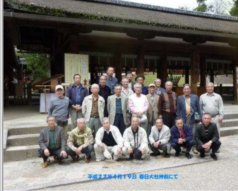
平成22年4月19日 春日大社前にて