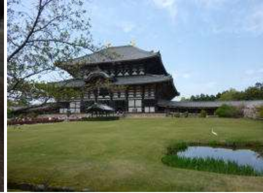
庭園より眺める東大寺