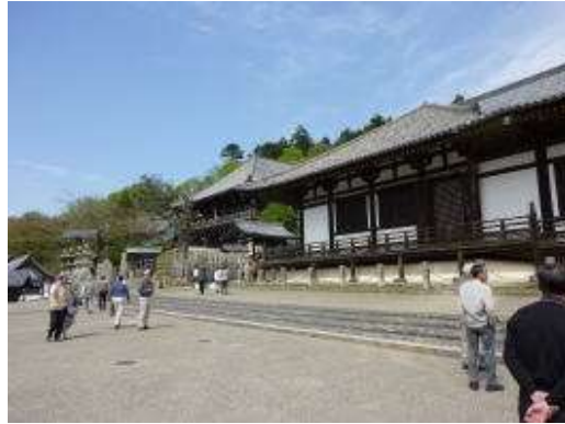
左・二月堂、右・三月堂へ