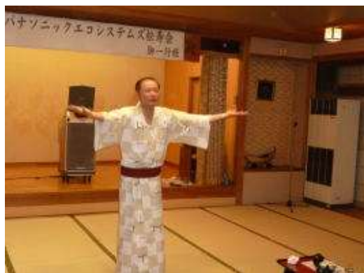
なかゞでござい、お手を拝借