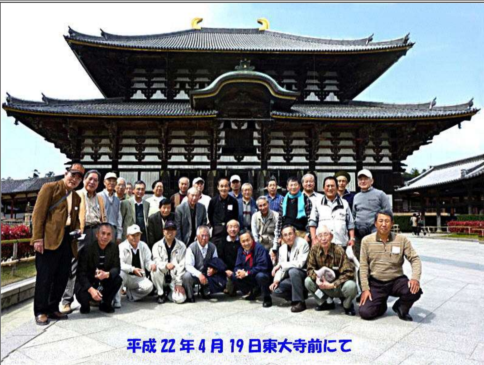
平成22年4月19日東大寺前にて