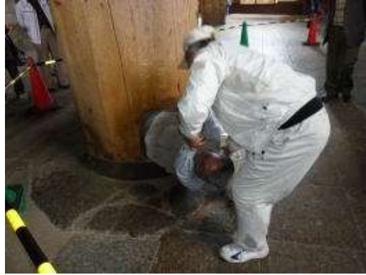
柱を潜ってるヨ・抜けますか？