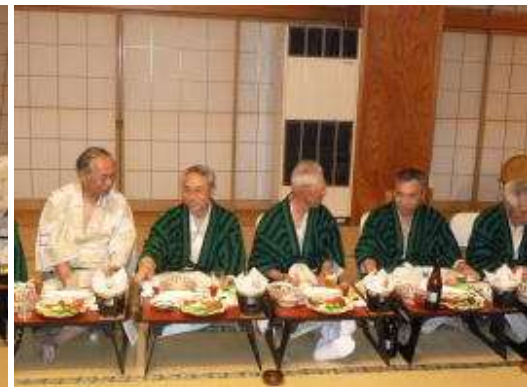
明日の天気心配だなー