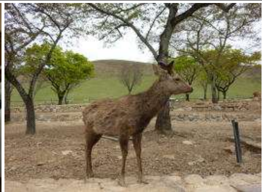
若草山名物の鹿さんです