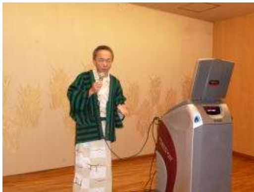
宴会の司会、ご苦労様でした