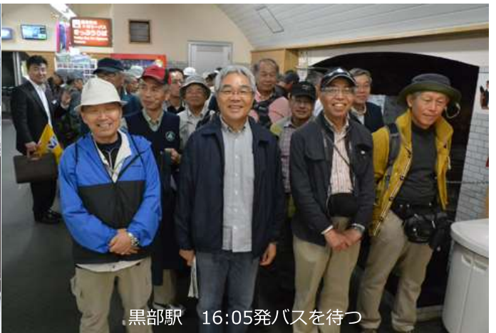
黒部駅 16:05発バスを待つ