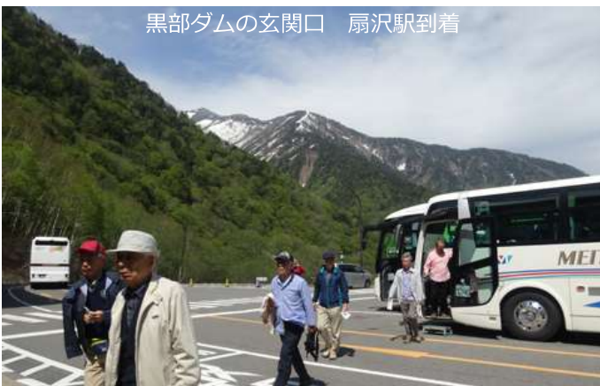
黒部ダムの玄関口 扇沢駅到着