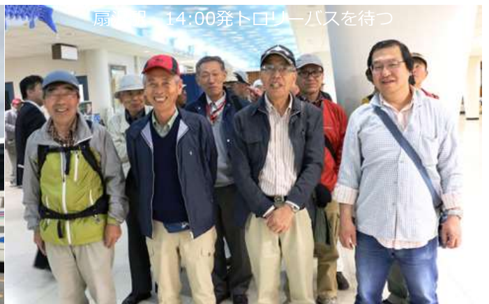
扇沢駅 14:00発トロトロバスを待つ