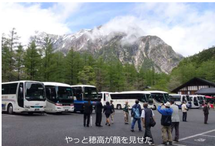
やっと穂高が顔を見せた