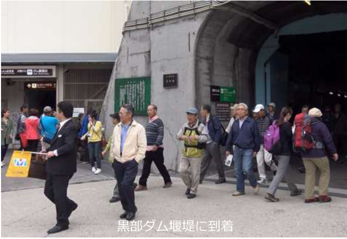
黒部ダム堰堤に到着