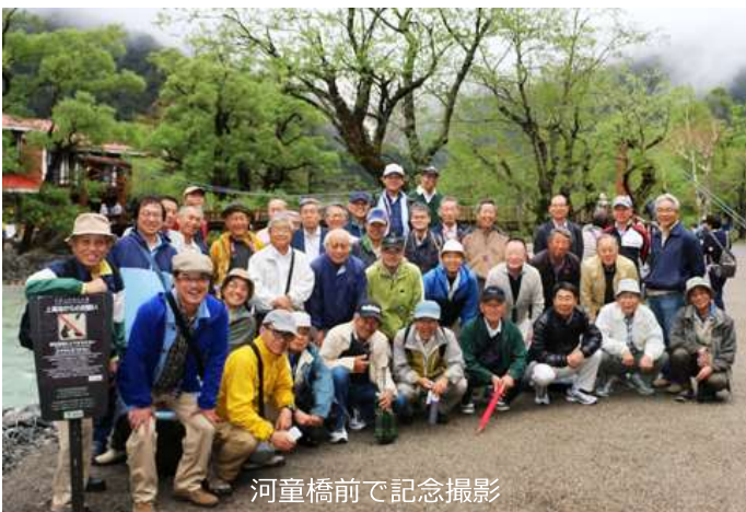
河童橋前で記念撮影