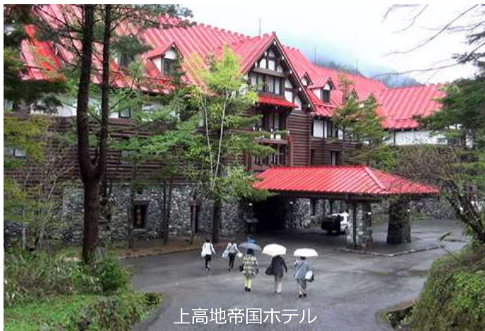
上高地帝国ホテル