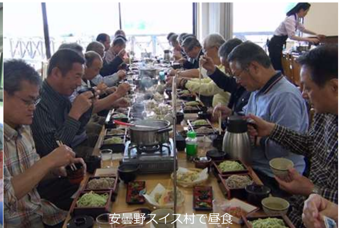
安曇野スイス村で昼食