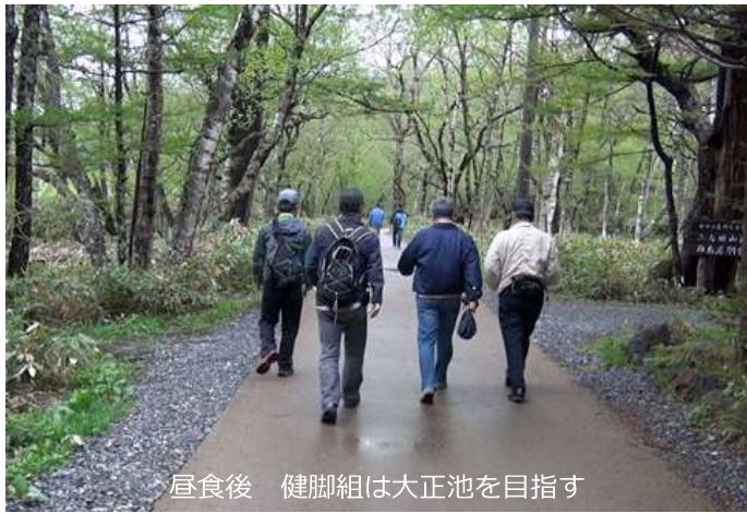
昼食後 健脚組は大正池を目指す