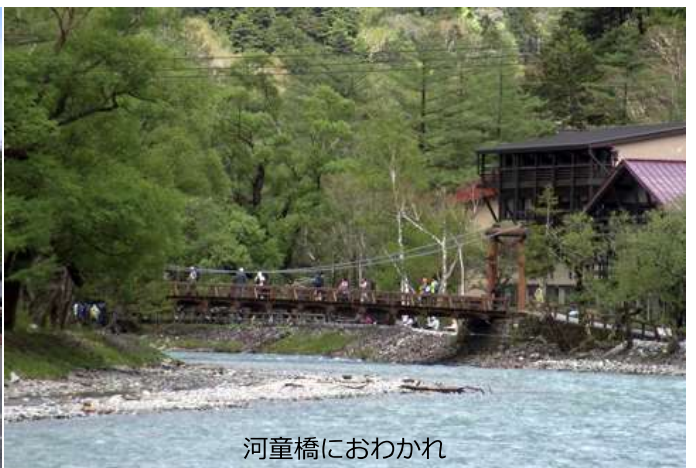
河童橋におわかれ