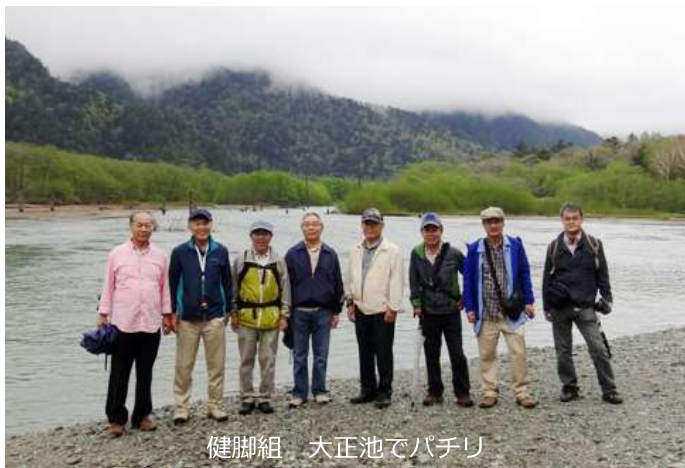
健脚組 大正池でパチリ