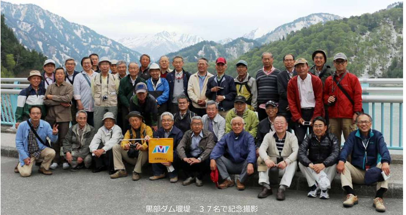
黒部ダム堰堤 37名で記念撮影

2015年5月18日(月)～19日(火)松寿会春日井地区レクレーションを開催。過去最多39名に次ぐ37名の参加を得て、残雪と新緑の黒部ダムと上高地を楽しみました。電力不足解消のため、171名の殉職者を出す命をかけた難工事を克服し完成した黒部ダム、英国人宣教師W・ウェストンが世界に魅力を紹介し、今や日本を代表する山岳リゾートとして揺るぎない上高地は、自然と人工の雄大な絶景に圧倒されるとともに、その歴史に思いをはせると感動もひとしおでした。(記:平野功)