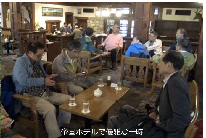
帝国ホテルで優雅な一時