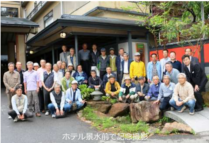
ホテル景水前で記念撮影