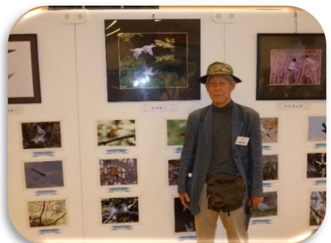
【小笠原貞二さん「鳥の写真」展】