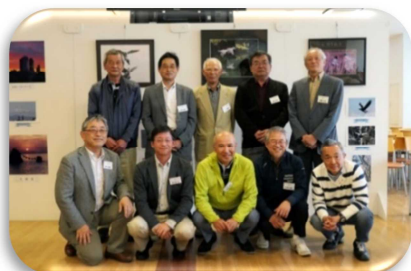
【慶事と新入会員の皆さん】