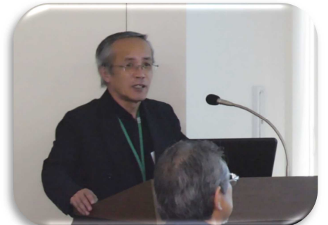
【小島さん会計報告】